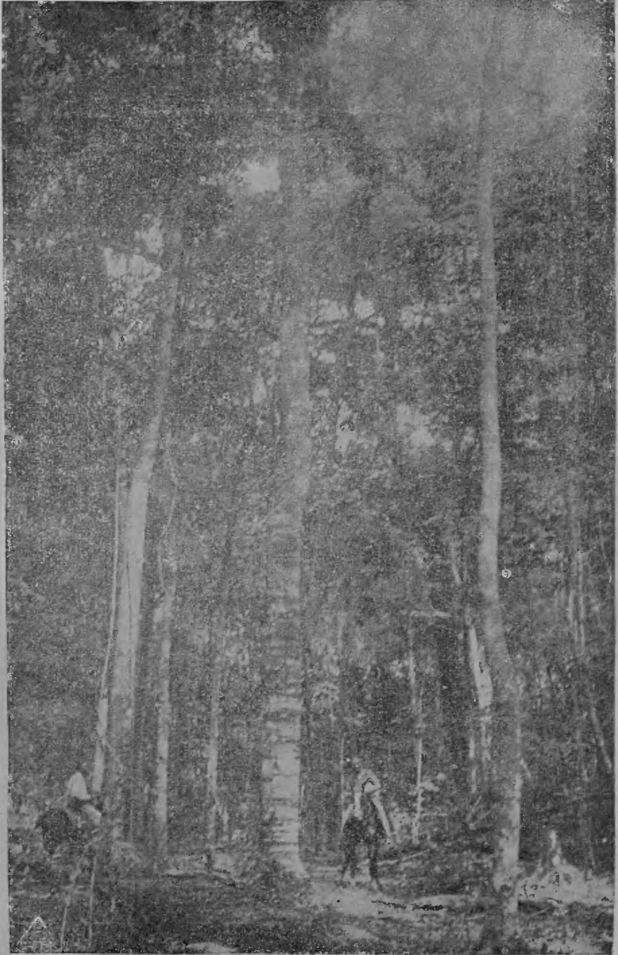
Un atractivo rincón de la floresta dominicana