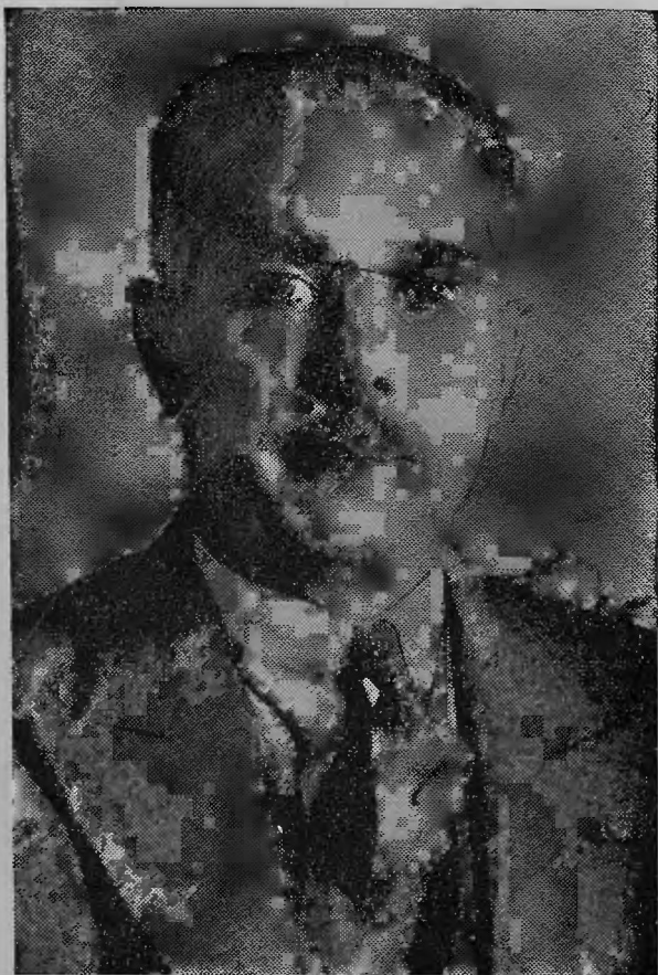
Generalísimo Dr. Rafael Leonidas Trujillo Molina Presidente de la República y Benefactor de la Patria