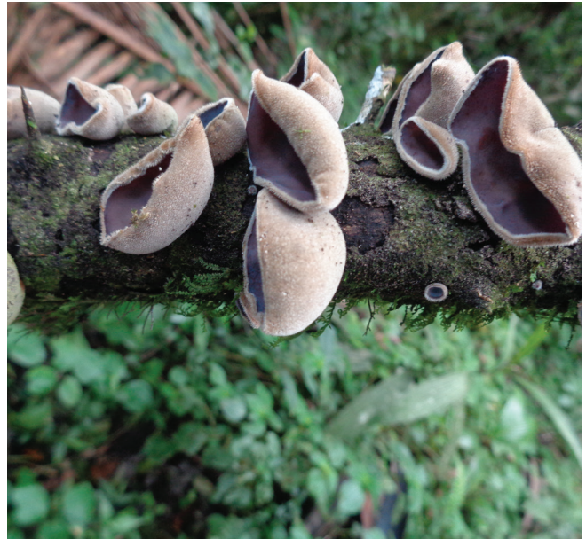
Foto 3. Auricularia polytricha

La mayor diversidad de especies corresponden a las familias Cerrenaceae, Hymenochaetaceae y Polyporaceae, se recolectaron las especies: Datronia caperata , Hexagonia hydnoides , Phellinus gilvus , Phellinus robinae , Earliella scabrosa , Ganoderma applanatum , G. resinaceum , Polyporus trichloma , Pycnoporus sanguineus , Trametes hirsuta y T. mebranacea . Es de esperar una alta diversidad de hongos poroides debido a que muchas especies son anuales o bianuales y les favorece la estructura y composición de la vegetación que está caracterizada por una alta heterogeneidad. Además, se comunican de la familia Auriculariaceae las especies comestibles: Auricularia polytricha y Auricularia auricula-judae . (Foto 3).