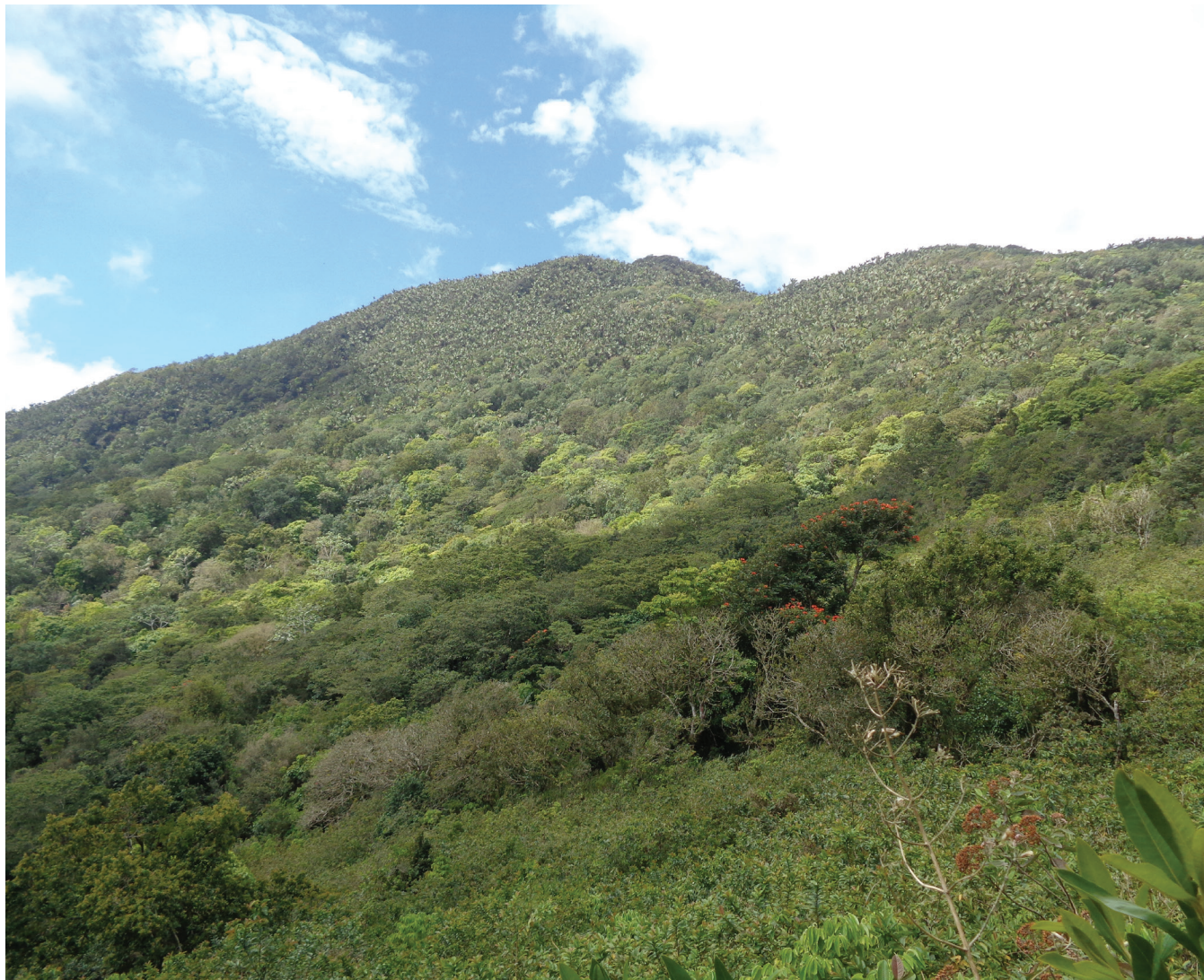
Foto 1. Vista del Monumento Natural Pico Diego de Ocampo