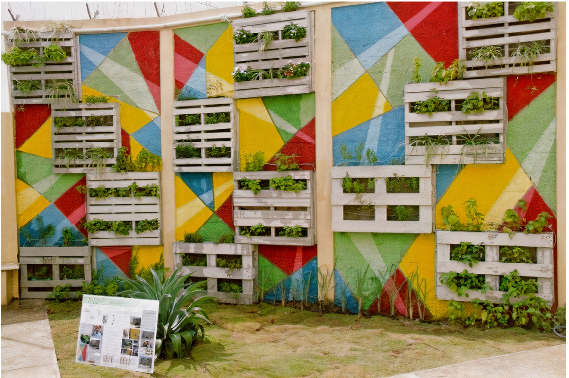
3er. Lugar Centro Educativo Domingo Savio-Los Guandules-PCUMM