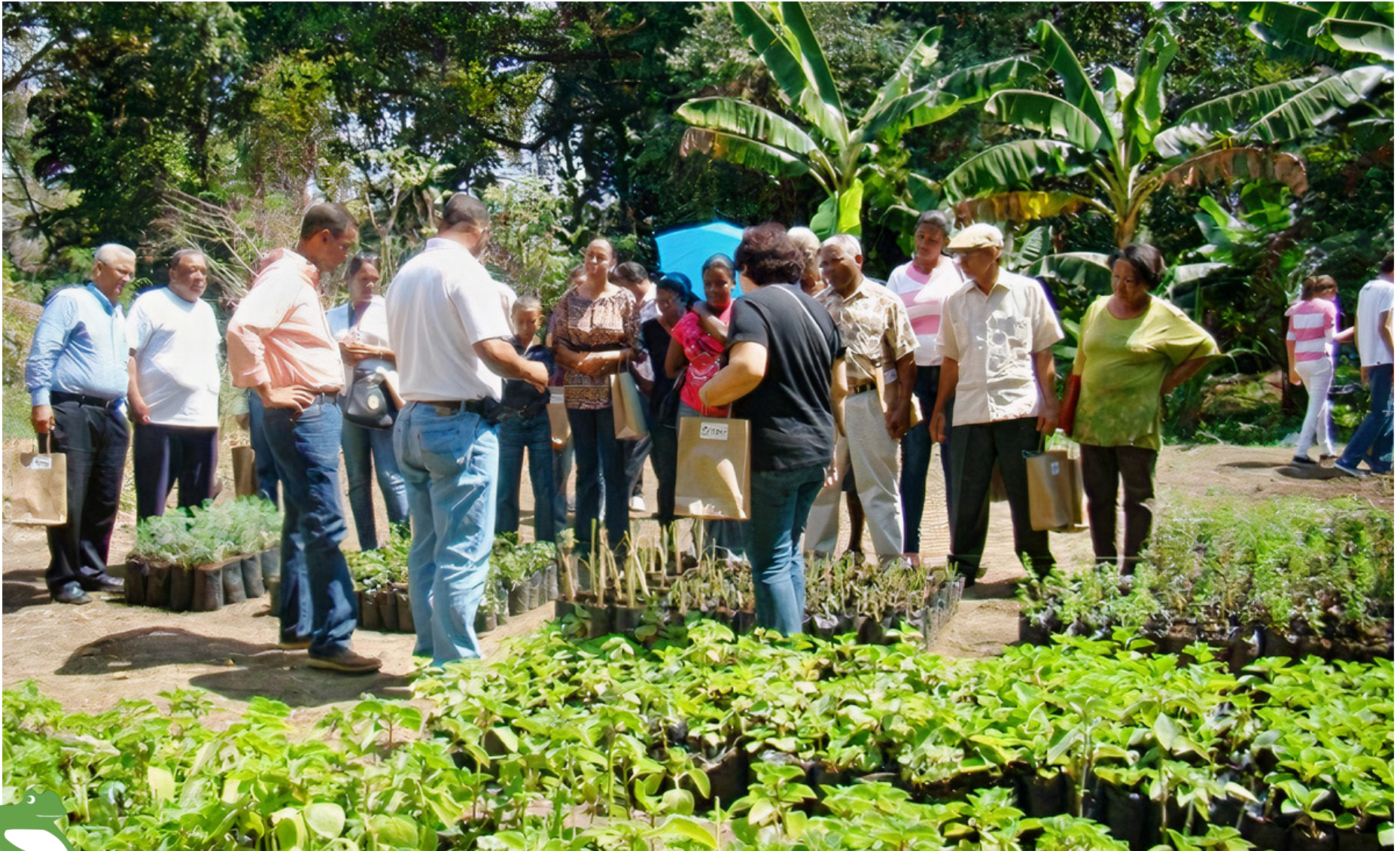
Vivero Jardín Botánico [Fuente CI-ATABEY]

Para la producción de las plantas medicinales y aromáticas contamos con un vivero en el Jardín Botánico en el marco de un convenio de colaboración firmado entre ambas instituciones.