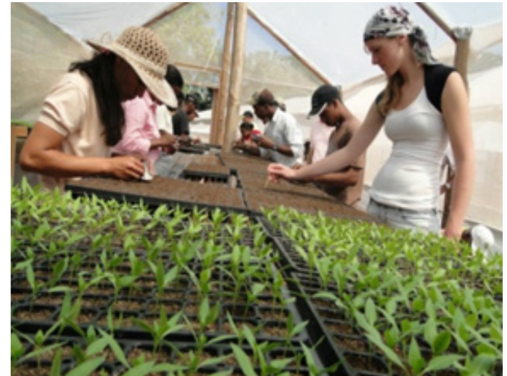
Vivero producción

Vivero agroforestal de plantas nativas & endémicas : con una producción de 700,000 plantas a la fecha. (Pino criollo, guama, manacra y café)