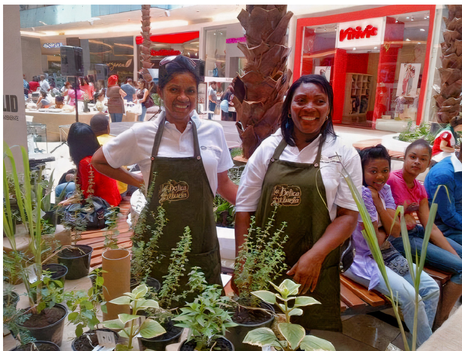
Lanzamiento-Marca Mercadito Ágora Mall.-Fuente CI-ATABEY