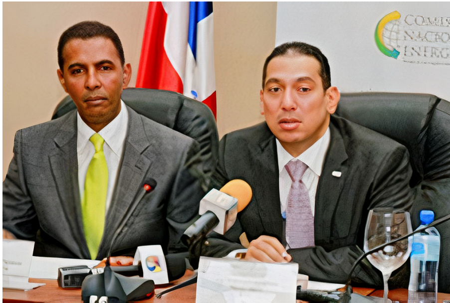
Firma del Convenio CNE-ATABEY.

Con el California Smart Grid Center ambas partes nos comprometemos a aunar esfuerzos con vista al desarrollo de programas que deberán ser elaborados en común entre ambas Instituciones, y abarcando en el ámbito general intercambio y movilidad científica de docentes e investigadores y de estudiantes.