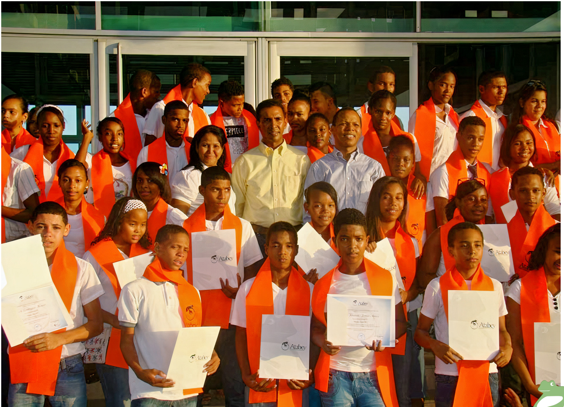
1er grupo graduando Agosto 2013-MARN.