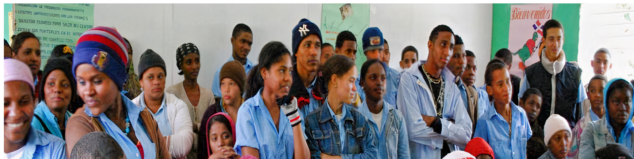
Jóvenes Rio Limpio-actividad Centro Cultural

Este año el programa de becas con los jóvenes de Rio Limpio cuenta en la Casa Pensión de Santo Domingo con 12 jóvenes cursando carreras universitarias y 10 jóvenes en la casa pensión en Mao.