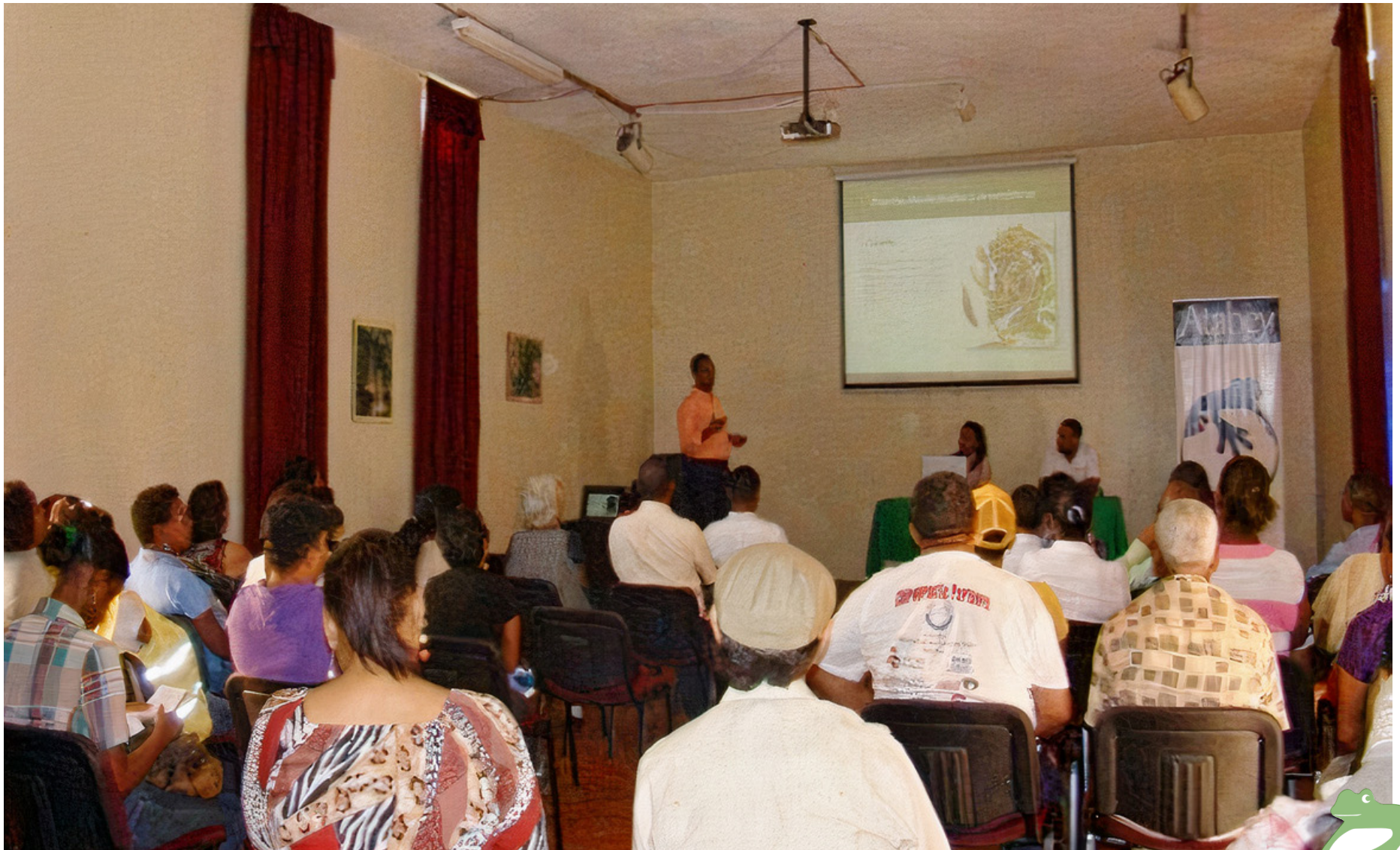
Participantes cursos-Jardín Botánico

Se impartieron mas de 20 charlas sobre “Lo que no conoce de las plantas medicinales y aromáticas” con una especialista en medicina holística con la participación de más de 300 personas.