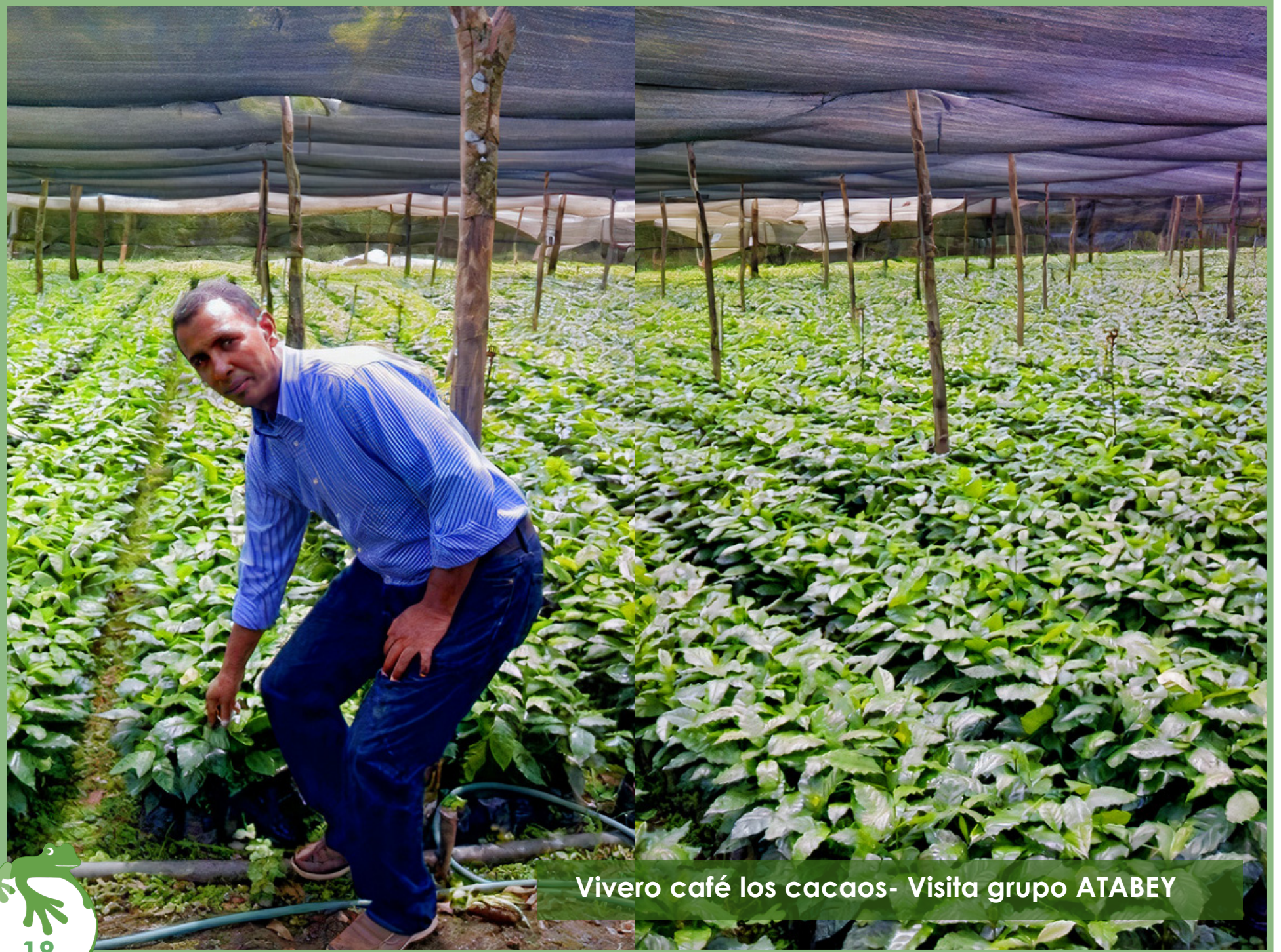
Vivero café los cacaos- Visita grupo ATABEY