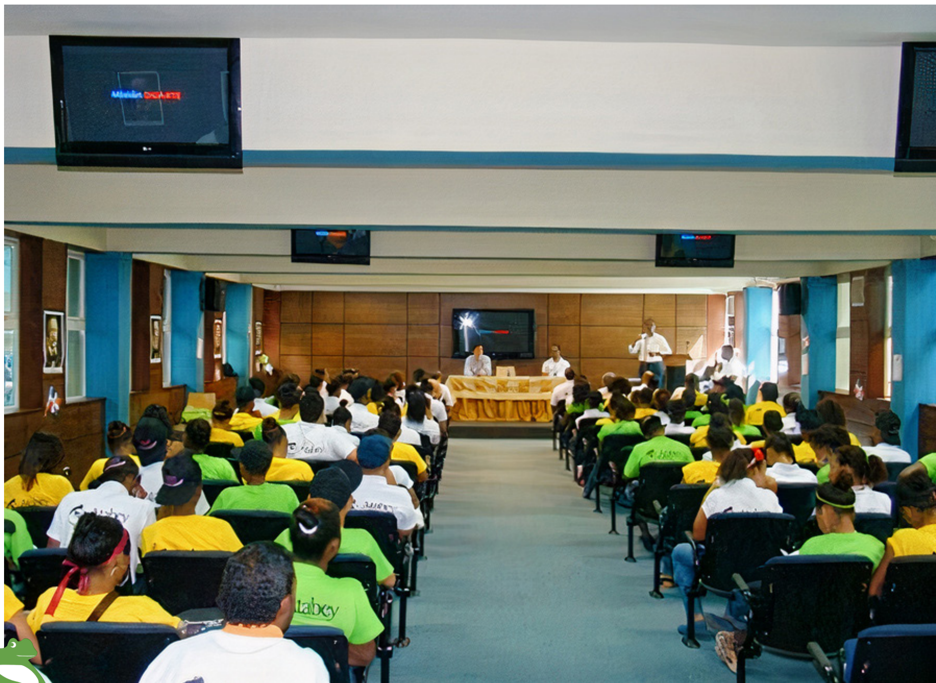
Lanzamiento del programa Marzo 2013-Club Mauricio Báez.