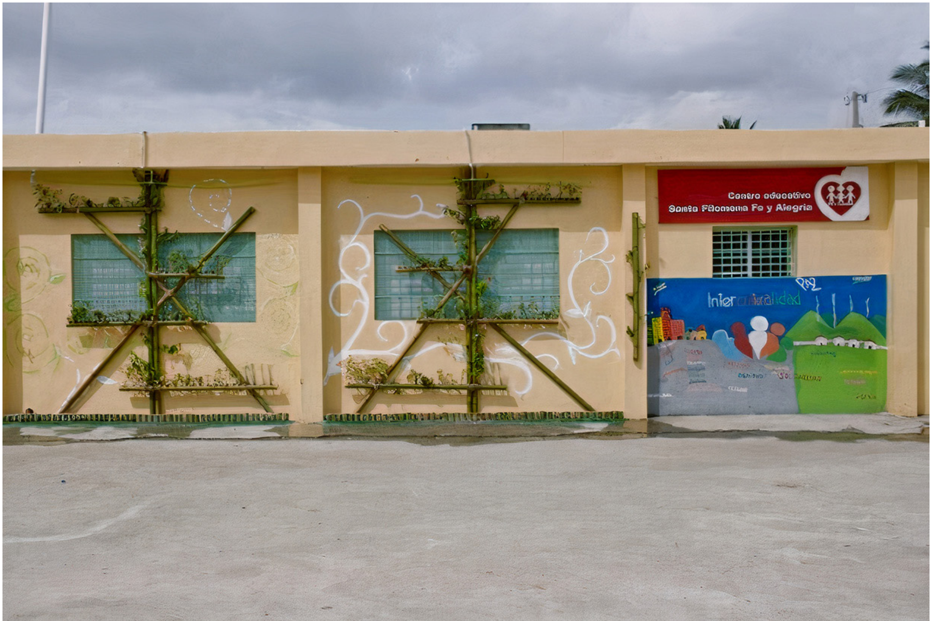
2DO. Lugar; Escuela Santa Filomema. Los Guandules-Grupo UNPHU