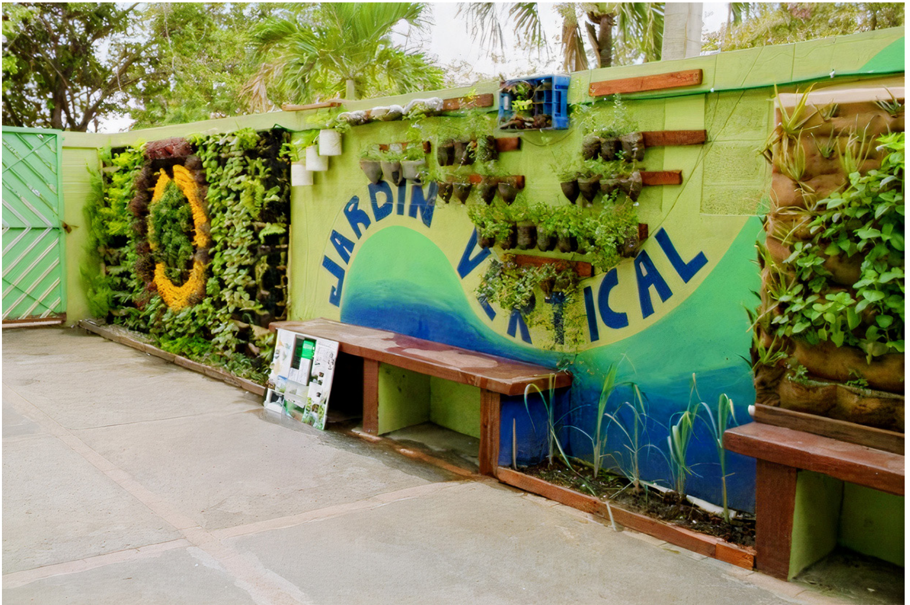
1er Lugar, Colegio Bautista Fundamental-Villa Consuelo; Grupo UASD