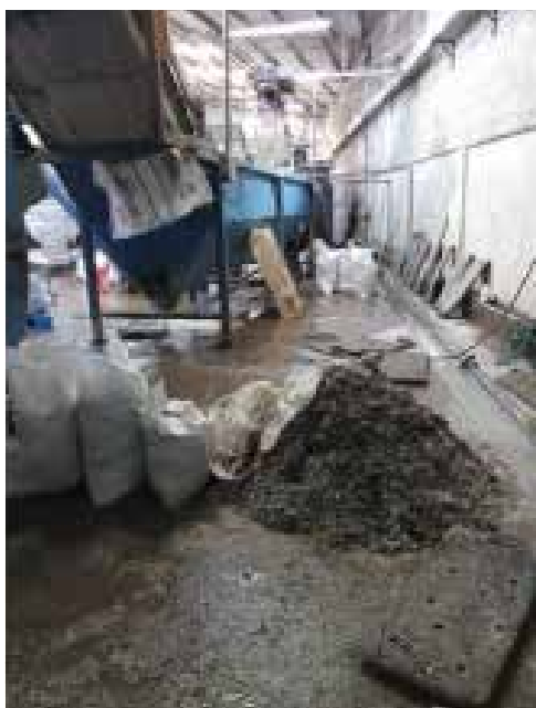
Foto 13 Visita a RECIGROUP en Honduras

COSTA RICA EL SALVADOR ESTADOS UNIDOS GUATEMALA HONDURAS NICARAGUA REPÚBLICA DOMINICANA