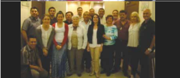
Foto 3 Participantes y facilitadores en el taller regional