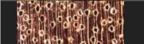
Foto 5: Imagen de una muestra de madera del xylotron. Esta imagen genera una firma única que luego se introduce en la base de datos, permitiendo que el género y, a menudo, las especies se identifiquen rápidamente