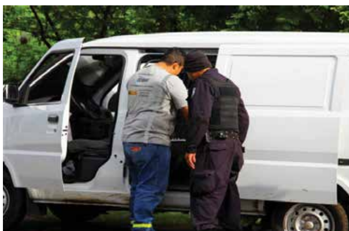
Foto 1: Operación binacional, El Salvador y Honduras (octubre de 2016)