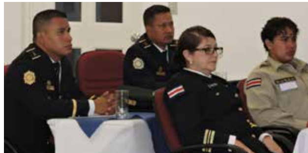
Foto 8: Taller de Aplicación de la Ley de Vida Silvestre en San Salvador, El Salvador (24-28 de octubre de 2017)