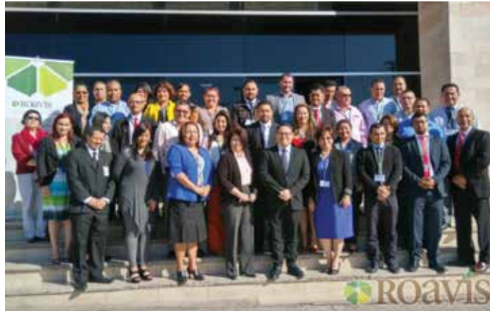
Foto 7: Taller de Jueces Nacionales en Tegucigalpa, Honduras (enero 2017)