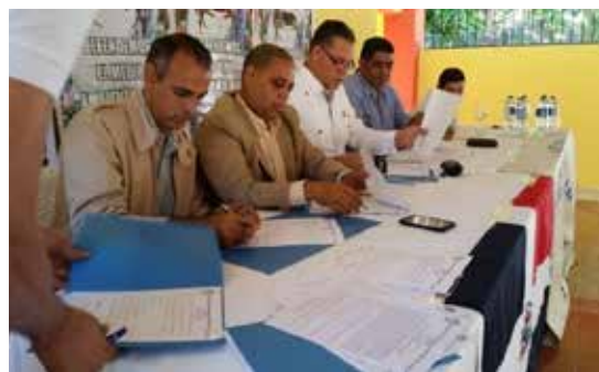
Suscripción de acuerdos con las instituciones de la comunidad y las juntas distritales.