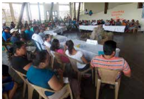
Mesa de trabajo interinstitucional de las tres pesqueras seleccionadas.