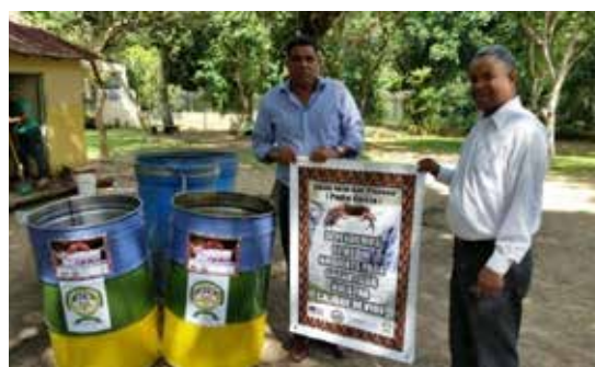
Entrega de contenedores de reciclaje en un centro educativo.

El proyecto FUNDEMAS en El Salvador tuvo dos componentes principales: (1) capacitación y sensibilización sobre la protección del medio ambiente, y (2) estrategias de comunicación y divulgación para ampliar el impacto del mensaje clave del proyecto sobre la protección del medio ambiente. Específicamente, este proyecto buscó aumentar la sensibilización de la sociedad civil sobre cuestiones de gestión de recursos naturales y normas y procedimientos ambientales para poder promover la toma de decisiones informada y participativa en asuntos de protección medioambiental, a través de actividades educativas y de capacitación en el municipio de San