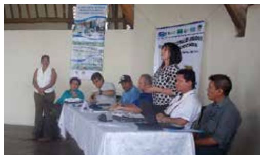
Representantes en la mesa: DIPESCA, CONAP, Municipio de Livingston, Red de pescadores y consultores del proyecto.