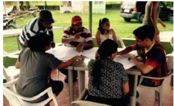
Capacitación para sembrar huertas en las comunidades del proyecto.