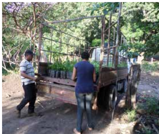
Día de trabajo para repoblar la concha negra en concesiones de manglares.