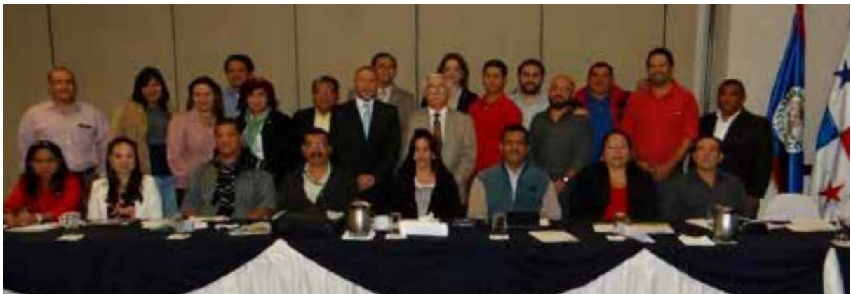
Taller regional de expertos para consenso en torno a los procedimientos de elaboración de los DENP para tiburones y mantarrayas clasificados en el Apéndice II de la CITES en los países miembros del SICA. El taller se impartió en Ciudad de Guatemala en enero de 2015.

Las reuniones regionales de funcionarios de la CITES y otros grupos pertinentes proporcionaron un foro eficaz en el cual compartir mejores prácticas, hablar de las prioridades nacionales y regionales, identificar brechas en las capacidades y problemas que necesitan atención, proporcionar oportunidades para los funcionarios de los gobiernos de la región para que trabajen de manera conjunta y que, como resultado de ello, se fortalezca la cooperación en torno a la CITES entre los gobiernos. Este tipo de reuniones proporciona también un foro para que los países miembros presenten propuestas de importancia regional y ofrezcan la oportunidad de planificar operaciones regionales conjuntas.