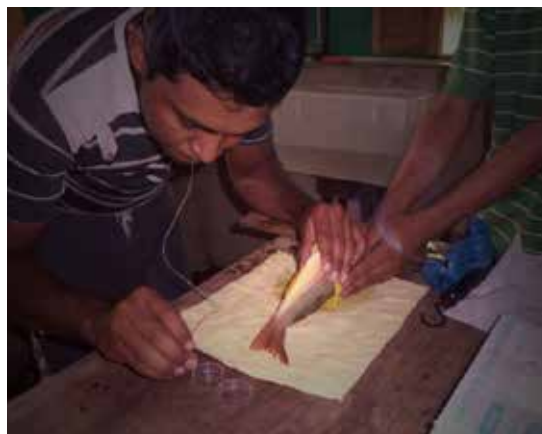
Inducción hormonal del pargo lunar.