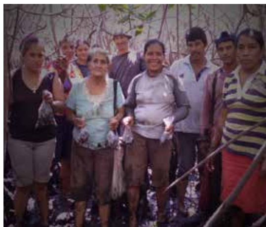
Jornada de trabajo para repoblar con concha negra las concesiones de manglar.