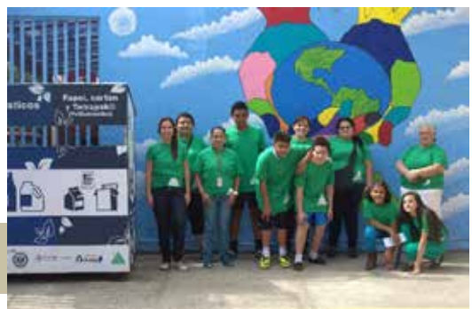
Proyecto comunitario en el distrito de San Sebastián: líderes ambientalistas, ecopuntos y mural.