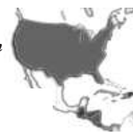
CUADRO 1. (cont'd) CONSIDERACIONES CONCEPTUALES PARA LA ELABORACIÓN DE UN MAPA DE ACTORES CLAVE