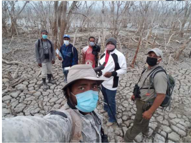
Monitoreo de humedales clave y amenazas en la región Enriquillo.