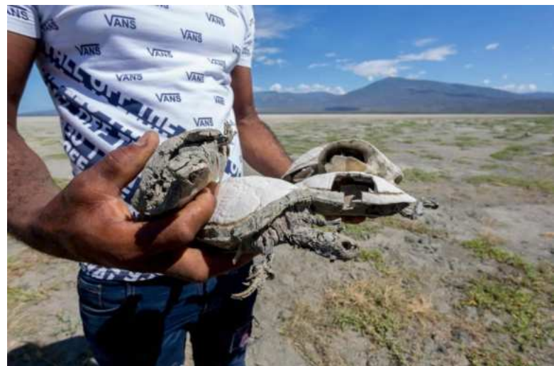
Foto-documentación de impactos de la sequía extrema en la Laguna Cabral.