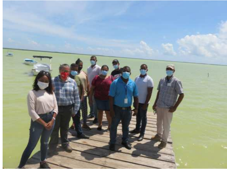
Taller comunitario sobre medios de vida sostenibles y ecoturismo de manglares en la Laguna de Oviedo (Pedernales).