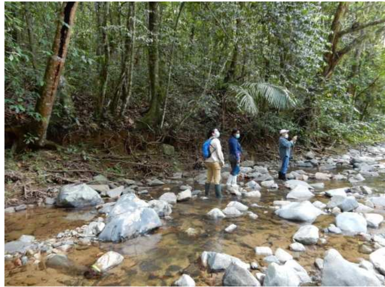
Establecimiento de sendero de aviturismo en la Reserva Privada Zorzal (Duarte) junto a Consorcio Ambiental Dominicano.