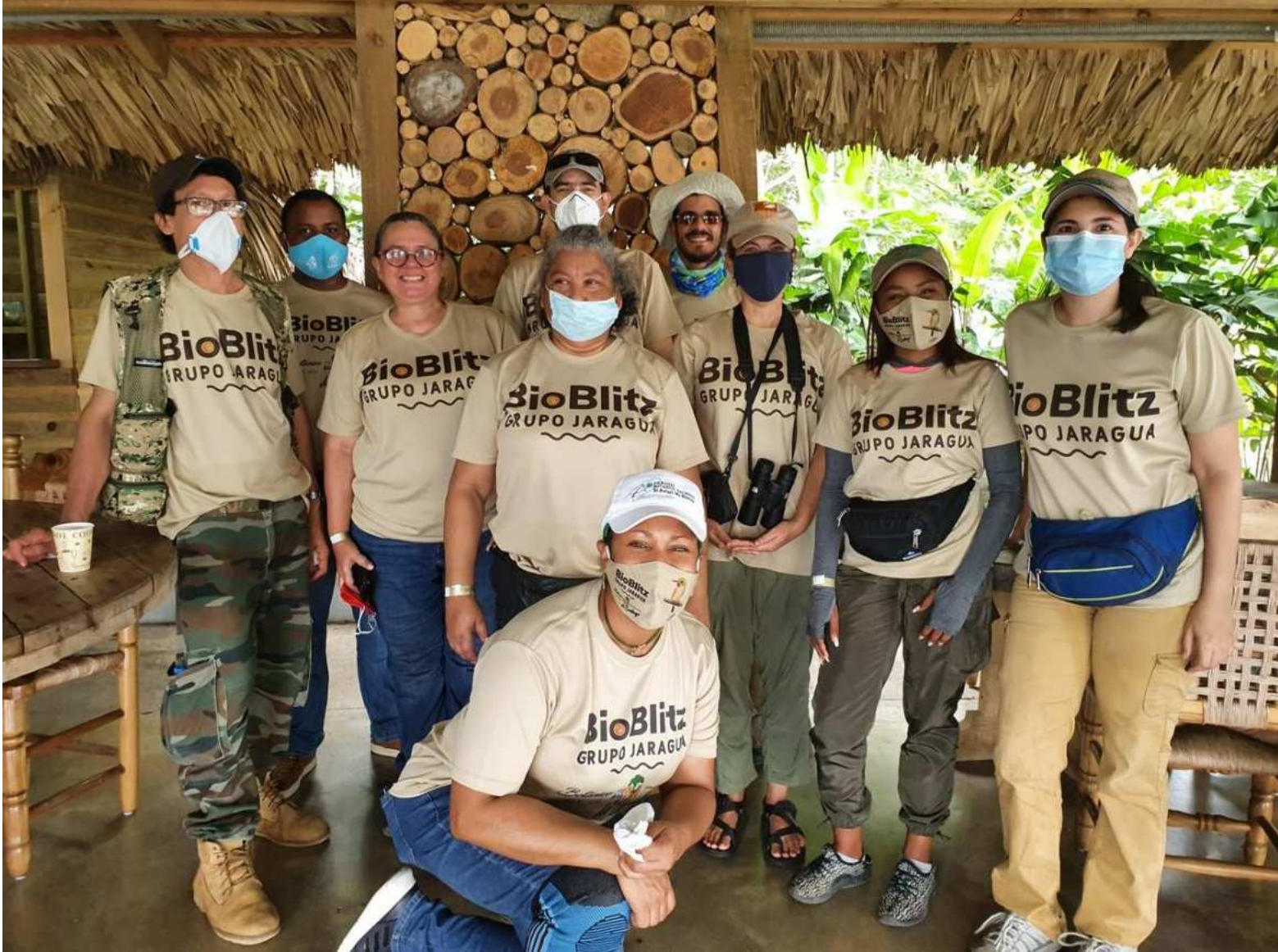
Actividad de ciencia ciudadana "BioBlitz" con medidas de bioseguridad realizada para el público general en el Jardín Botánico de Santiago Profesor Eugenio de Jesús Marcano Fondeur, Santiago (14 de noviembre).