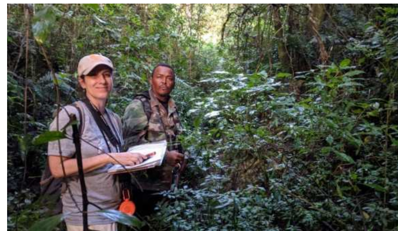
Monitoreo del zorzal de Bicknell ( Catharus bicknelli ) en la Sierra de Bahoruco.