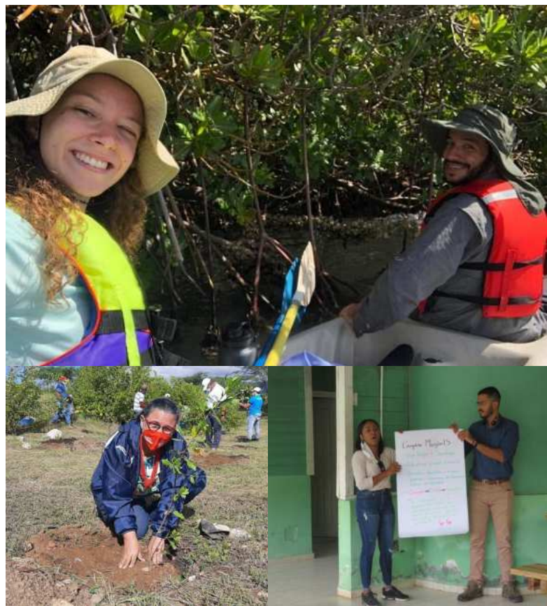
Primeras actividades de la campaña educativa nacional “MANGLARES.”

gráfica y diseñamos un plan de comunicación con el equipo de Cúa Conservation Agency con la finalidad de fortalecer el uso de nuestras redes sociales y la página web. También, comisionamos la elaboración de nuevos artes, y la toma de materiales audiovisuales sobre los manglares y su biodiversidad asociada. A pesar del cierre parcial del año escolar, las restricciones de agrupamiento en sitios públicos, y la transición a las clases virtuales debido a la pandemia del COVID-19, logramos realizar acciones divulgativas en 6 provincias a nivel nacional.