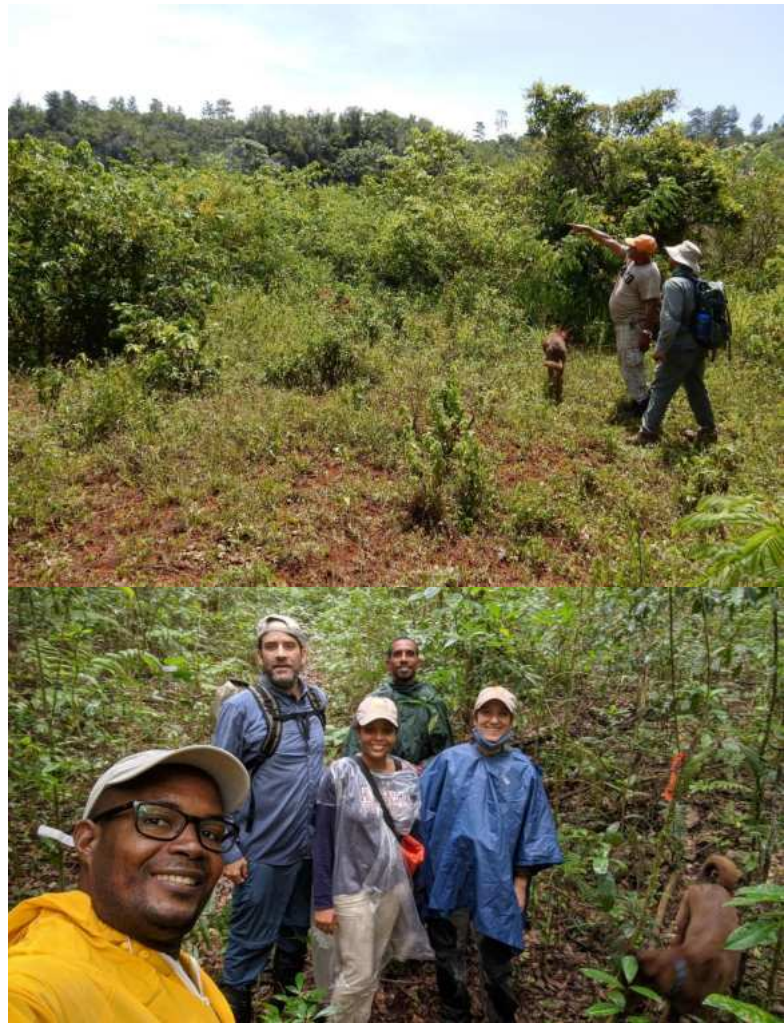
Levantamientos de biodiversidad en terrenos adquiridos en el Parque Nacional Sierra de Bahoruco.

Entre los hitos del programa de conservación del bosque montano, iniciamos el proceso de planificación para la restauración de nuevos terrenos adquiridos en la zona sur del Parque Nacional Sierra de Bahoruco. En la zona de amortiguamiento del Foret-des-Pins (Haití) se realizó una jornada de reforestación con pino criollo ( Pinus occidentalis ) de 20 hectáreas degradadas.