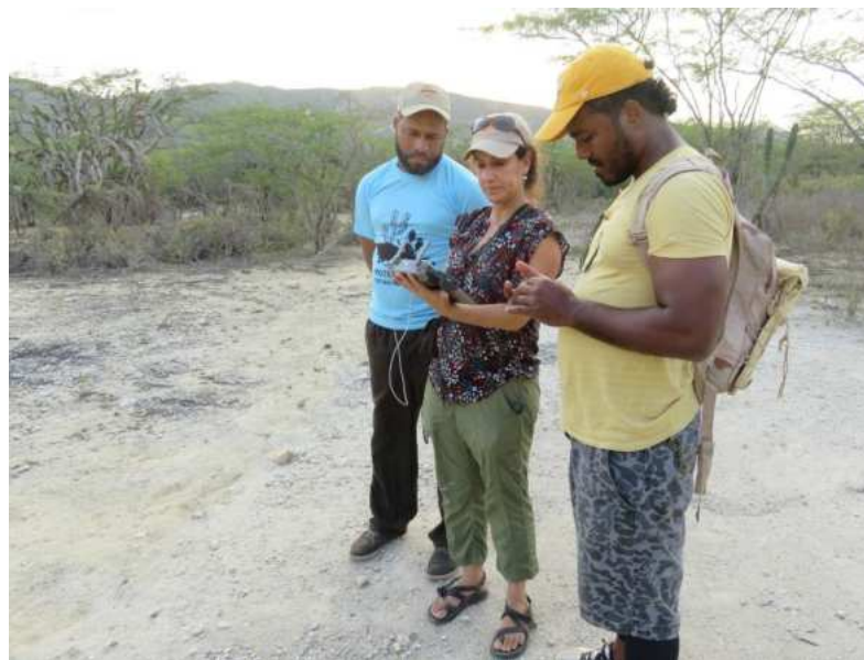
Patrullaje comunitario con uso de drones en la zona sur del Lago Enriquillo.