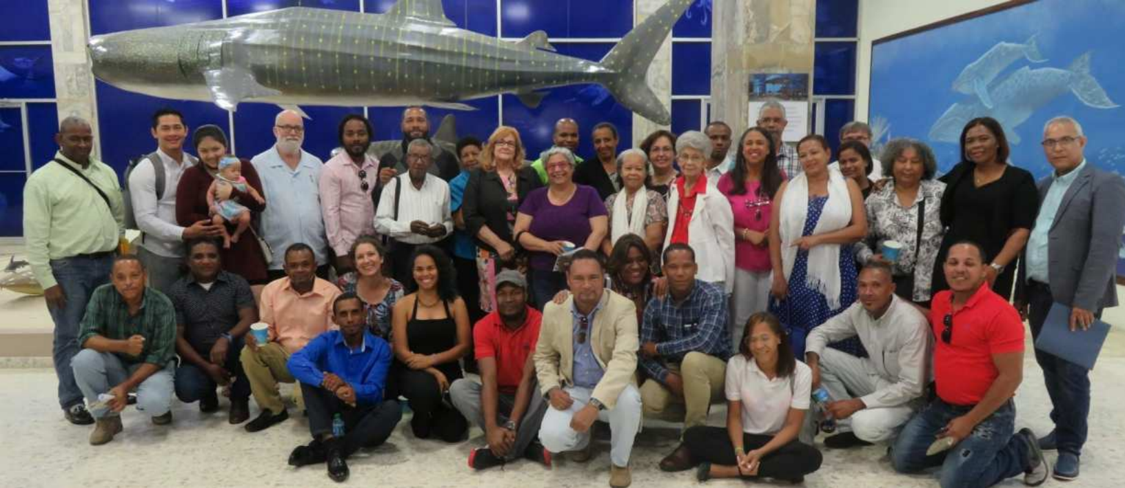
Asamblea anual 2018.