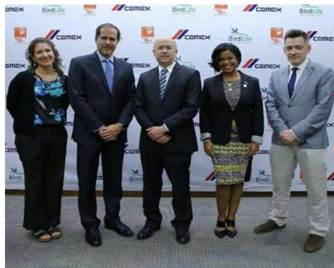
Evento de socialización y celebración de alianza CEMEX, BirdLife International y Grupo Jaragua, junto a Ministro de Medio Ambiente Francisco Domínguez Brito, Santo Domingo, febrero 2018.

Este año logramos consolidar nuestra alianza con CEMEX y BirdLife International al celebrar de manera conjunta la premiación y certificación del proyecto “Plan de Acción para la Biodiversidad de Las Salinas y Laguna Cabral” por la organización norteamericana WHC. Dentro de este proyecto, las acciones de conservación de la iguana rinoceronte recibieron un reconocimiento en la categoría de evaluación de proyectos de “Anfibios y Reptiles.”