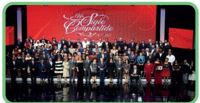
Entrega de premio de un millón de pesos al Grupo Jaragua durante el evento Un Siglo Compartido de la Fundación Corripio en Santo Domingo

Fortalecimos nuestra estrategia de comunicación y rediseñamos nuestra página web. También, diseñamos un boletín trimestral y uno infantil, para mantener informado al público sobre nuestros logros y mensajes de conservación, de una manera sencilla y transparente.