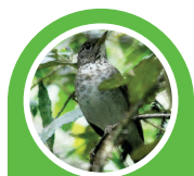
Zorzal de Bicknell