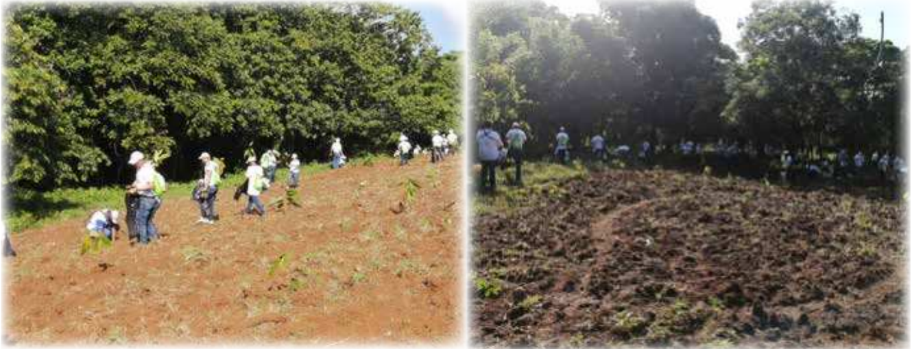
Jornada de siembra entre Grupo SID, CEDAF, TNC y FASD