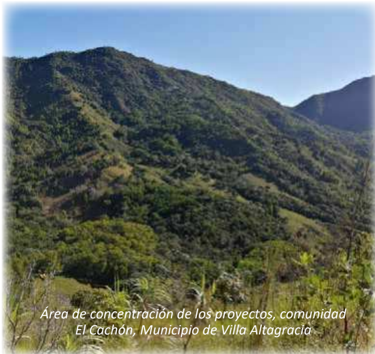
Área de concentración de los proyectos, comunidad El Cachón, Municipio de Villa Altagracia

Para esta etapa del proyecto contamos con el apoyo de APAVA la Asociación de Productores de Villa Altagracia, quienes nos ayudaron en la identificación y selección de las parcelas que hemos trabajando con los sistemas agroforestales; la sequía por la que atravesó el país al inicio del año retrasó el proceso de siembra dentro de los terrenos identificados, pero luego se reinició y al día de hoy se ha trabajado en unas 8 parcelas ubicados dentro de las comunidades de El Cachón perteneciente al Municipio de Villa Altagracia y la comunidad De La Cuaba perteneciente al Municipio de Pedro Brand, estas áreas cuentan con una extensión de 386.291 Tareas (24.29 Ha) ubicada en la margen derecha del río Isabela.