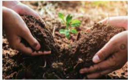
Celebración del día mundial del suelo

Promoviendo el desarrollo sostenible del sector agropecuario y forestal d