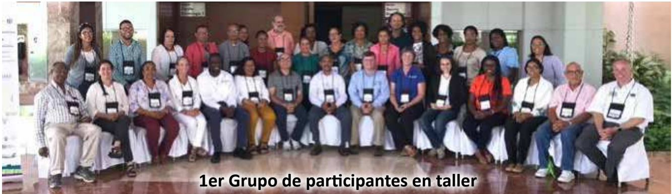
1er Grupo de participantes en taller

Debido a la cantidad de participantes interesados en el taller, este se repitió, permitiendo así, que 60 técnicos, laboratoristas e investigadores, pudieran tomar el mismo.