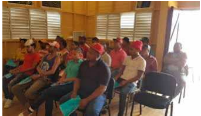
Talleres impartidos agricultores en Ozama Alto.