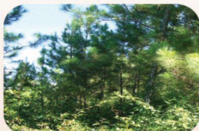
Regeneración Natural de Pino en la Finca "Tirso Contreras"