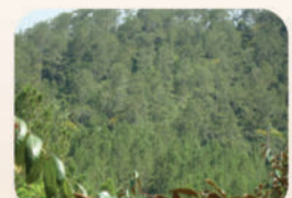
Bosque Natural en la Finca "Tirso Contreras"