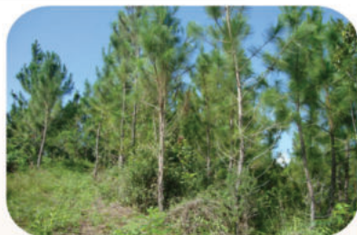
Plantación Intervenido de la Finca "Tirso Contreras"

El manejo forestal ofrece estabilidad en los suelos, diversidad en la flora y la fauna, manteniendo los regímenes hídricos en las cañadas; en resumen, una gama de bienes y servicios ambientales de alto valor.