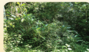
Área de Protección en la Finca "Tirso Contreras"

La finca también cuenta con 2.8 hectáreas (6.4 % del área total de la finca) de bosques de protección, principalmente cañadas. El área de pasto ha disminuido de 10 hectáreas en el año 2003 a 4 hectáreas en el año 2011. Los recursos forestales de la finca están compuestos por bosques naturales de diferentes edades desde regeneración natural de reciente establecimiento hasta árboles maduros, también hay plantaciones forestales en diferentes fases de desarrollo.