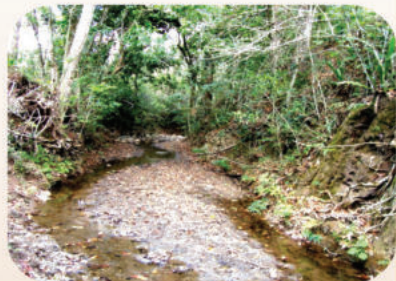
Área de Protección de Cañadas en la Finca "Almonte"

Por otro lado la superficie de protección para la cañadas es una garantía de mantenimiento de los drenajes naturales y de proveer alimento y protección a la fauna terrestre y acuática que utiliza estos nichos ecológicos para sus migraciones en forma de corredores biológicos.