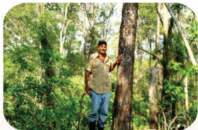
Bosque Natural en la Finca "Almonte"

La finca de don Hermes contribuye por su tamaño de manera significativa a la protección del suelo y la cuenca alta del río Artibonito. Se observa que en estos suelos arcillo-arenosos de relieve alomado, los surcos, originados por el movimiento del ganado vacuno, ya están cubiertos por materia orgánica y vegetación arbustiva, los que minimizan la erosión.