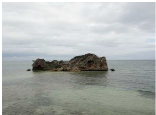
Foto 36. Rocas del Peñón Buen Hombre No. 1.