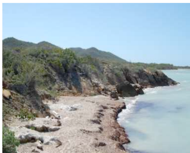
Foto 17. Estación No. 4 Costa acantilada, con entrante al mar y área rocosa adyacente cubierta de Thalassia seca. .