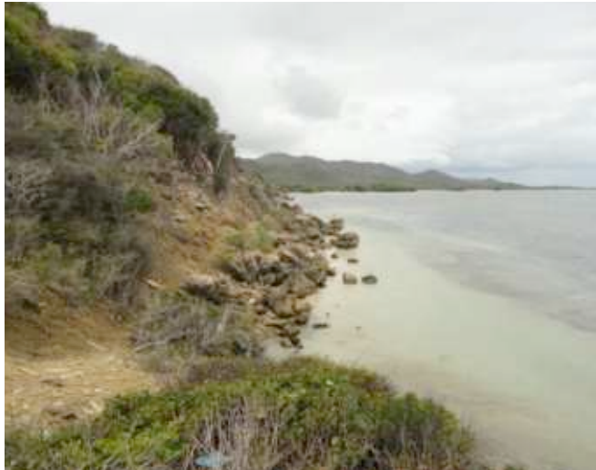
Foto 33. Estación 1. Montículo rocoso cubierto de vegetación.

La longitud lineal de la costa es de 118.6 m.