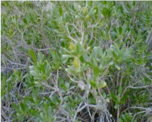
Foto 9. Te de Playa ( Borichia arborecens ) sobre rocas acantilado.