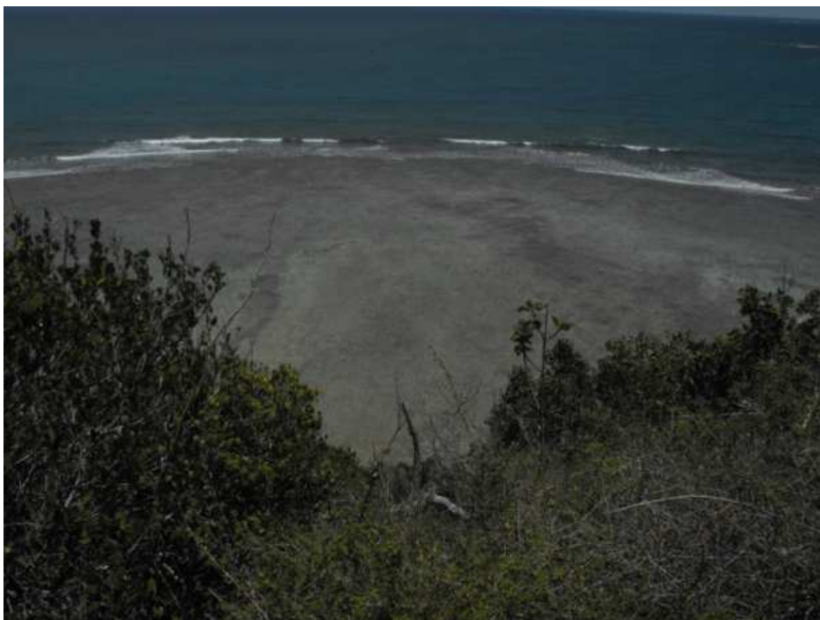
Foto 39. Costa con pendiente elevada en este tramo

La vegetación predominante es arbustiva y peinada por el viento.