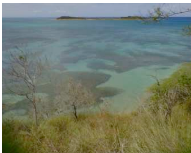
Foto 4. Vista desde el acantilado del área de praderas de fanerogamas marinas (hierbas) frente a Playa El Morro.