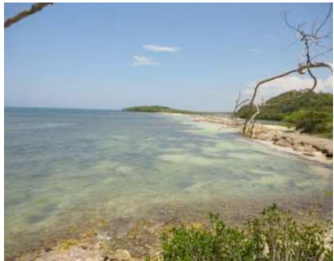
Foto 32. Punta Mangle. Límite final del litoral rocoso en este tramo.