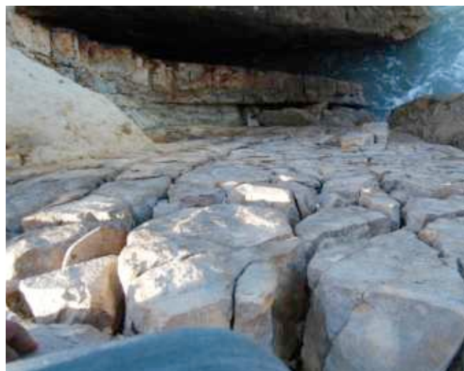
Foto 23. Vista desde arriba en el punto de la grieta en la costa rocosa. Estacion 5.