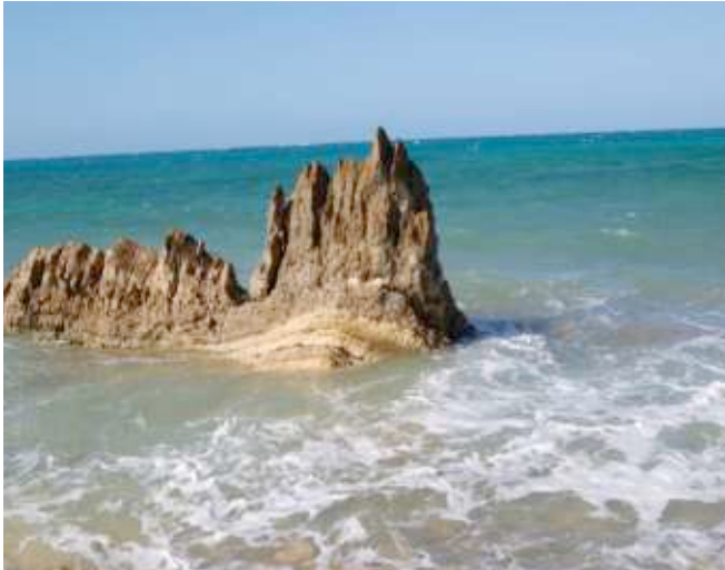
Foto 18. Islote cercano al acantilado.