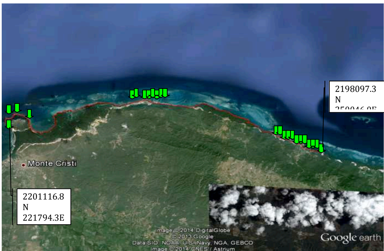
Fig.1. Ubicación de los 3 tramos seleccionados para el estudio de costa rocosa en 2012, con sus respectivas estaciones.

En la elaboración de informe y mapas, la longitud de costa rocosa se presenta en kilómetros (Km) lineales del perímetro costero y en porcentaje relativo. Se calcularon los Km lineales de franja costera rocosa y acantilada. Se georeferenciaron los puntos y las distancias de los tramos realizados. Se elaboraron las tablas y mapas correspondientes para la presentación del Informe