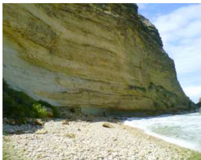
Foto 6. Estratificación arcillosa. Lado Oeste de Playita El Morro.