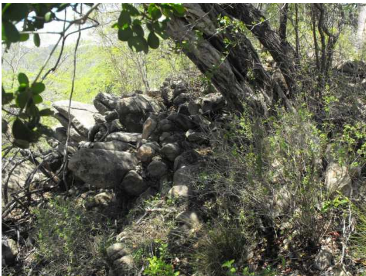
Foto 38. Formaciones rocosas y tipo de vegetación en el área.

La vegetación predominante está formada por arbustos y árboles de mediano porte entre los que se observaron: Bayahonda Prosopis juliflora ; Cambrón Acacia macrocantha ; Alpargata Consolea moliniforme ; Cactus; Guayacán Guaiacum vera ; Mangle Botón Conocarpus erectus ; Doña Sanita Lantana involucra ; Escobón Eugenia faetida y Palo Amargo Trichilia equifolia .