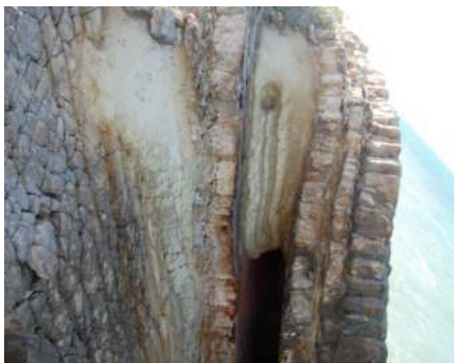
Foto 24. Parte del corte del acantilado visto desde el lado Oeste, parte superior.