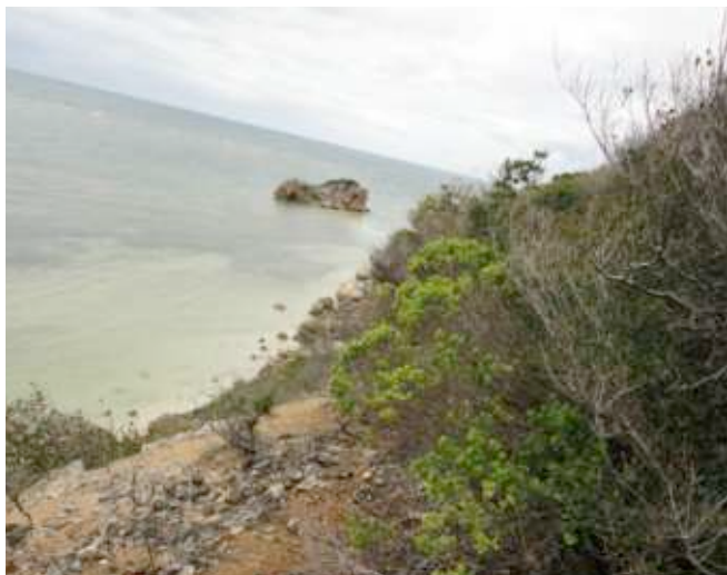
Foto 35. Estación 3. Tipo de rocas y vegetación frente al Peñón, Buen Hombre.