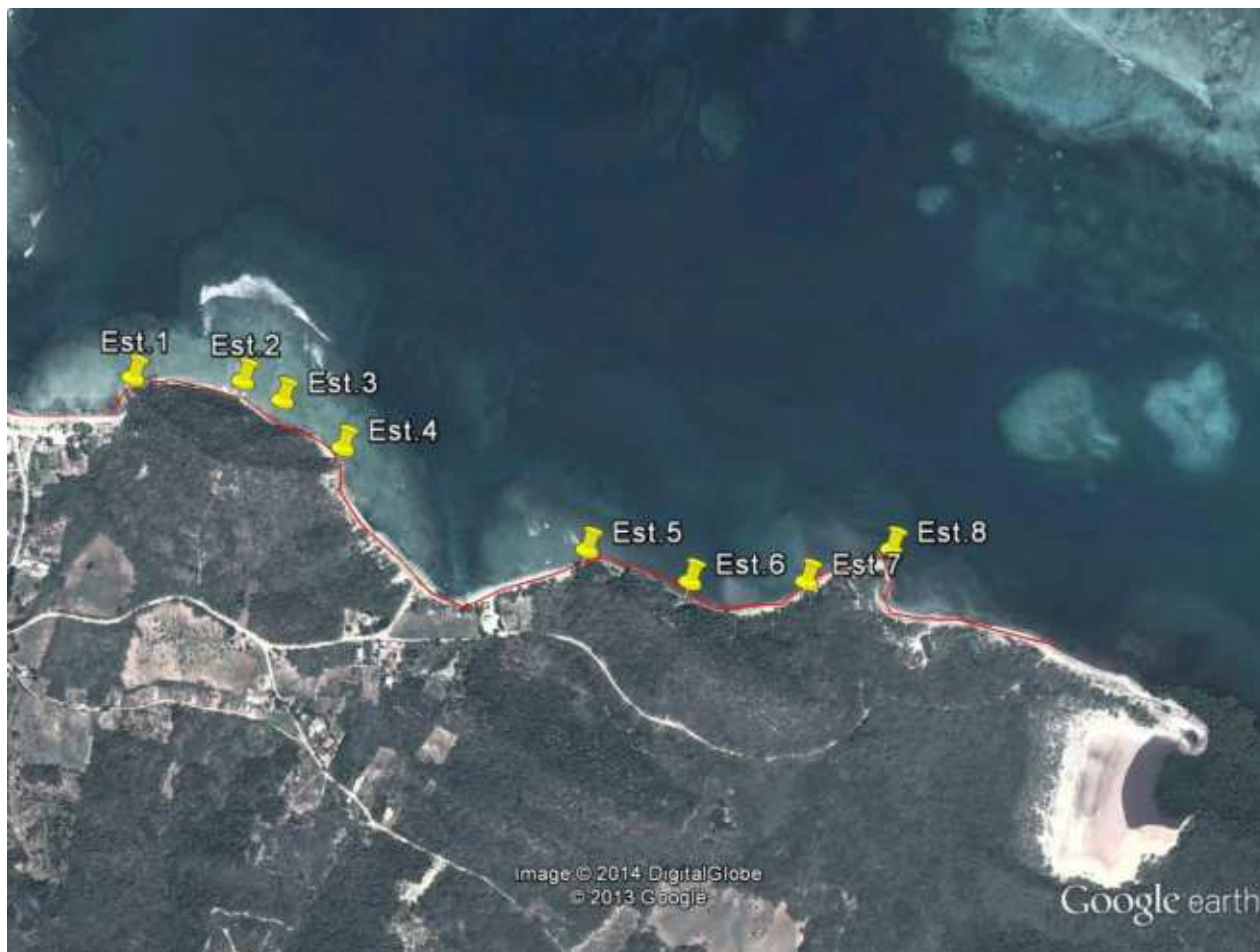
Fig. 5. Imagen de la zona de estudio Tramo 3B con ubicación de las estaciones.