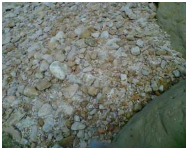
Foto 2 Cantos de piedra y arena que conforman el sustrato de la playa.