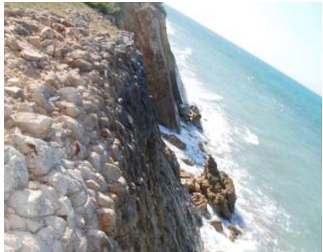
Foto 21. Close up del corte vertical del acantilado.