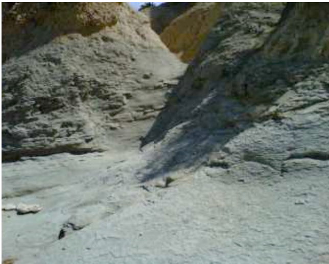
Foto 11. Montículos de arcilla roja y gris con canales de drenaje desde la cima de El Morro.