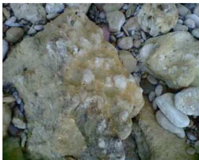
Foto 8. Conglomerados rocosos de origen biogénico calcáreo y terrígeno.