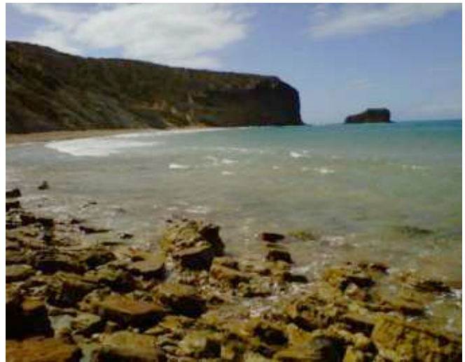
Foto 12. Pendiente de aproximadamente 90 grados reportada en varios puntos de los acantilados de la provincia.