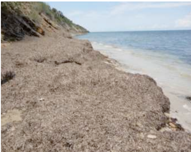
Foto 31. Estación 10. Acantilados con plataforma terrígena cubierta de Thalassia seca.