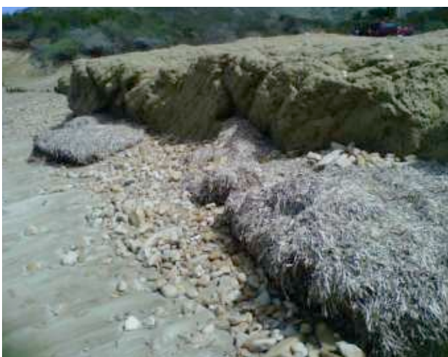
Foto 3. Arena y piedras de origen terrígeno mezcladas con Thalassia seca.