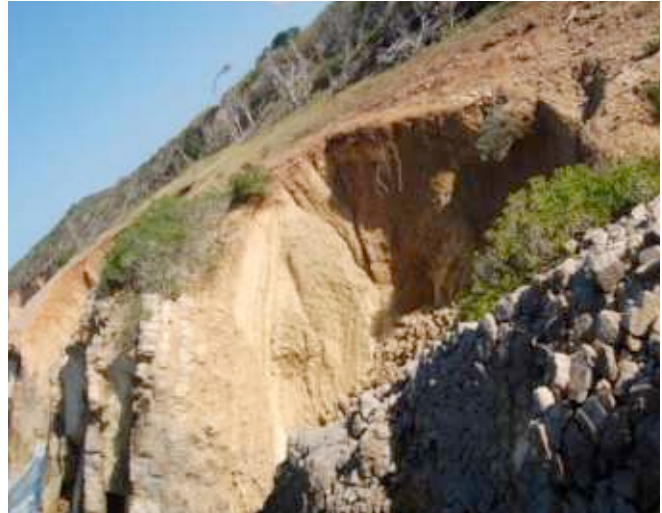
Foto 19. Corte del acantilado mostrando diferentes formaciones geológicas. .