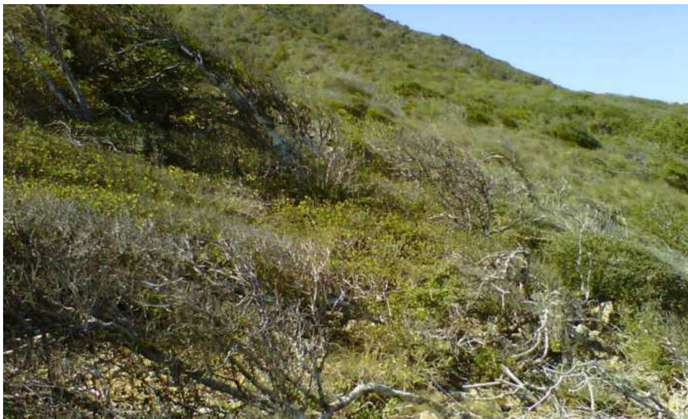
Foto 13. Vegetación xerofita típica “peinada por el viento” en toda la zona acantilada