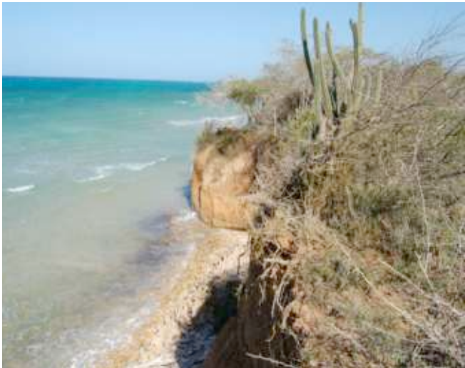
Foto 26. Vegetación xerófila, típica de todo el tramo.