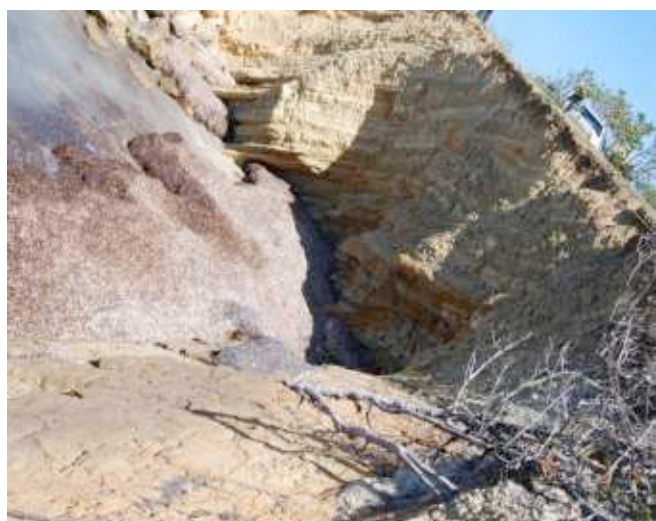
Foto 16. Estación No 3. Corte estratificado próximo a Punta Bucán. .