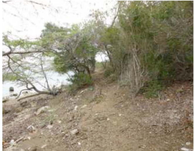
Foto 34. Estación 2. Vegetación de Cambrón, próximo a la Laguna La Poza.