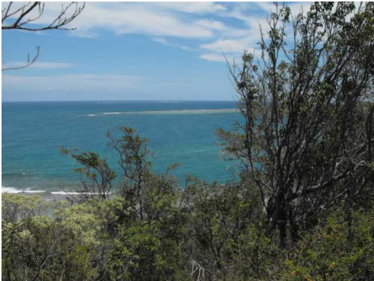
Foto 37. Vista de la vegetacion xerófila en el area evaluada.