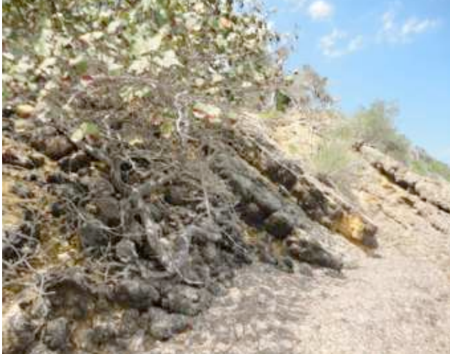
Foto 29. Estación No. 9. Especie de uva de playa sobre rocas.