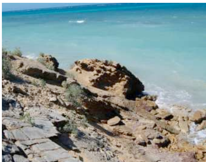
Foto 14. Formación rocosa con montículo de origen terrígeno y vegetación adherida.