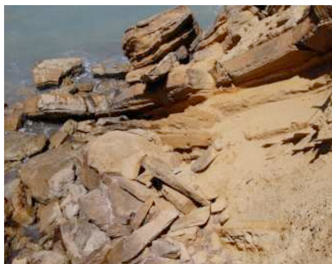
Foto 15. Estación No. 2. Acantilado con fuerte erosión por desprendimiento de placas de arcilla ferrosa compactadas.