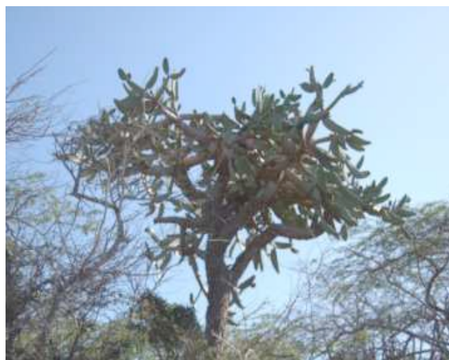
Foto 25. Estación No. 5. Vegetación de bosque seco, (saona, cayuco y cambrón) sobre el acantilado.