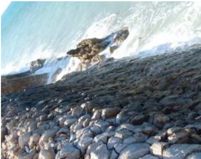
Foto 20. Estación No. 5. Vista desde el borde del acantilado en ángulo de 90 grados.