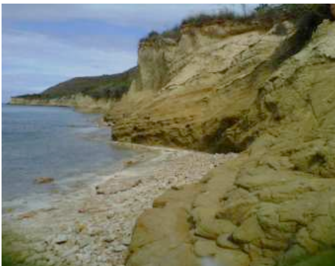
Foto 1. Extremo Este de Playa El Morro. .

En las cuatro estaciones, el mayor impacto de origen antropogénico observado, pudiera ser la introducción de ganado caprino (chivos) , lo que se dedujo por el volumen de excremento observado, y la reducción de plantas herbáceas, usadas como pastos.