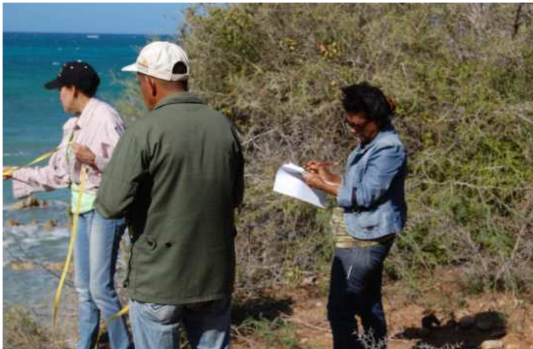
Foto 28. Equipo Tomando los datos.