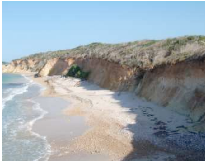
Foto 27. Estación No. 6. Formación de playa arcillosa por erosión y desprendimiento de material.