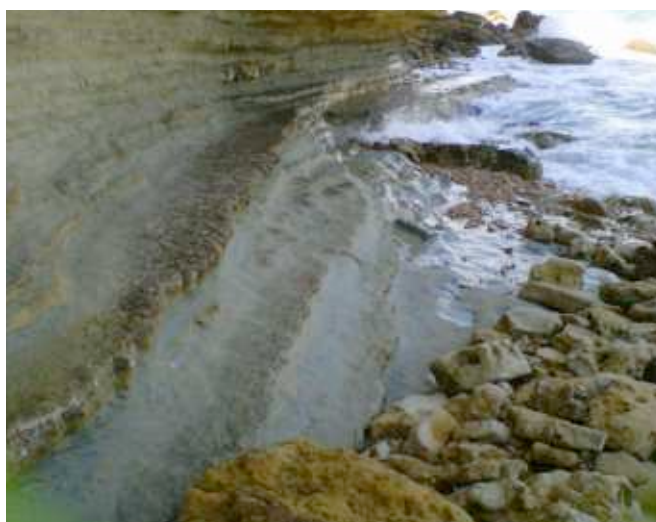
Foto 7. Capas erosionadas de la base del acantilado. Playita de El Morro.