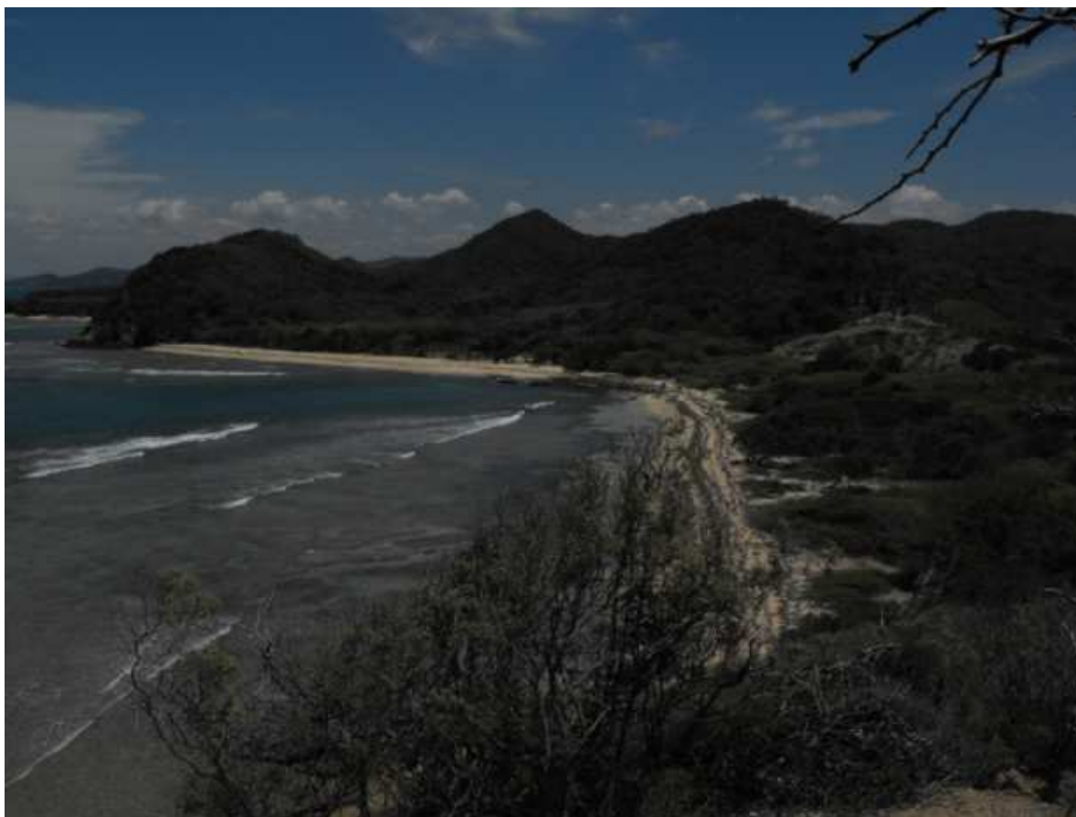
Foto 40. Características del acantilado de este tramo.

La vegetación predominante es arbustiva y peinada por el viento, formada por las especies: Guayacán Guaiacum vera ; Cambrón; Acacia macracantha ; Saladito Sesuvium Portu-lacastrum , Escobón Eugenia faetida ; Doña Sanita Lantana involucra ; Laurel Picus mecropola ; Guaconejo Amiris bolsamifera . Dentro de la vegetación sobre las rocas se destaca la Uva de Playa Coloba uvifera .