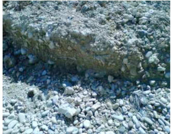
Foto 10. Conglomerado de cantos rocosos, arena y arcilla de origen terrígeno.