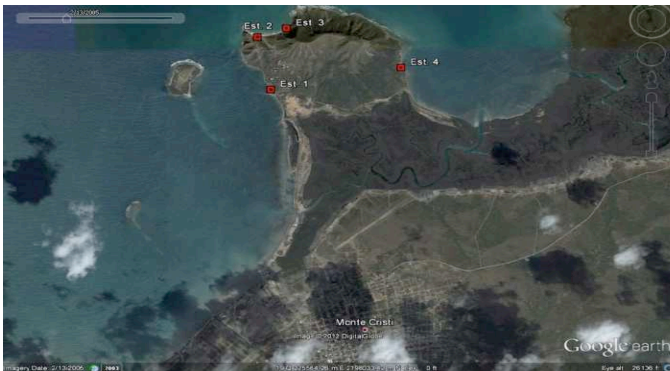
Fig. 2 Imagen zona de estudio Tramo 1, con ubicación de las estaciones

Longitud total aproximadamente es de 5.6 km.