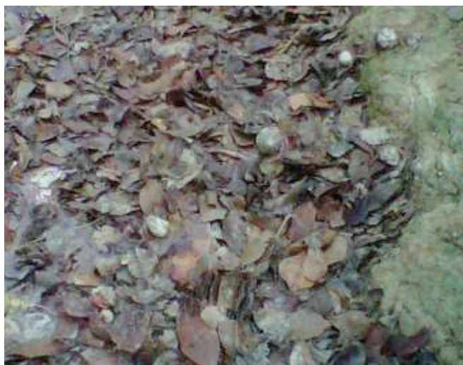
Foto. 5. Numerosos Bulgaos ( Cittarium pica ), sobre litera en la cima de El Morro. .