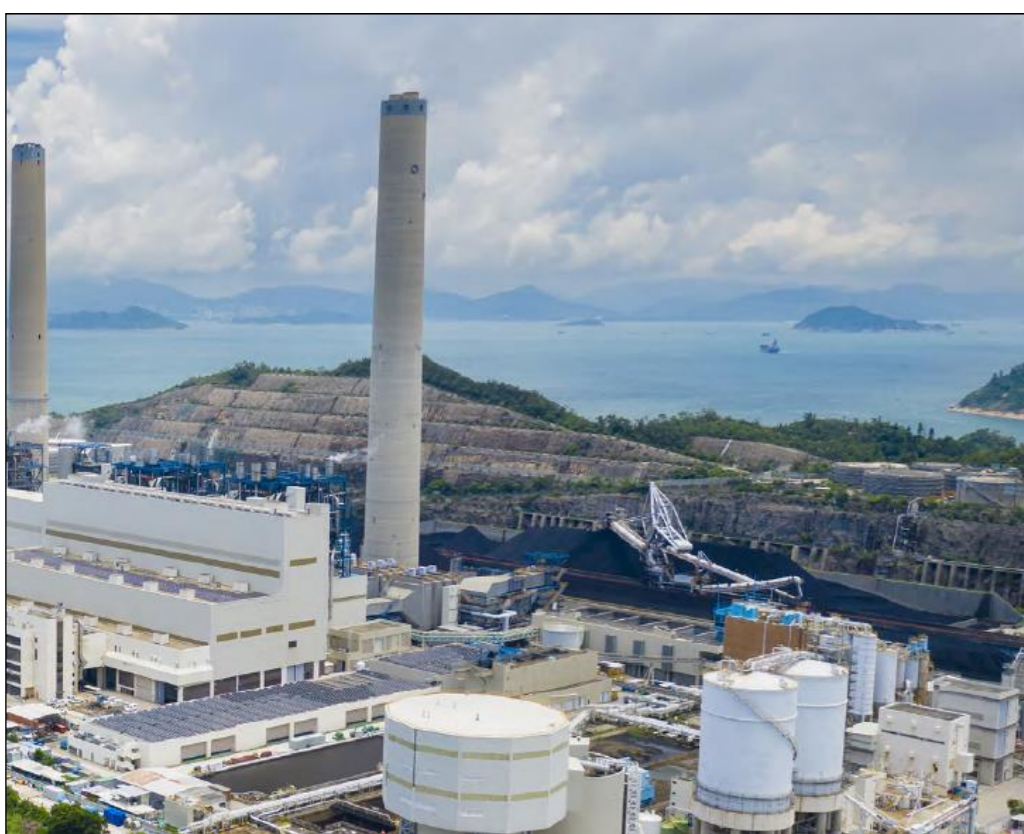
Central de generación termoeléctrica a carbón mineral.

Analizar el comportamiento de las emisiones GEI en el subsector generación de electricidad para la serie temporal 2010-2021.