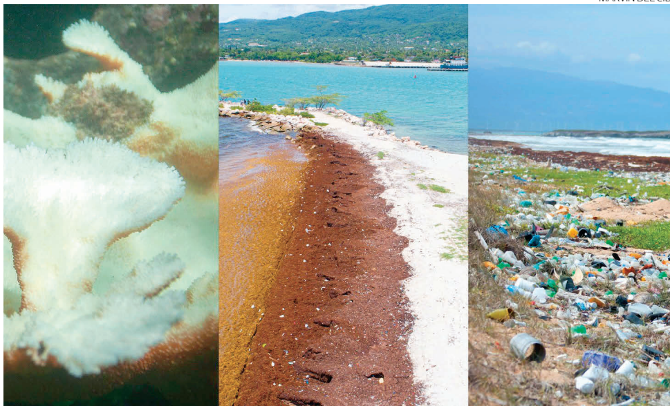
Blanqueamiento de corales, sargazo y plástico, temas a tratar en la cumbre por el clima.