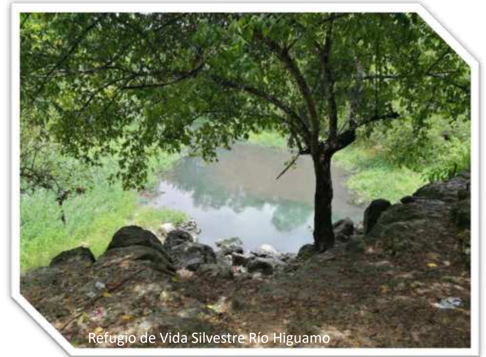
Refugio de Vida Silvestre Río Higuamo