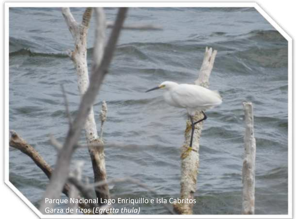
Parque Nacional Lago Enriquillo e Isla Cabritos Garza de rizo ( Egretta thula )