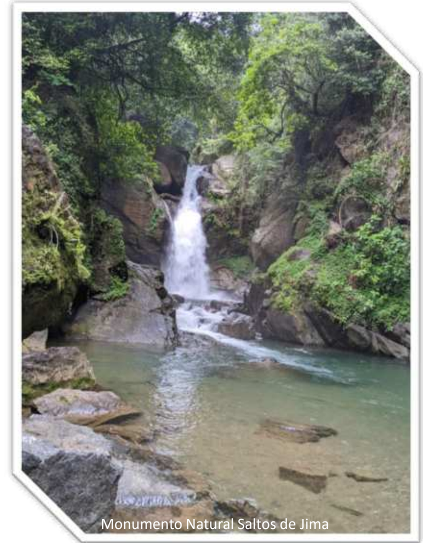
Monumento Natural Saltos de Jima