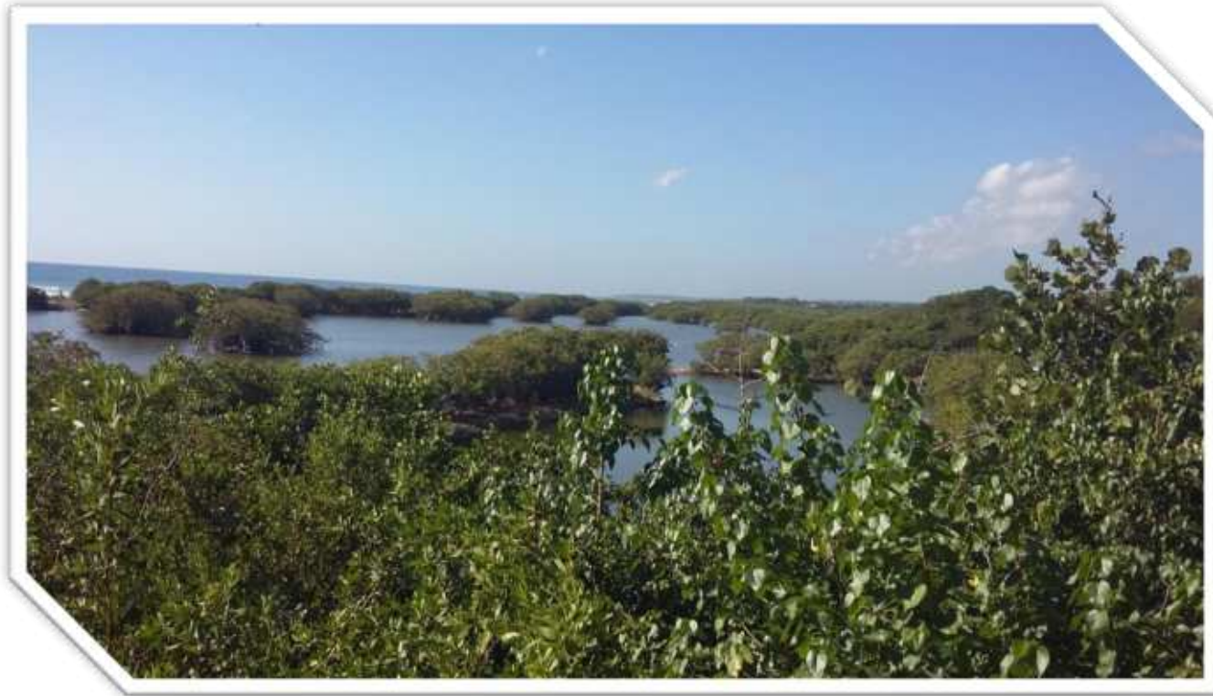
Parque Ecológico Humedales de Nigua

Los humedales son ecosistemas biodiversos y esenciales