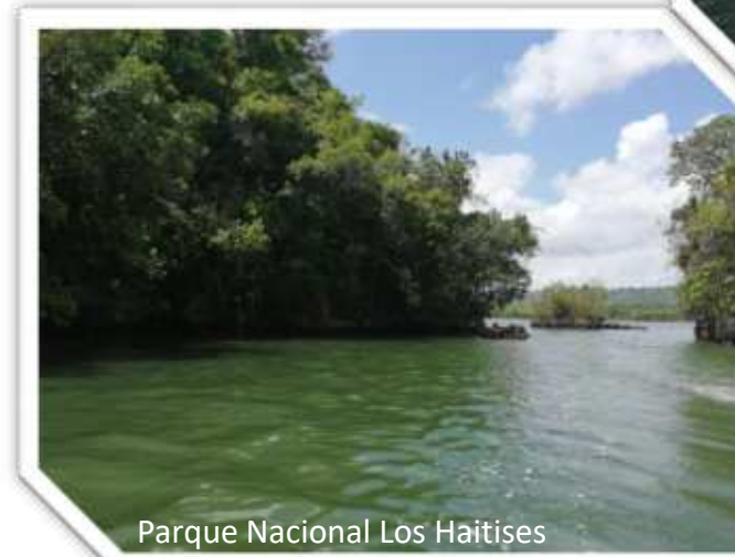
Parque Nacional Los Haitises