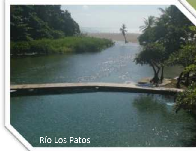
Río Los Patos