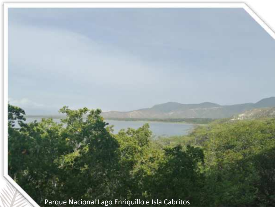
Parque Nacional Lago Enriquillo e Isla Cabritos