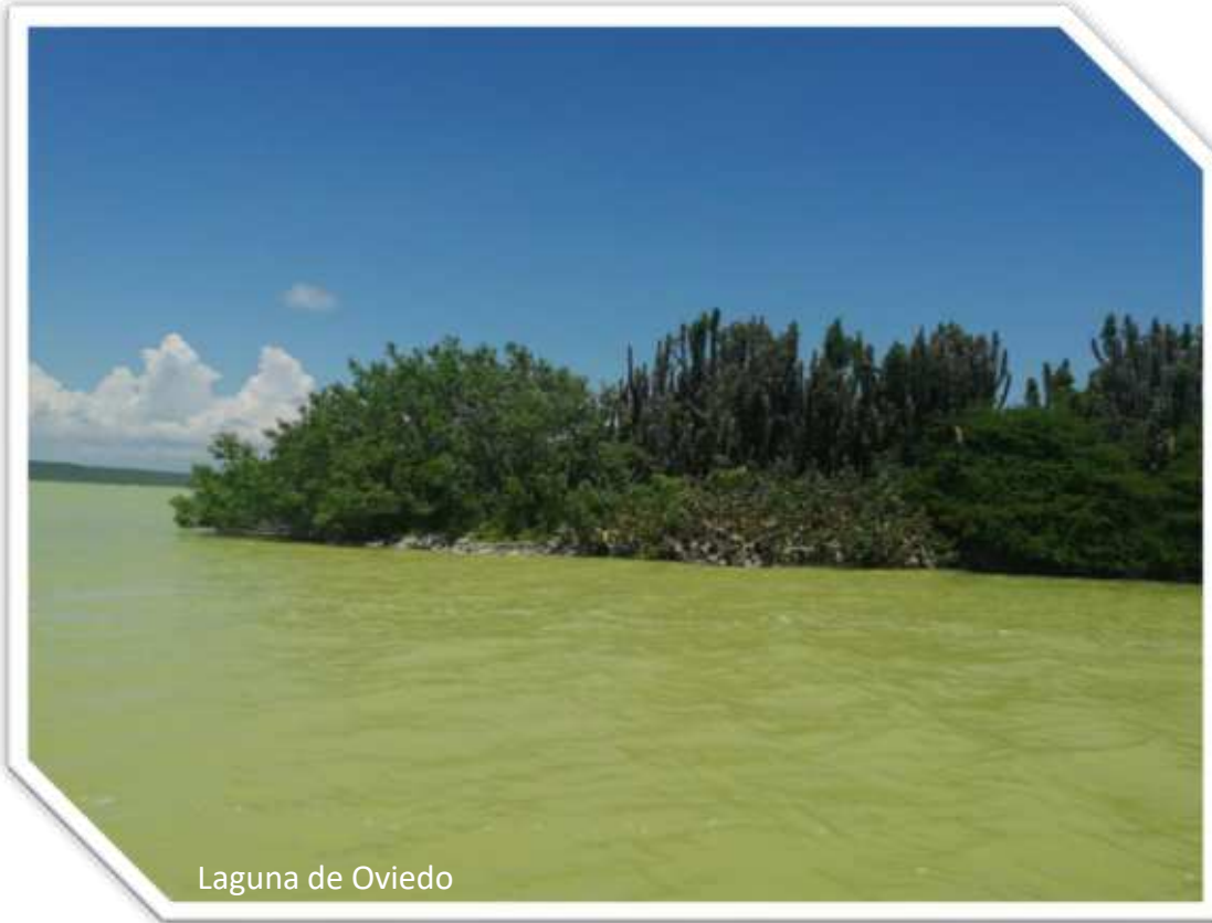
Laguna de Oviedo