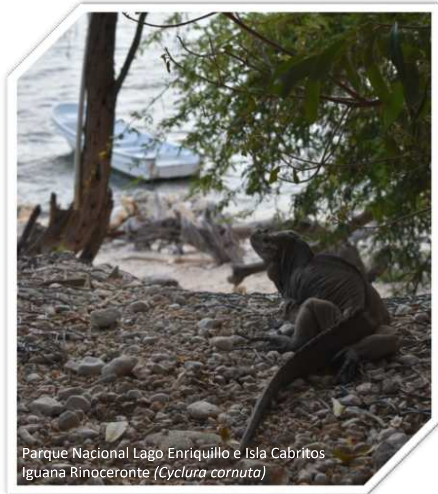
Parque Nacional Lago Enriquillo e Isla Cabritos Iguana Rinoceronte ( Cyclura cornuta )

La biodiversidad que habita en los humedales favorece el bienestar humano