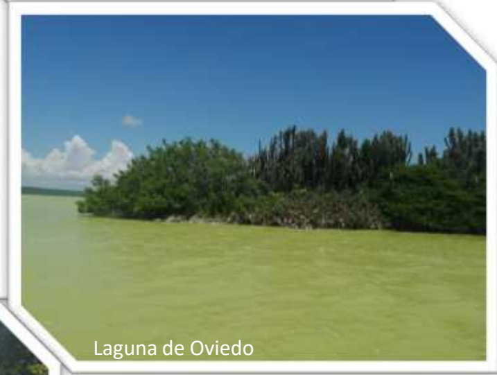
Laguna de Oviedo