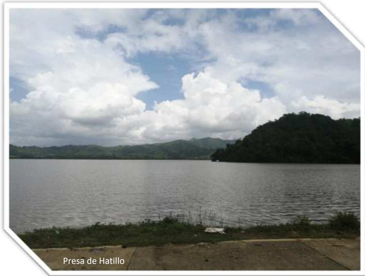
Presa de Hatillo