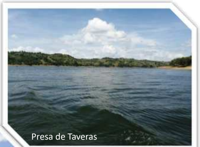
Presa de Taveras