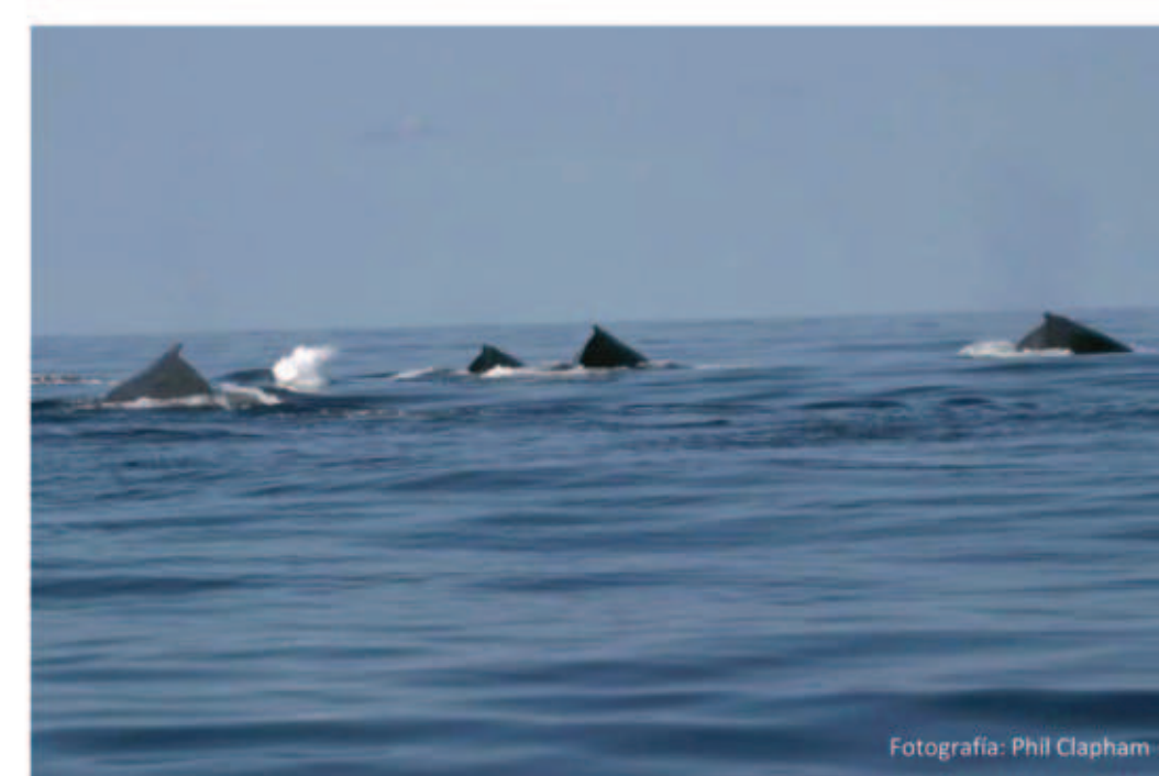
Grupo competitivo de ballenas jorobadas. Fotografía: Phil Clapham