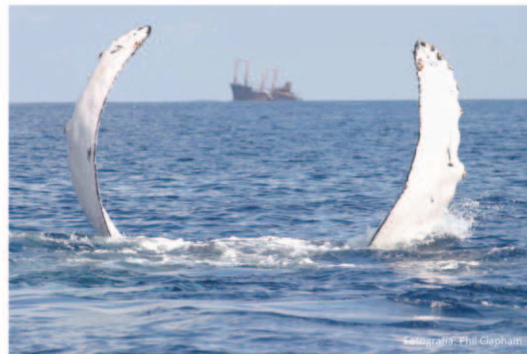
Ballena jorobada mostrando sus grandes aletas pectorales.