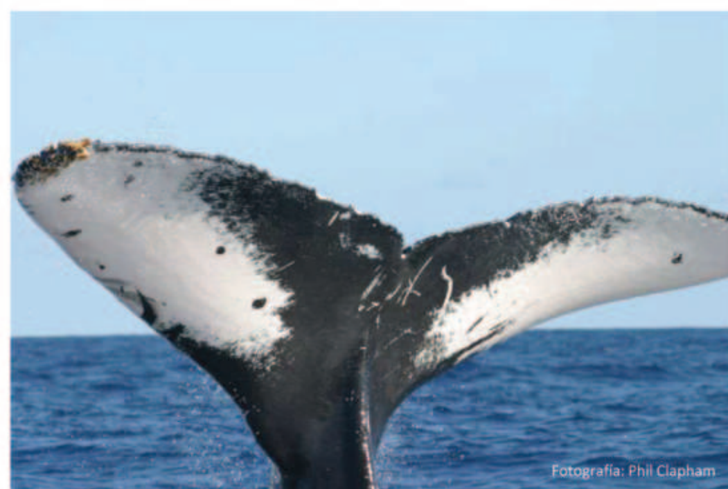
Aleta caudal o cola de ballena jorobada, pigmentación única para cada individuo y uno de los métodos para su identificación.