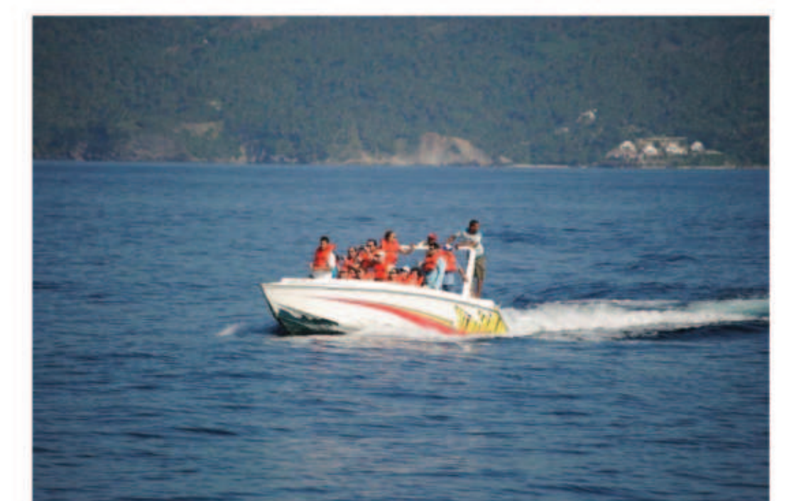
Visitantes en el Satuario Mamíferos Marinos, Samaná.