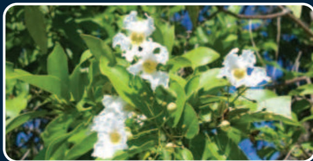
Roble Catalpa longissima

Este cofre de vida preserva el recurso hídrico y su potencial uso ecoturístico. Así como garantiza el funcionamiento de los procesos biológicos dentro de los humedales ubicados desde el pie de la sierra de Neiba hasta el lago Enriquillo. Además, es una de las Áreas Importantes para la Conservación de Aves en República Dominicana, (DR-IBAS), por sus siglas en inglés.