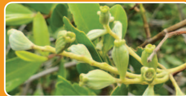
Mangle botón Conocarpus erectus