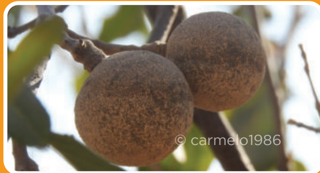
Cigüita blanca Xenoligea montana