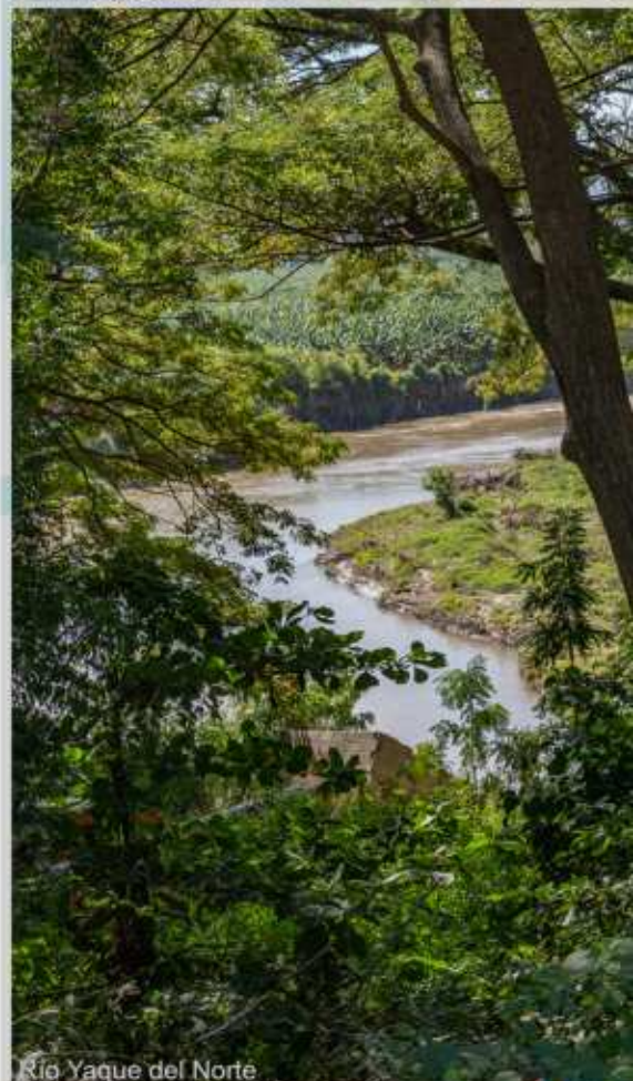
Río Yaque del Norte