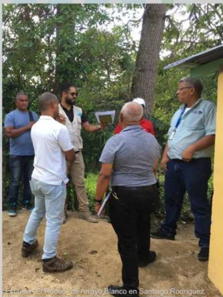
Escuela "El Rodeo" de Arroyo Blanco en Santiago Rodríguez

Continuamos con el compromiso de propagar el tratamiento de aguas residuales con tecnología verde tipo Plan Yaque.