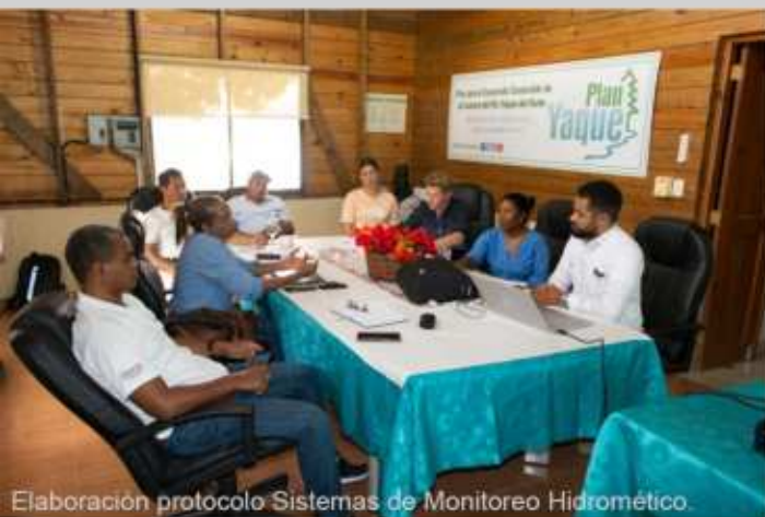
Elaboración protocolo Sistemas de Monitoreo Hidrométrico.

El componente Agua y Saneamiento del Plan Yaque, trabaja junto a REDDOM y el PSA en los reconocimientos de campo de la red de monitoreo para determinar el impacto del programa PSA en las fuentes de aguas influenciadas por sus beneficiarios.