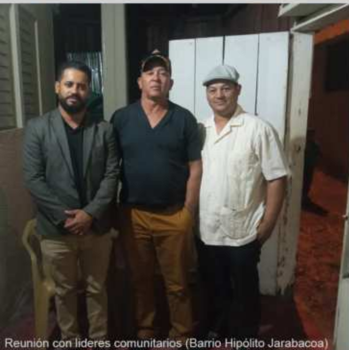
Reunión con líderes comunitarios (Barrio Hipólito Jarabacoa)

Plantas de Tratamiento de Aguas Residuales.