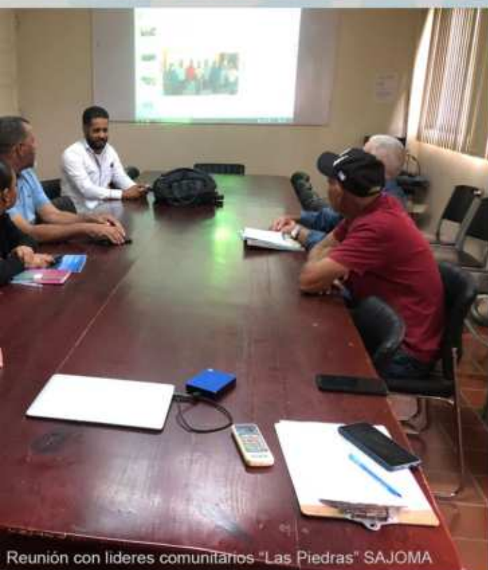
Reunión con líderes comunitarios "Las Piedras" SAJOMA

Continuamos con el compromiso de propagar el tratamiento de aguas residuales con tecnología verde tipo Plan Yaque.