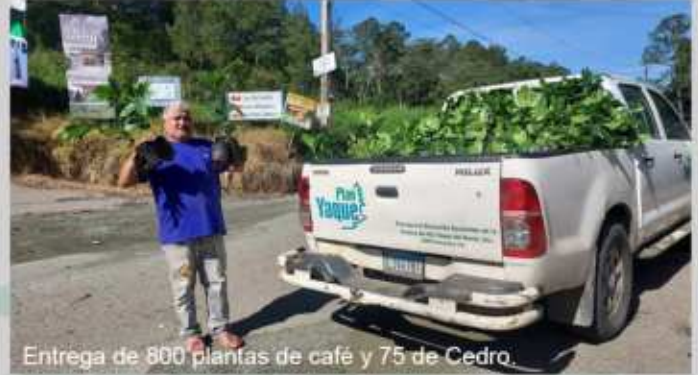
Entrega de 800 plantas de café y 75 de Cedro.

Trabajos realizados dentro del marco del proyecto "Conservación y Fomento de Cobertura" desarrollado por el Fondo Agua Yaque del Norte y el Plan Yaque, Inc en la micro-cuenca Los Dajaos.