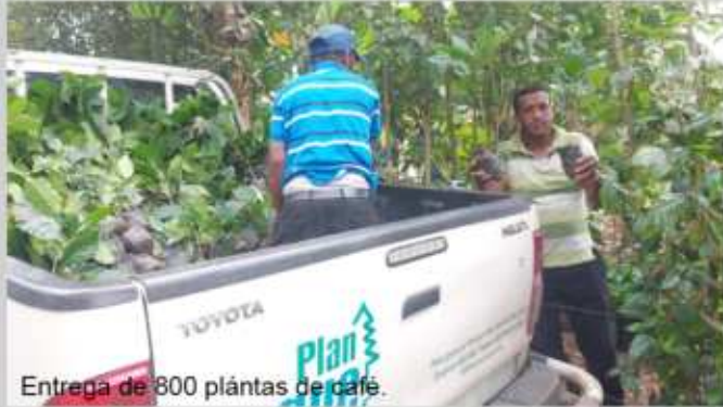
Entrega de 800 plántulas de café.

Entrega de plántulas a productores de la cuenca.