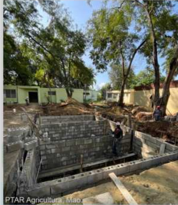
PTAR Agricultura, Mao