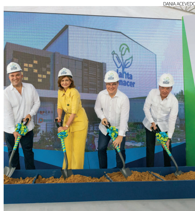
Primer palazo de Planta Renacer en San Pedro de Macorís.

Impulso a economía Durante su intervención, la