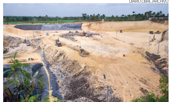
Relleno sanitario en la provincia La Altagracia.

En ese sentido, citó las obras que forman parte del plan marco del Fideicomiso, como el relleno sanitario en Dajabón, que