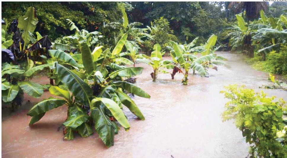
Reducción de producción agrícola sería una de las causas de desplace hacia zonas urbanas.