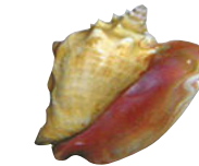
LAMBÍ Lobatus gigas Del 1ro. de julio al 31 de octubre