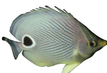
PECES MARIPOSA Chaetodontidae Del 2 de julio 2021 al 2 de julio 2023