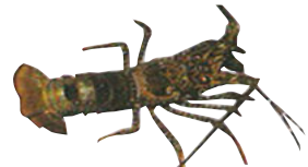
LANGOSTA PINTA Panulirus guttatus Del 1ro. de marzo al 30 de junio