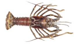
LANGOSTA ESPINOSA Panulirus argus Del 1ro. de marzo al 30 de junio