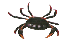
MORO Gecarcinus ruricola Del 1ro. de marzo al 30 de junio