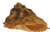
BURGAO SANTA MARÍA Astraea caelata Del 1ro. de julio al 31 de octubre