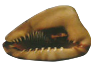
PATA DE MULO Cassis tuberosa Del 1ro. de julio al 31 de octubre