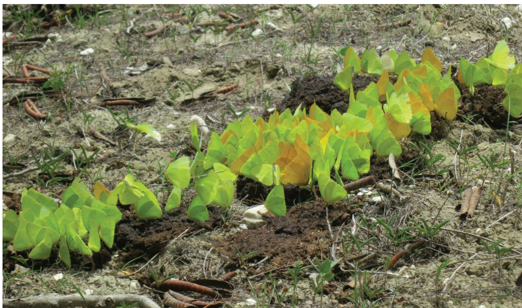
Figura 1. Phoebis agarithe y Phoebis Sennae , Monte Seco Espinoso Subtropical, Sierra Martín García.

Las zonas de mayor riqueza fueron BT y BH con 29 y 27 especies, respectivamente. El BH presentó la menor abundancia con apenas 148 individuos. Las especies con mayor número de individuos en BH fueron Archimestra teleboas (Ménétriés, 1832), Agraulis vanillae insularis Maynard, 1889, con 21 individuos cada una y Heliconius charitonia churchi Comstock & Brown, 1950, con 20. De las 29 especies que se encontraron en el BT, 51.72% pertenecen a la familia Nymphalidae, seguida de las familias Pieridae y Hesperidae. Una distribución similar se observó en el BN, pero estuvo dentro de los lugares de menor riqueza (23 especies), en coincidencia con lo encontrado por Navarro (2002) y Bastardo (2007) en la Cordillera Central.