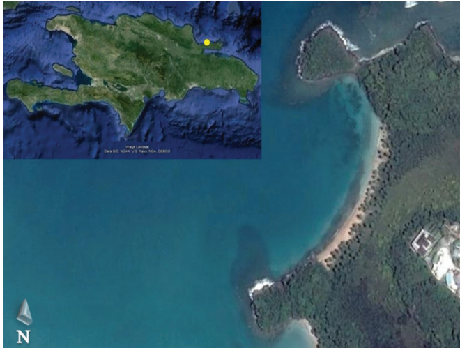
FIGURA 1. Mapa de Playa Barco Viejo, Samaná. La mancha oscura constituye el arrecife. Imagen satelital de Google Earth tomada el 17 de marzo del 2014.

En el litoral norte de esta península se encuentra Playa Barco Viejo o Del Desembarco ( 19^{\circ}19'04.6'' N, 069^{\circ}33'46.6'' W) con 225 m de longitud (fig. 1). Aproximadamente a 10 m de esta playa se encuentra la cañada El Jobo, la cual aporta agua dulce a la playa.