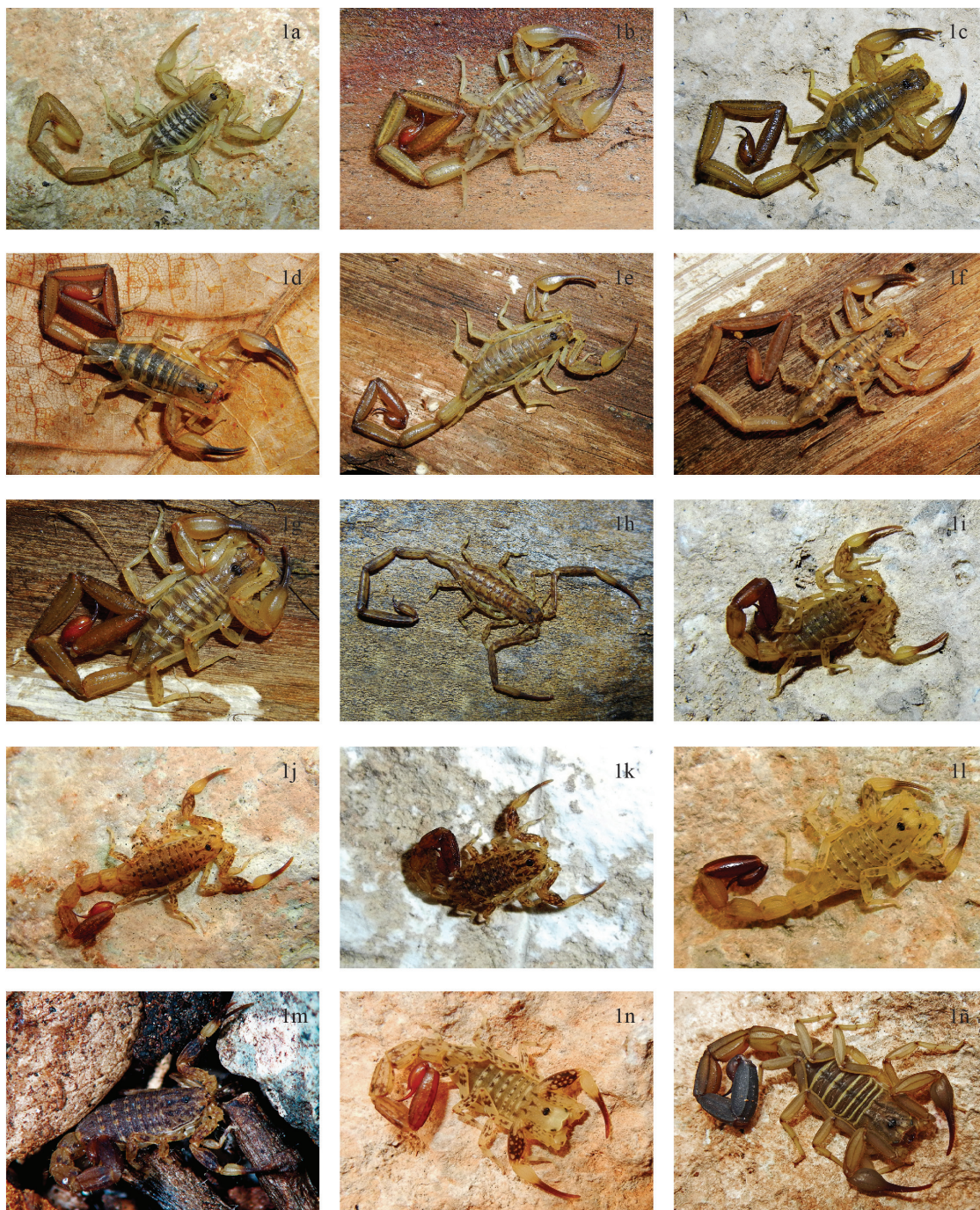
Figura 1. Escorpiones de La Española, fotografiados vivos en su hábitat natural. a) Centruroides alayoni , macho en la carretera Cabo Rojo-El Aceitillar, Pedernales; b) Centruroides altagraciae , macho paratipo de Boca de Yuma, La Altagracia; c) Centruroides bani , macho en El Número, Azua; d) Centruroides jaragua , macho de Maniel Viejo, Barahona; e) Centruroides lucidus , macho paratipo de Los Tres Charcos, Pedernales; f) Centruroides marcanoï , macho topotipo; g) Centruroides nitidus , macho de Río Mulito, Pedernales; h) Isometrus maculatus , macho de Sabana, Maisí, Cuba; i) Microtityus barahona , macho topotipo; j) Microtityus consuelo , macho topotipo; k) Microtityus iviei , macho de Sabana de Sansón, Pedernales; l) Microtityus lantiguai , macho en la carretera Cabo Rojo-El Aceitillar, Pedernales; m) Microtityus minimus , macho holotipo; n) Microtityus solegladi , macho de Segundo Paso, Bahoruco; ñ) Rhopalurus abudi , macho en Boca de Yuma, La Altagracia.