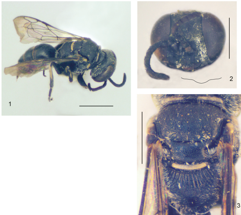
Figuras 1–3. Solierella garridoi sp. nov., hembra holotipo. 1, habito semilateral. 2, cabeza en vista frontal y contorno del margen libre del clipeo. 3, metapostnoto y propodeo. Escalas: Figura 1 = 1.5 mm, Figuras 2 y 3 = 1.0 mm.