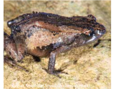
Ciguá Amarilla (Spindalis dominicensis) Rana ( Eleutherodactylus neibae ) © Luis Manuel Díaz.

especialista principal en la herpetología del Caribe. Fue mi tutor a lo largo de una relación de muchos años. Formalmente, hice una Maestría en Ecología y Ambiente en la UASD.