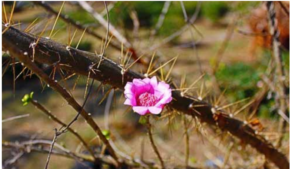
Rosa de Bayahibe (Leuenergeria quisqueyana), especie de planta preferida.

Si. Tan simple como el hecho de que cuando le pregunto a mis alumnos de ahora ¿Qué es un mimeógrafo? prácticamente ninguno sabe la respuesta, y donde estamos ahora con la tecnología de la información, ni que decir con todas las aplicaciones en base a la inteligencia artificial. Del 1966 (soy matrícula 66 en la UASD), al