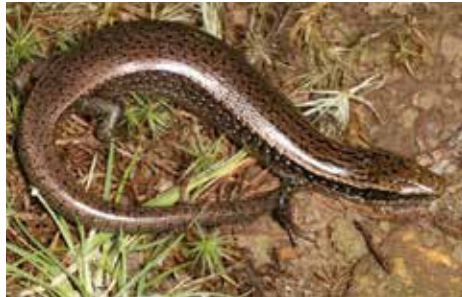
Rana Lucía (Diploglossus marcanoii)