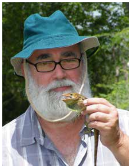
Con Saltacocote (Anolis baleatus) en Santiago Rodríguez año 2011

biológica de nuestra isla Hispaniola y nuestro país, República Dominicana, es nuestra responsabilidad mantenerla y gestionarla de manera sostenible, para beneficio y deleite de las futuras generaciones. Como país con un alto número de especies endémicas, nuestra res-