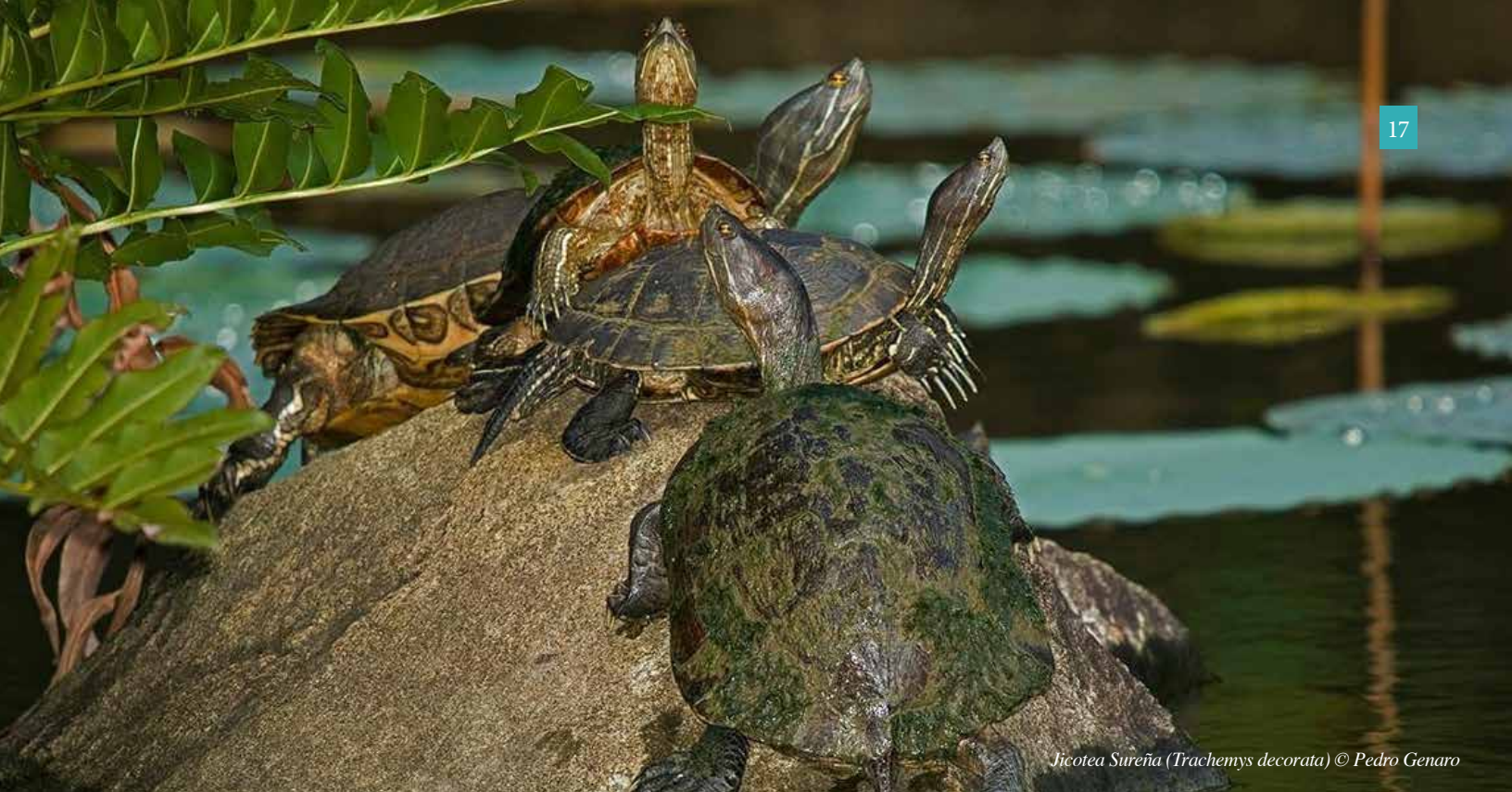
Jicotea Sureña (Trachemys decorata)