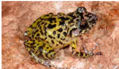
Rana (Eleutherodactylus ligiae)