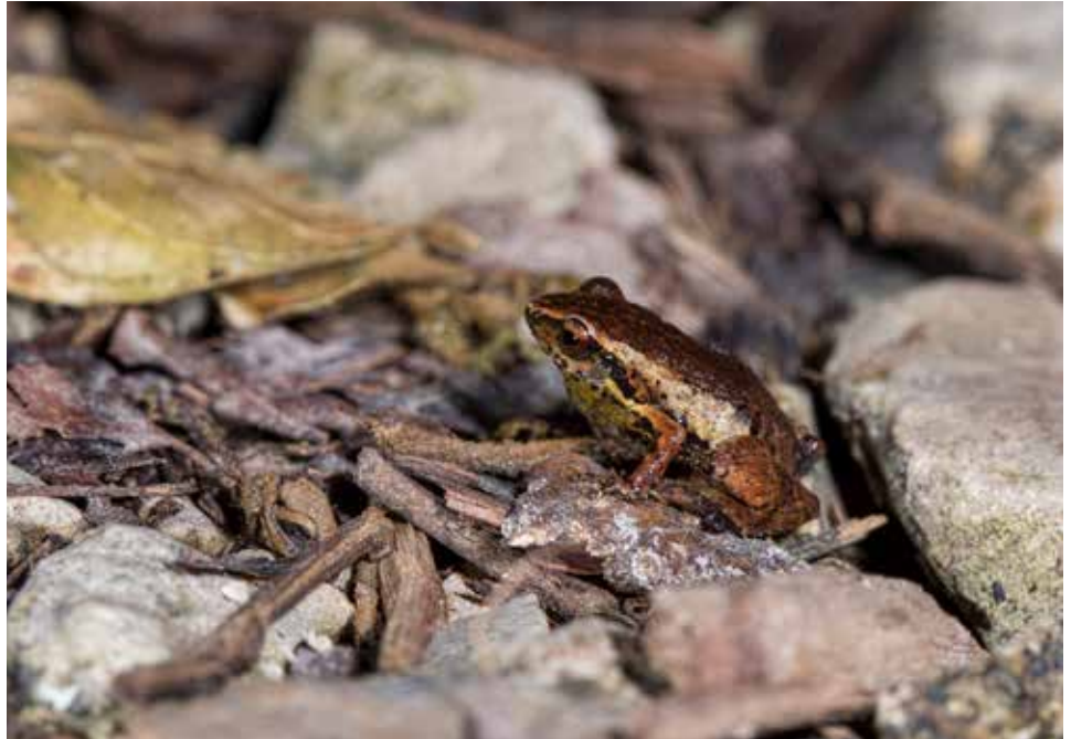
Rana (Eleutherodactylus geitonos)

Son muchos los personajes de la biología por los que siento admiración, pero el principal es Carlos Darwin. Realizar sus estudios sobre la evolución biológica, en el momento histórico que lo hizo, con la minuciosidad y detalle, nadando contracorriente de la gran mayoría de los estamentos de la sociedad en la que le tocó vivir, y mantener sus ideas y conceptos, me merece mucho respeto ya admiración.