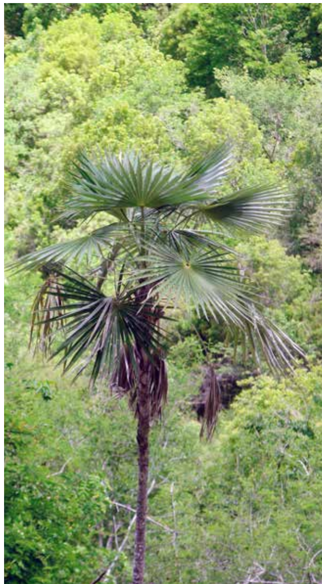
Coccothrinax , delgada palmera nativa del Parque Nacional Anacaona.

De los reptiles se observaron: Saltacocote ( Anolys sp ), Culebra sabanera ( Hypsihynchus parvifrons ), Higuana ( Ciclura ricordi ), Culebra arborícola ( Uromacer oxyrhynchus ). También se reporta la presencia del mamífero, Cerdo cimarrón ( Sus scrofa ).