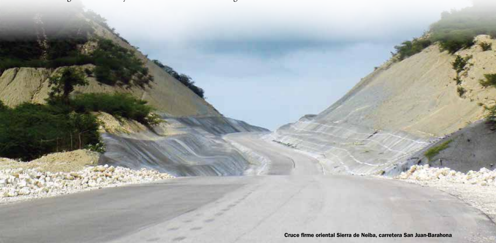
Cruce firme oriental Sierra de Neyba, carretera San Juan-Barahona

El Parque Nacional Anacaona, presenta una geología compleja, que demarca el origen de acontecimientos que conformaron la definición de cursos actuales de ríos y el conjunto de sierras y montañas enclavadas en la región de la hoya de Enriquillo.