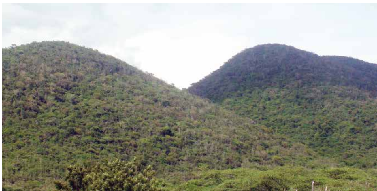
Montañas y cañones intramontanos (Sierra de Neiba oriental)