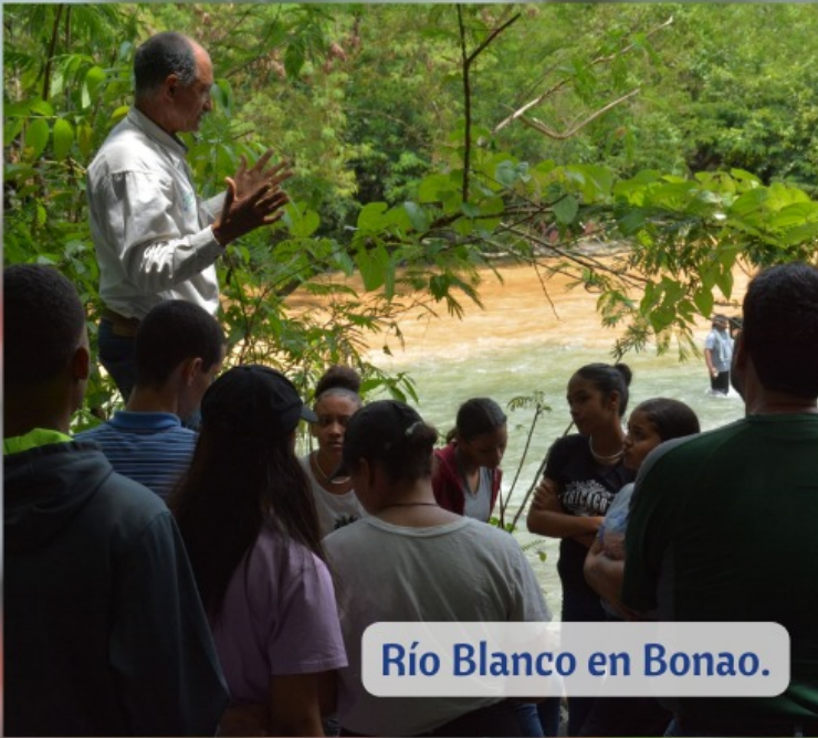
Río Blanco en Bonaó.