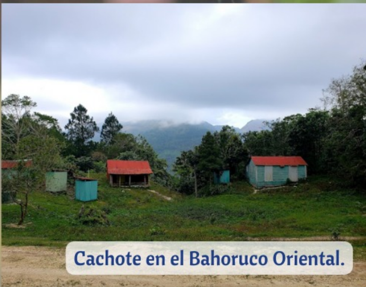
Cachote en el Bahoruco Oriental.