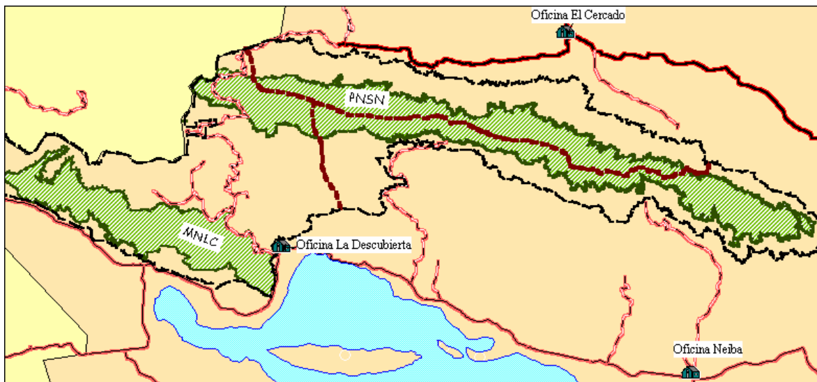
Mapa: División administrativa del Parque Nacional Sierra de Neyba (PNSN) y del Monumento Natural Las Caobas (MNLC)

La Sierra de Neyba es una montaña muy compleja en cuanto a su relieve y en cuanto a sus poblaciones humanas. Pertenece a cuatro provincias y las vías de acceso salen de sitios que quedan lejos uno del otro. Este hecho hace muy difícil administrar el parque desde un solo lugar.