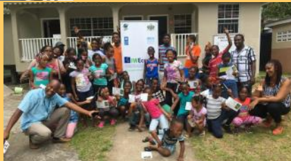
Participantes en el campamento de verano con representantes de IWEco y otras agencias socias