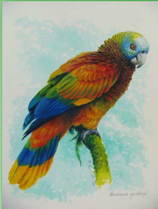
La Amazona de San Vicente ( Amazona guildingii ), pintura de Chris Cox