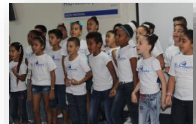
Niños de La Colmenita cantan sobre el valor de los arrecifes de coral