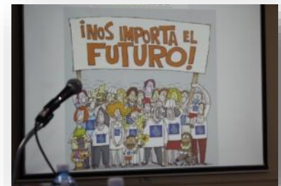
El proyecto nacional cubano tomó la delantera creando el principal mensaje de IWEco