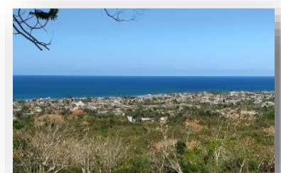
Peñas Altas en la Cuenca de Guanabo