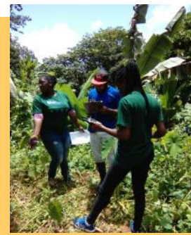
Young persons hired under IWECO undergo training to conduct farm assessments.

La Gestión Sostenible de Suelos es una prioridad en esta Cuenca y se espera que este trabajo de rehabilitación de laderas abarque casi tres cuartas partes del proyecto de IWECO. Esto incluirá trabajos en unas cincuenta parcelas de agricultores en Migny. Las actividades de fortalecimiento de capacidades van dirigidas a varios grupos de interés, incluyendo a campesinos u oficiales de extensión en el área de intervenciones de gestión sostenible de agua, tierras y ecosistemas, mayor sensibilización sobre leyes y reglamentos, giras de campo que resalten las buenas y malas prácticas, y formación en el uso de computadoras para la captura de datos, etc.