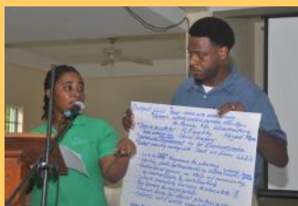
Participantes en el Taller de Inicio

El Taller de Inicio del Proyecto se efectuó en enero de 2018 en Fond St. Jacques, Soufriere. Más de 60 participantes recibieron una sinopsis de los proyectos. Se invitó a los interesados a apropiarse del proyecto y se compartieron lecciones aprendidas de iniciativas anteriores en las