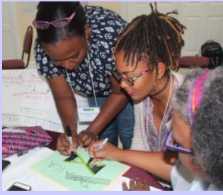
Participantes jamaícuinos trabajan en su campaña nacional durante el Taller Regional de Comunicaciones, Santa Lucía, del 30 de octubre al 3 de noviembre de 2017

Una Alianza de Sensibilización Pública y Educación Pública (PA/PE Partnership) fue formada por IWEco en octubre de 2017 para poner a disposición una amplia gama de destrezas, pericias y recursos para la UCP y los países participantes para desarrollar herramientas de extensión y educación pública. Esto ha sido posible gracias a una combinación de financiamiento directo del FMAM y co-financiamiento proveniente de los asociados.