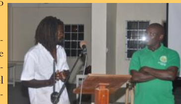
Un agricultor de la Cuenca del Alto Soufriere expresa su opinión