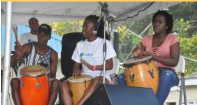
Grupo de tambores locales actuando en el lanzamiento de IWEco