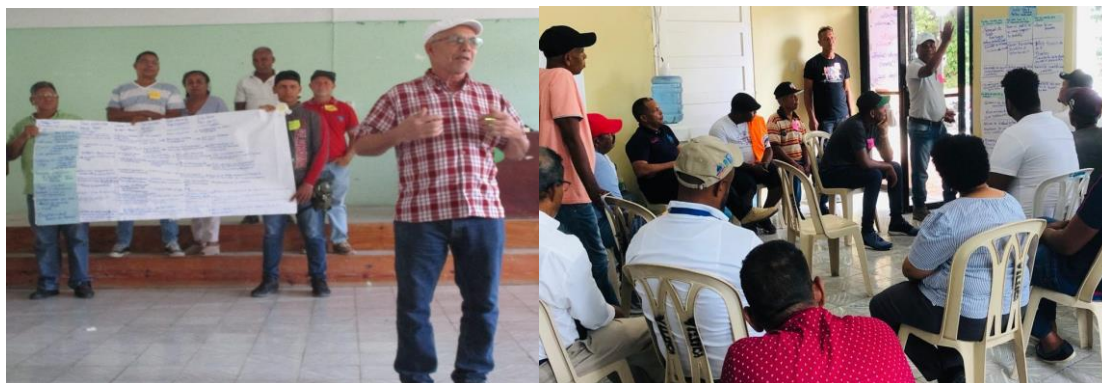
Encuentros consultivos Neyba y Tamayo