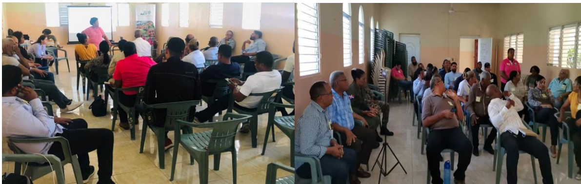
Fotos encuentro presentación agenda ambiental.