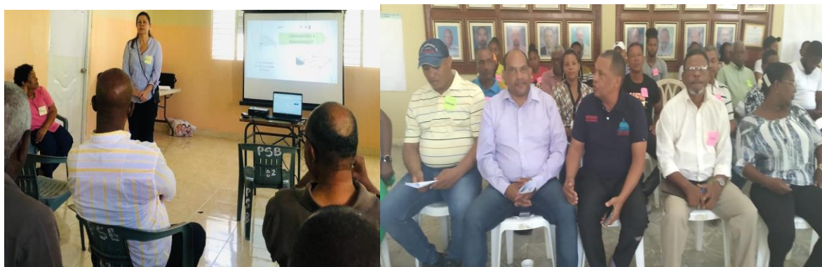
Encuentro presentación agenda ambiental y encuentro consultivo municipio Tamayo