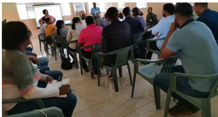
Encuentro presentación agenda ambiental