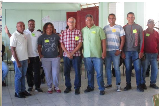
Encuentro consultivo Neiba