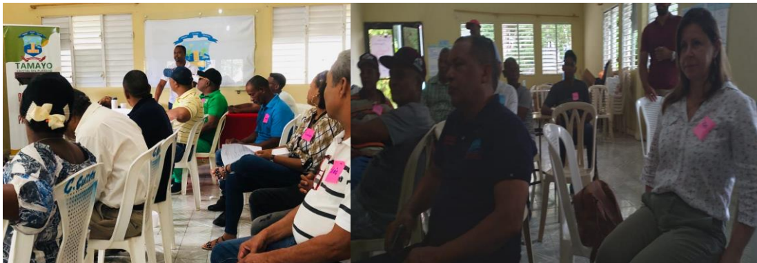
Encuentro consultivo municipio de Tamayo