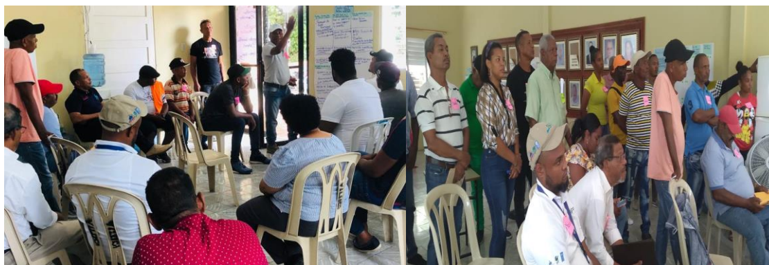
Encuentro consultivo municipio de Tamayo

Es importante considerar que en cada una de las afectaciones a los recursos naturales la actividad agropecuaria tiene un gran peso, afectando la resiliencia de cada uno de estos ecosistemas, por lo tanto, se debe considerar al momento de realizar la agenda ambiental y los planes operativos.