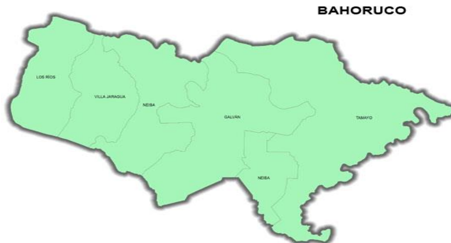
Mapa 1. División territorial Bahoruco

Forma parte del grupo de provincias de la zona suroeste del país, situada en la gran llanura Hoya de Enriquillo. Es la décima provincia de menor población de habitantes en la República Dominicana, y la décimo séptima de mayor extensión territorial.