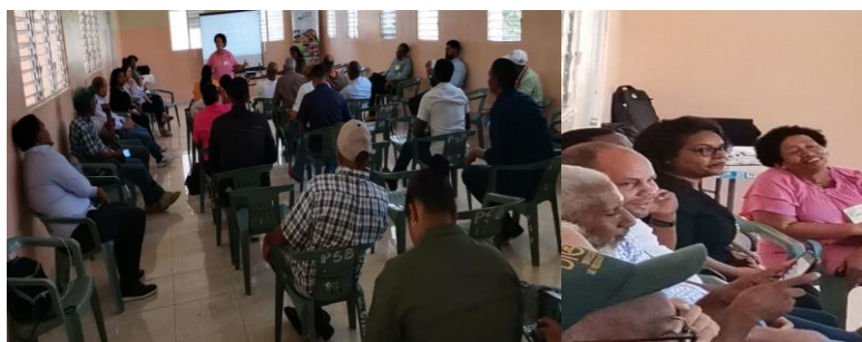
Encuentro presentación agenda ambiental Equipo oficina provincia Bahoruco