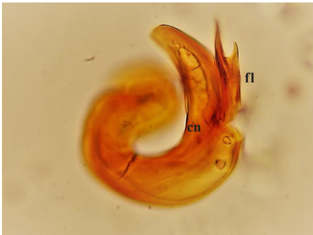
Figura.3. Genitalia masculina en O. flaviceps : cono (cn); flagelo (fl).