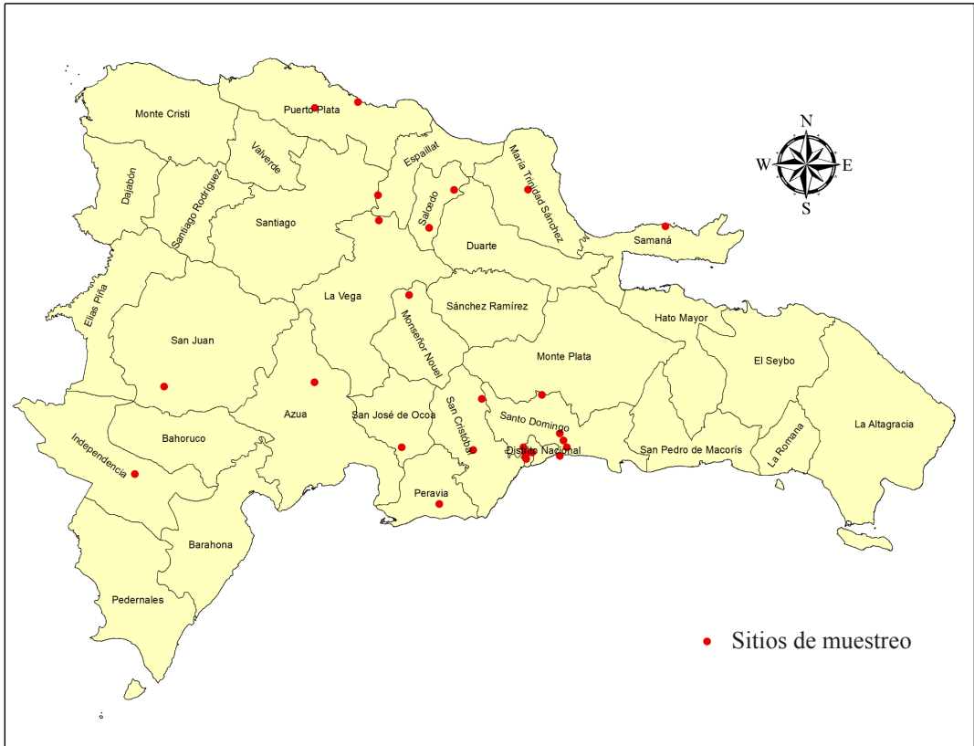
Figura 4. Mapa de República Dominicana mostrando los puntos donde se recolectaron los especímenes de O. flaviceps .

El número de especies de Antocóridos documentadas en República Dominicana es reducida, sin duda se verá incrementada cuando se realicen campañas de colecta y estudio por toda la isla. La posición de Lasiochilus (Lasiochilus) hirtellus Drake & Harris, 1926, considerada antiguamente como un antocórido, y citada por Carpintero (2002; 2014), ha sido revisada y actualmente pertenece a una familia independiente, Lasiochilidae.