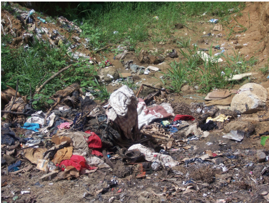
Vista del Vertedero al inicio de la iniciativa en septiembre 2007