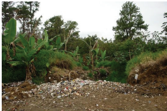
Situación del vertedero a diciembre 2008