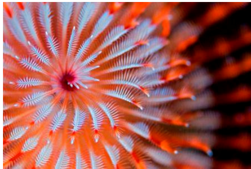
Gusano arbol de navidad ( Spirobranchus giganteus )