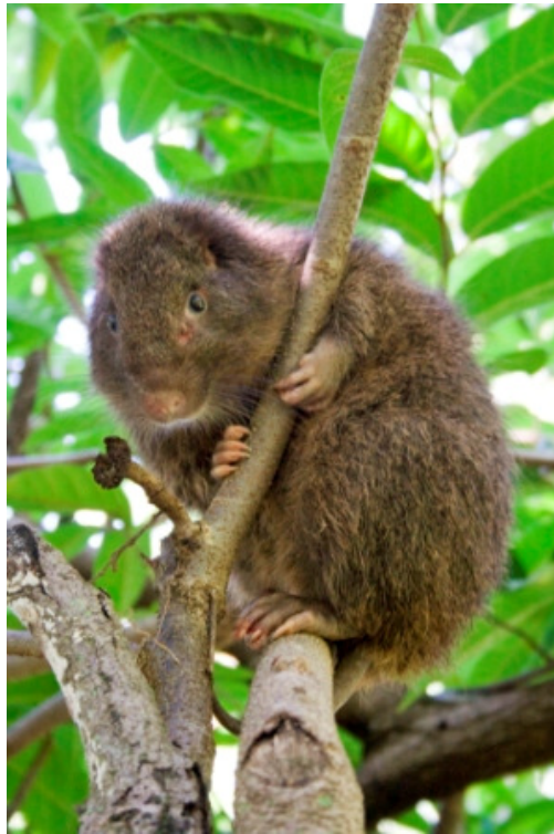
La Jutía de la Hispaniola ( Plagiodontia aedium )