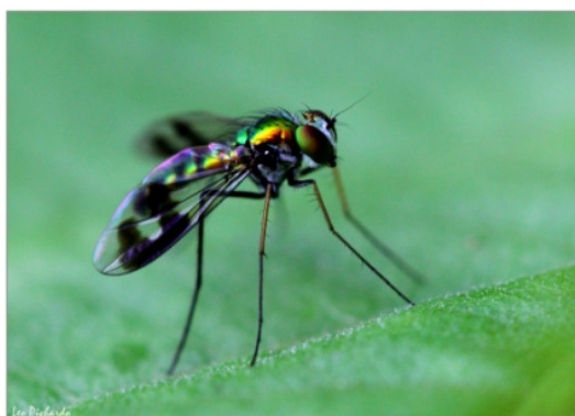
Mosca de la familia Dolichopodidae Por Leo Pichardo