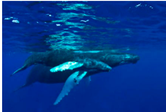
Ballena Jorobada ( Megaptera novaeangliae )