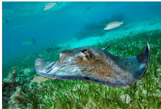
Raya americana ( Dasyatis americana )

MAMIFERO NATIVO MIGRATORIO. Sólo se alimenta en las zonas polares y viene a Republica Dominicana a reproducirse.