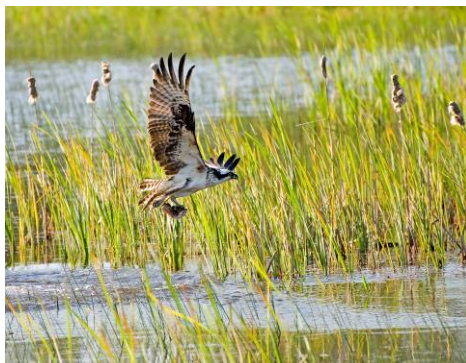
Águila pescadora ( Pandion haliaetus )