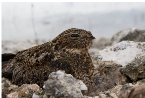
Querebebé ( Chordeiles gundlachi )