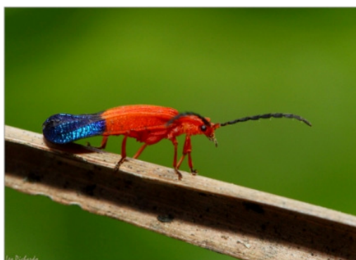
Escarabajo de la familia Lycidae Por Leo Pichardo