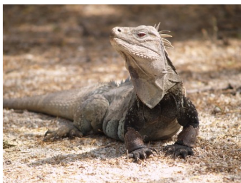
Iguana Ricordi ( Cyclura ricordi )

Sólo existe a los alrededores de Pedernales.