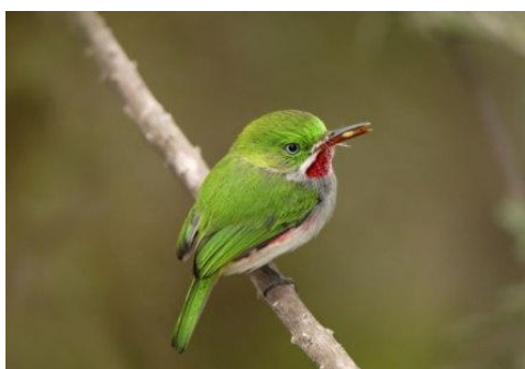
Chi-cuí ( Todus angustirostris )