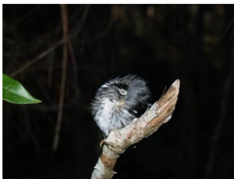
Pega palo ( Mniotilta varia )