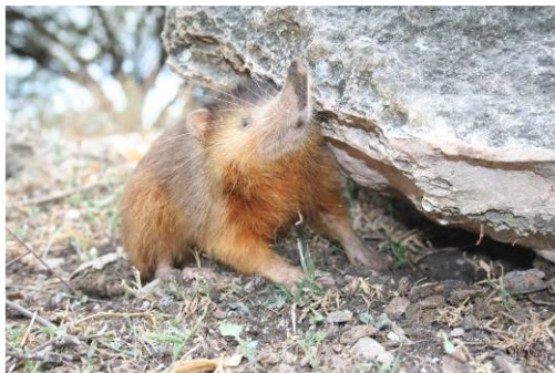
Solenodonte de la Hispaniola ( Solenodon paradoxus )