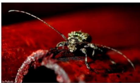
Escarabajo de la familia Cerambycidae