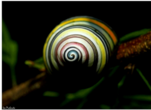
Caracol de Arco Iris ( Liguus virgineus )