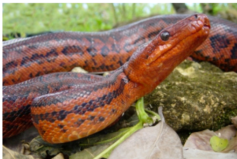
Boa de la Hispaniola ( Epicrates striatus )

ENDEMICA y en peligro crítico de extinción. Sólo existe en la Península de Barahona y el Valle de Neiba.