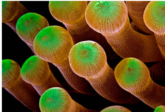
Anemona gigante ( Condylactis gigantea )