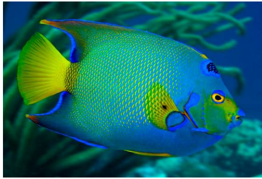
Pez angel reyna ( Holacanthus ciliaris )