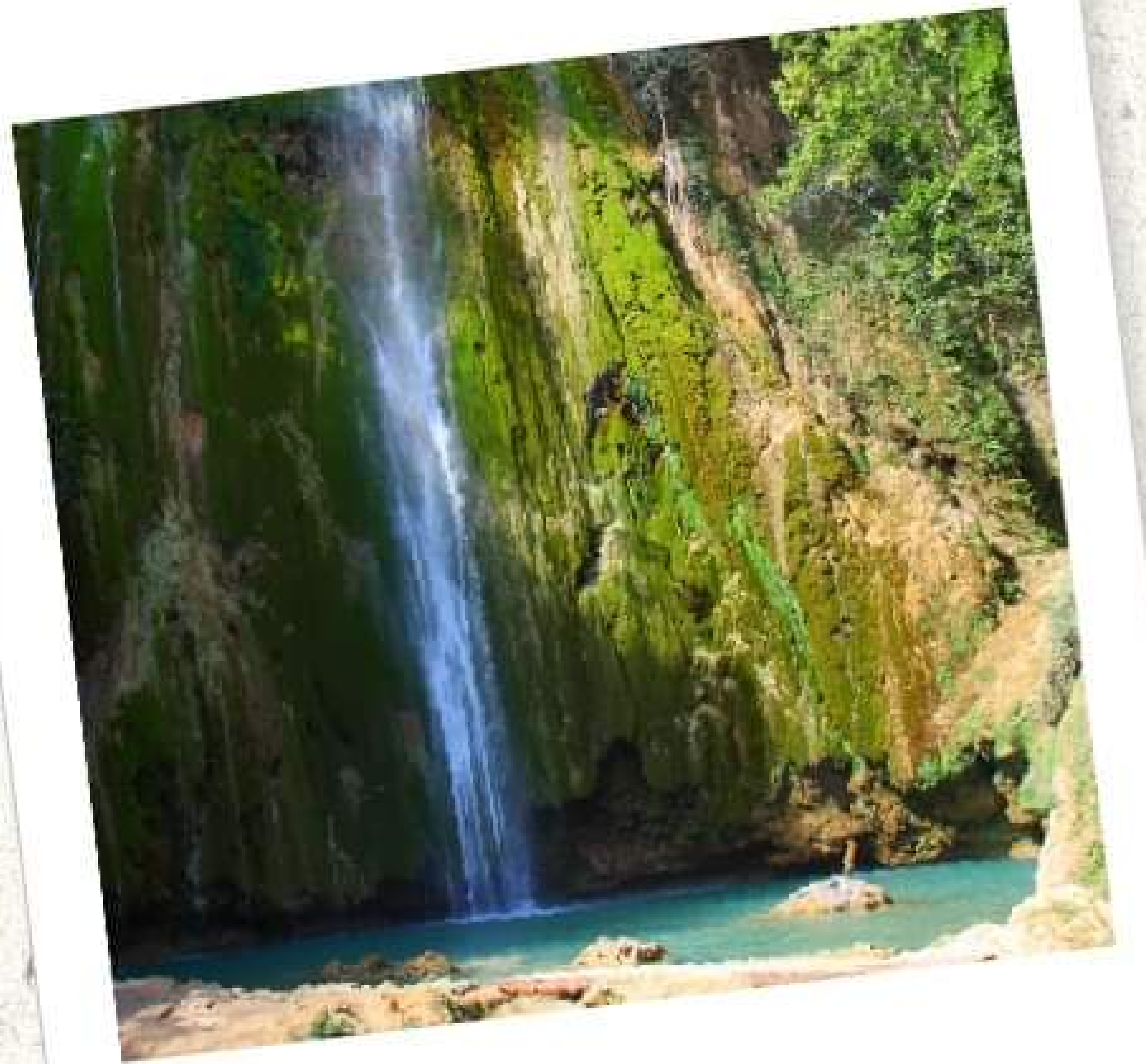
Salto del Limón, Samaná