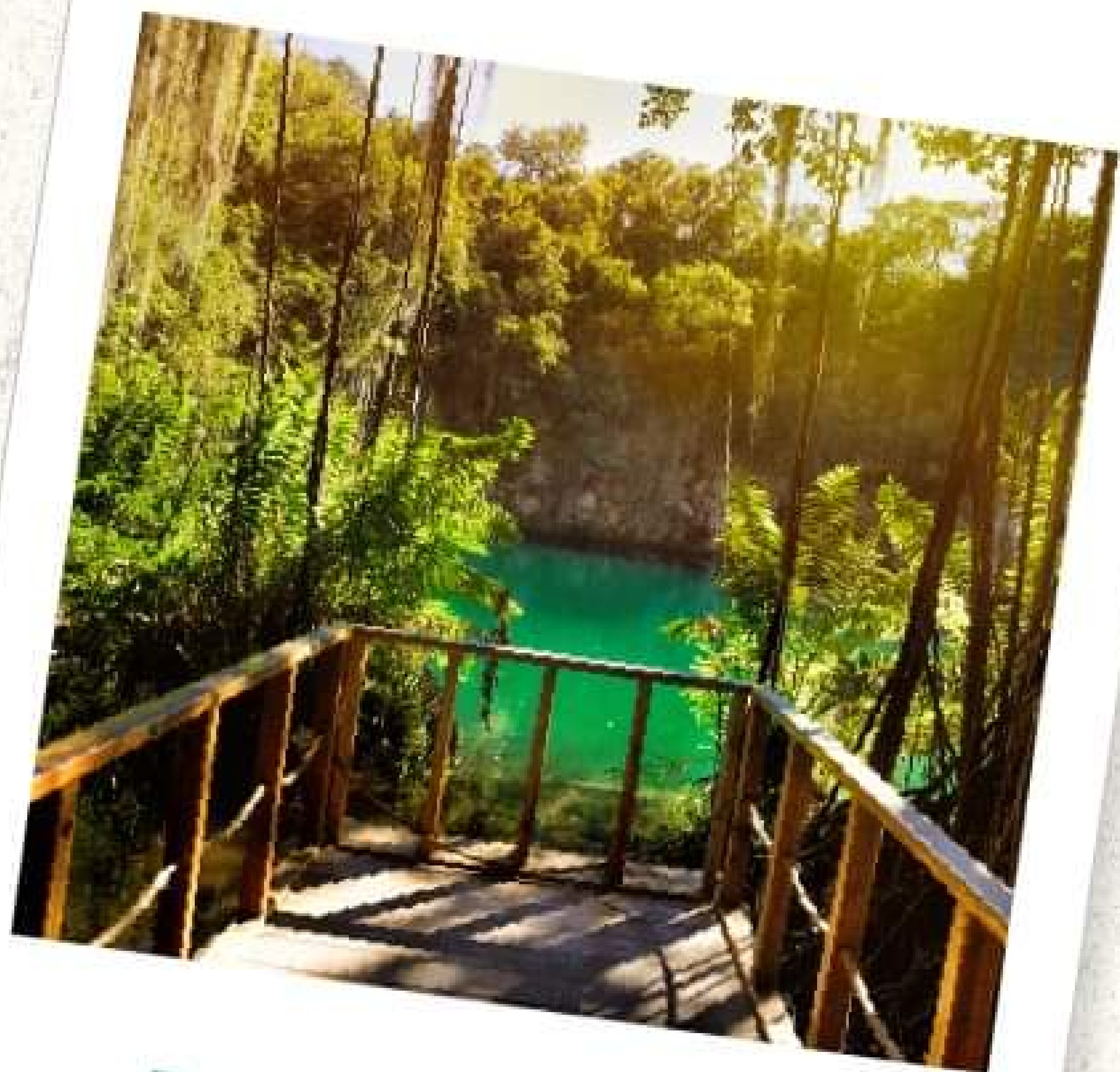
Parque Nacional Los Tres Ojos