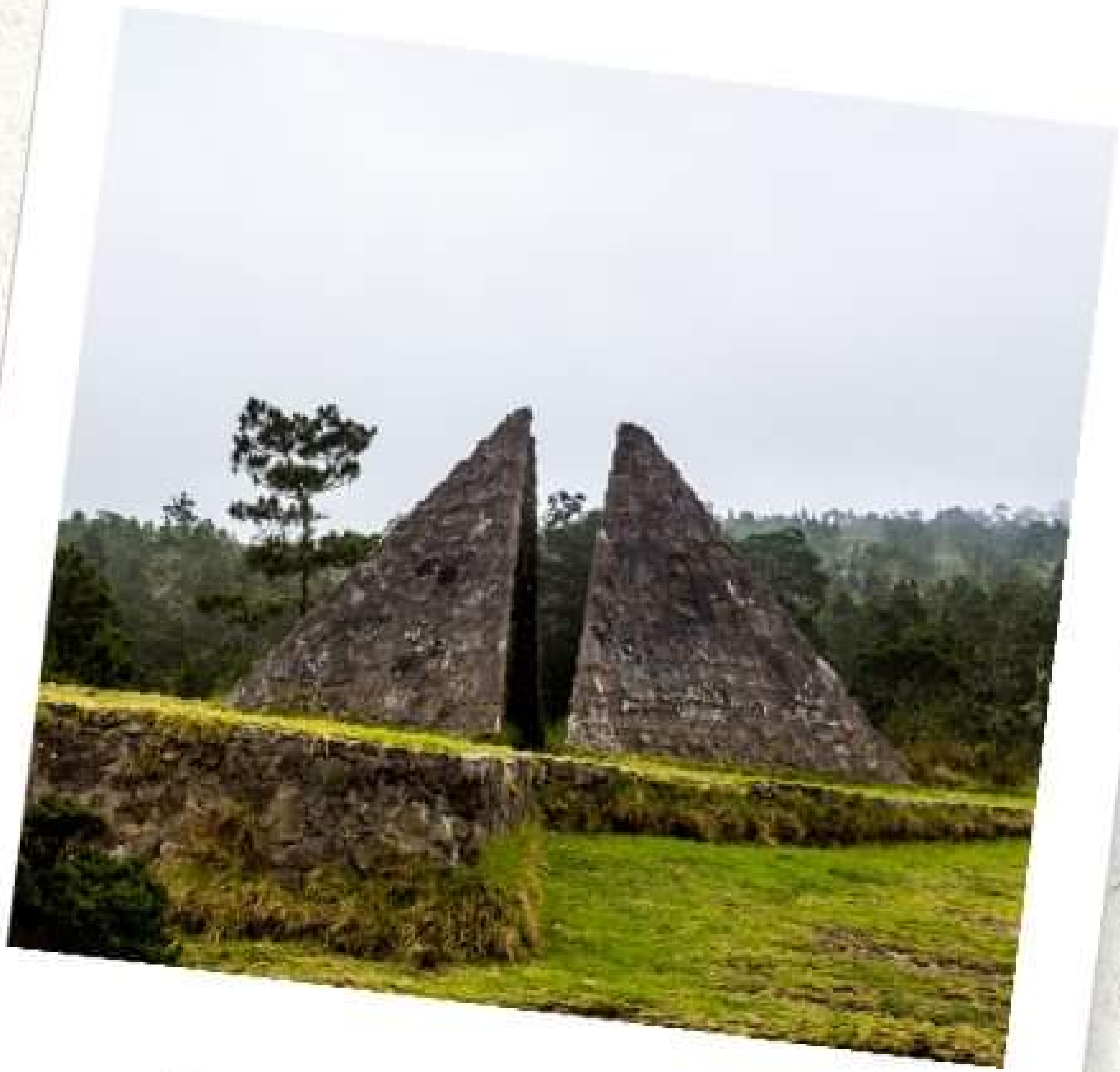
Parque Nacional Valle Nuevo