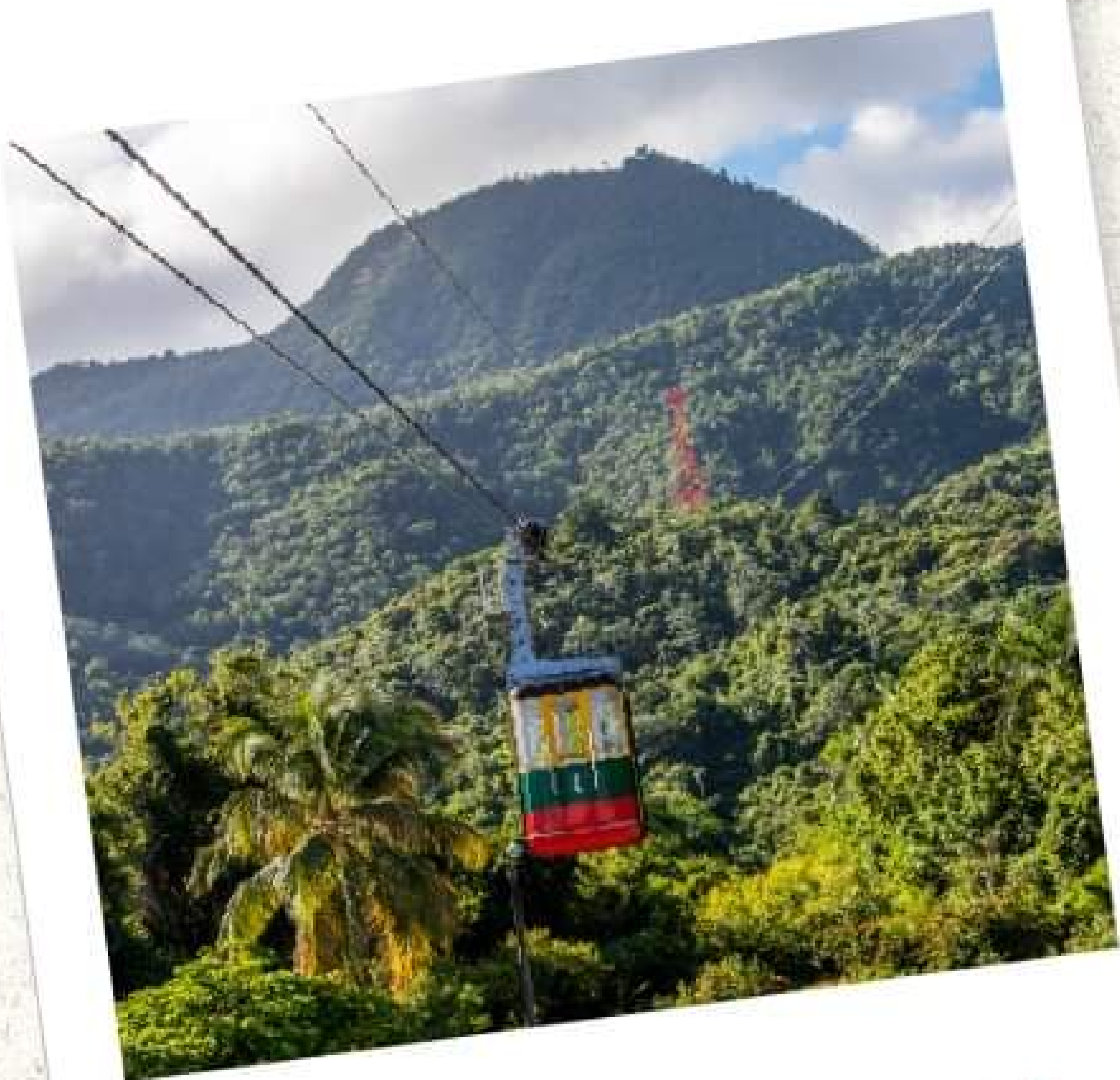
Loma Isabel de Torres, Puerto Plata