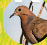
ROLÓN ( Zenaida aurita )