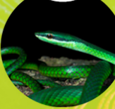
UROMACER OXYRHYNCHUS ( Culebra verde )