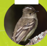
ELAENIA ( Marobita canosa )