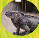
IGUANA RINOCERONTE ( Cyclura cornuta )