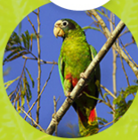
COTORRA DE LA ESPAÑOLA ( Amazona ventralis )