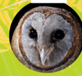
LECHUZA CARA CENIZA ( Tyto Glaucops )