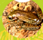
OSTEOPILUS DOMINICENSIS ( Rana común de la española )