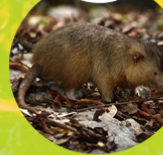
SOLENOTONTE ( Solenodon paradoxus )