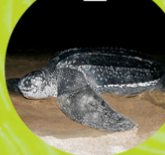
TINGLAR ( Dermodochelys coriacea )