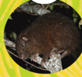
JUTÍA ( Plagiodontia aedium )