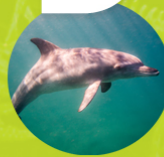
DELFIN NARIZ DE BOTELLA ( Tursiops truncatus )