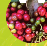
WALENIA ( Caimon )