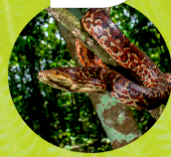
BOA DE LA ESPAÑOLA ( Chilabothrus striatus )