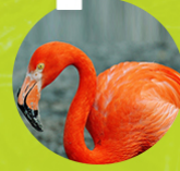
FLAMENCO DEL CARIBE ( Phoenicopterus ruber )