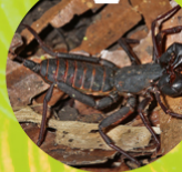
VINAGRILLO ( Uropygi )