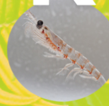
KRILL ( Euphausiacea )