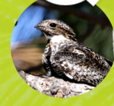
QUEREBEBÉ ( Chordeiles gundlachi )