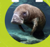
MANATÍ ( Trichechus manatus )