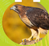
HALCÓN ( Buteo jamaicensis )