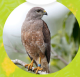
GAVILÁN DE LA ESPAÑOLA ( Buteo ridgwayi )