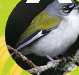
XENOLIGEIA MONTANA ( Cigüa aliblanca )