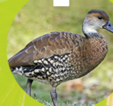
YAGUASA ( Dendrocygna arborea )