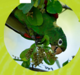
PERICO DE LA ESPAÑOLA ( Psittacara chloroptera )