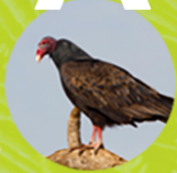
AURA TIÑOSA ( Cathartes aura )