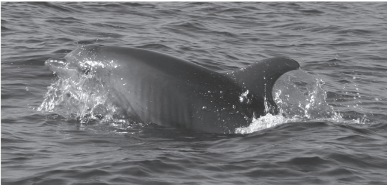
Figura 4. Tursiops truncatus observada durante el estudio.