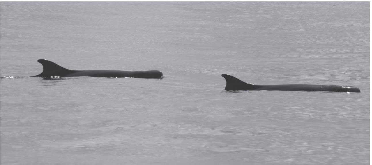
Figura 3. Kogia sima observada durante el estudio.