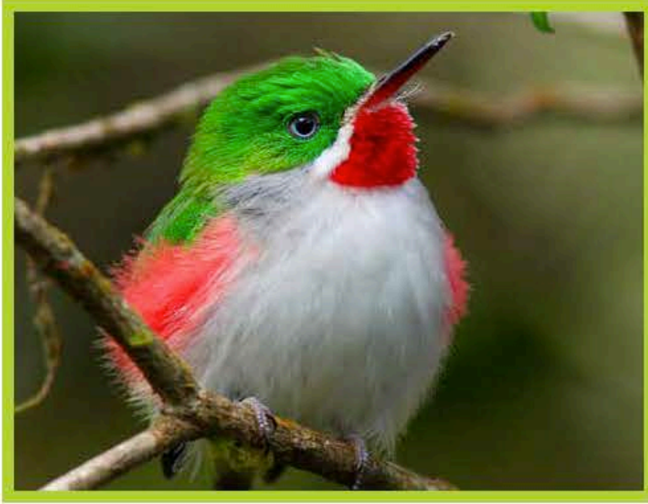
Chicui ( Todus angustirostris )