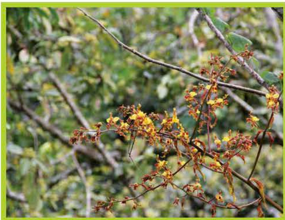
Orquídea ( Cyrtopodium punctatum )