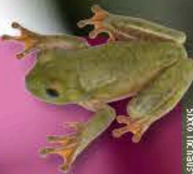
Rana verde ( Ostiopilus vastus )

Entre los mamíferos destaca el solenodonte ( Solenodon paradoxus ) y la jutia ( Plagiodontia aedium ).