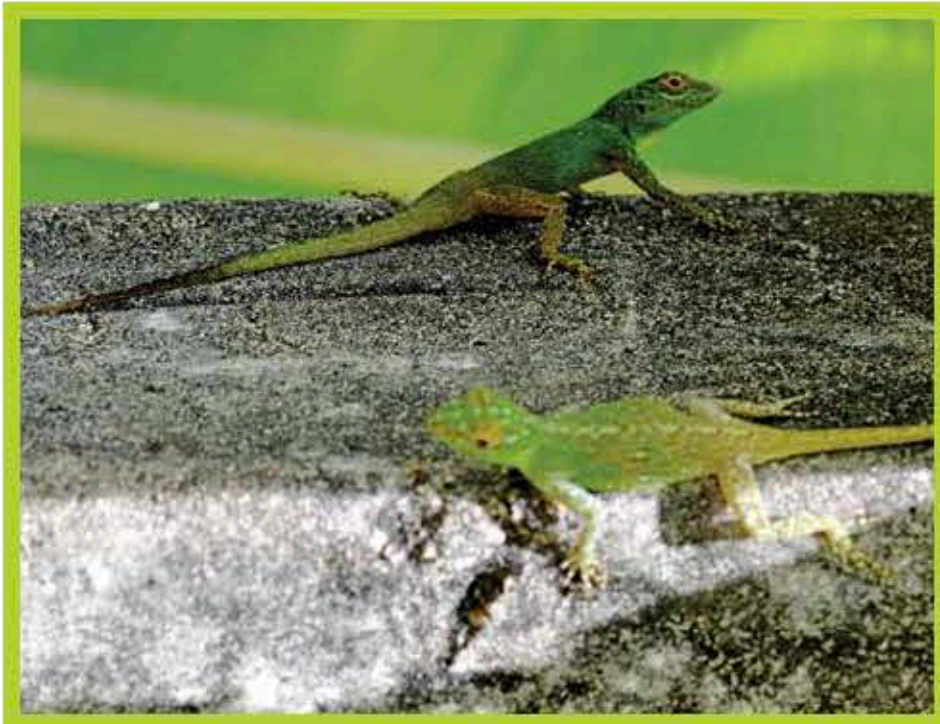
Anolis Gracil de la Hispaniola ( Anolis distichus )