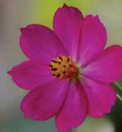
Flor Silvestra ( Cosmos caudatus )

Es un lugar importante para la conservación de 117 especies de plantas, amenazadas según la Lista Roja de República Dominicana y CITES (Convenio Internacional de Tráfico de Especies en Peligro), en este último se incluyen las 67 especies de orquídeas reportadas para el área.