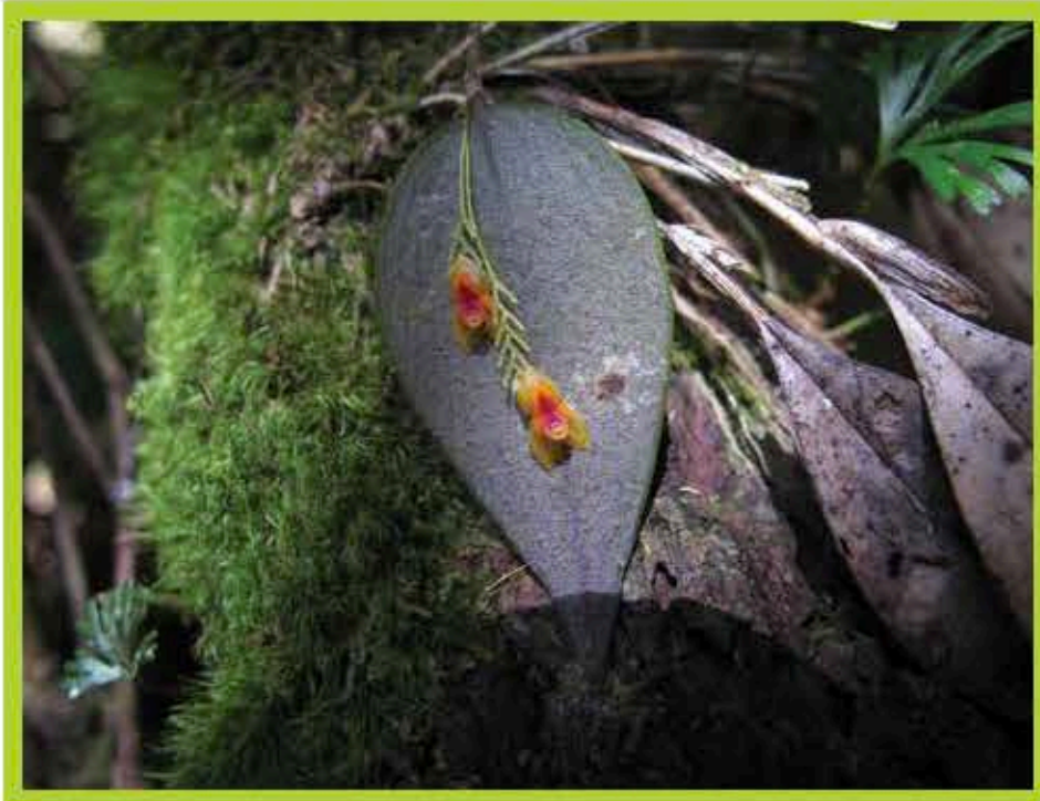
Orquídea ( Lepanthes sp. )