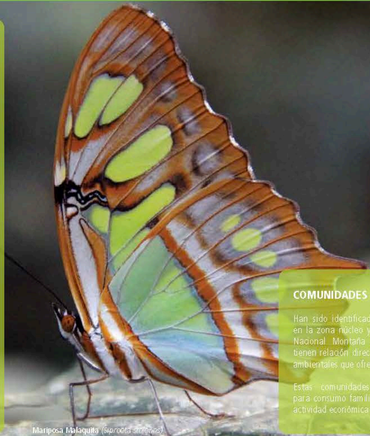
Mariposa Malaquita ( Gieraea streches )

Su red hídrica, supe de agua potable al Distrito Nacional, Santo Domingo Oeste, Santo Domingo Norte y San Cristóbal y sus aguas represadas en Jigüey, Aguacate y Valdesia, aportan energía hidroeléctrica, además de aportes importantes para el riego de cultivos.