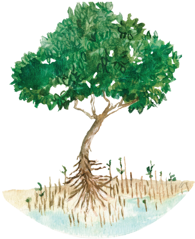
Mangle negro o prieto ( Avicennia germinans )