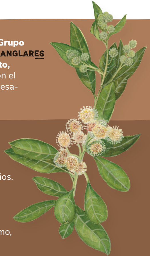
Frutos mangle botón ( Conocarpus erectus )