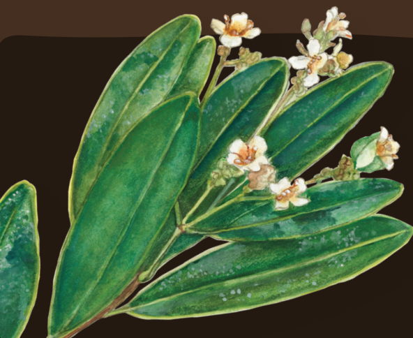
Flores mangle negro ( Avicennia germinans )

La importancia de los manglares es cada vez más reconocida por la gran cantidad de servicios ecosistémicos que aportan local, regional y globalmente. Por esta razón existe un gran interés mundial en conservar y restaurar los manglares.