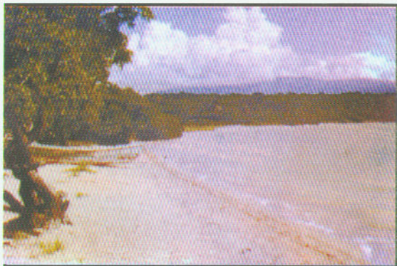
Parte Norte de la Laguna de Oviedo