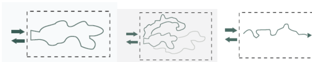
Figura 2. Tipos de senderos. De izquierda a derecha encontramos el sendero circular, el sendero multicircuitos y el sendero lineal.

En cuanto a los senderos, existen tres tipos de senderos interpretativos representados en las áreas protegidas: el sendero circular, el sendero multicircuitos y el sendero lineal.