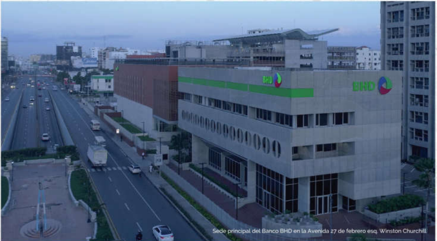
Sede principal del Banco BHD en la Avenida 27 de febrero esq. Winston Churchill

La entidad cuenta con múltiples iniciativas alineadas con los ODS