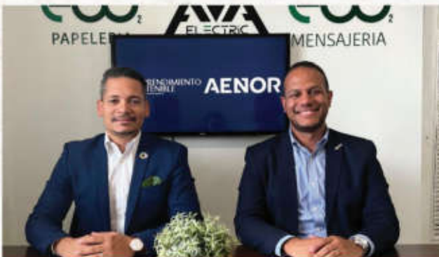
Emprendimiento Sostenible y AENOR Dominicana unen esfuerzos en favor del medio ambiente