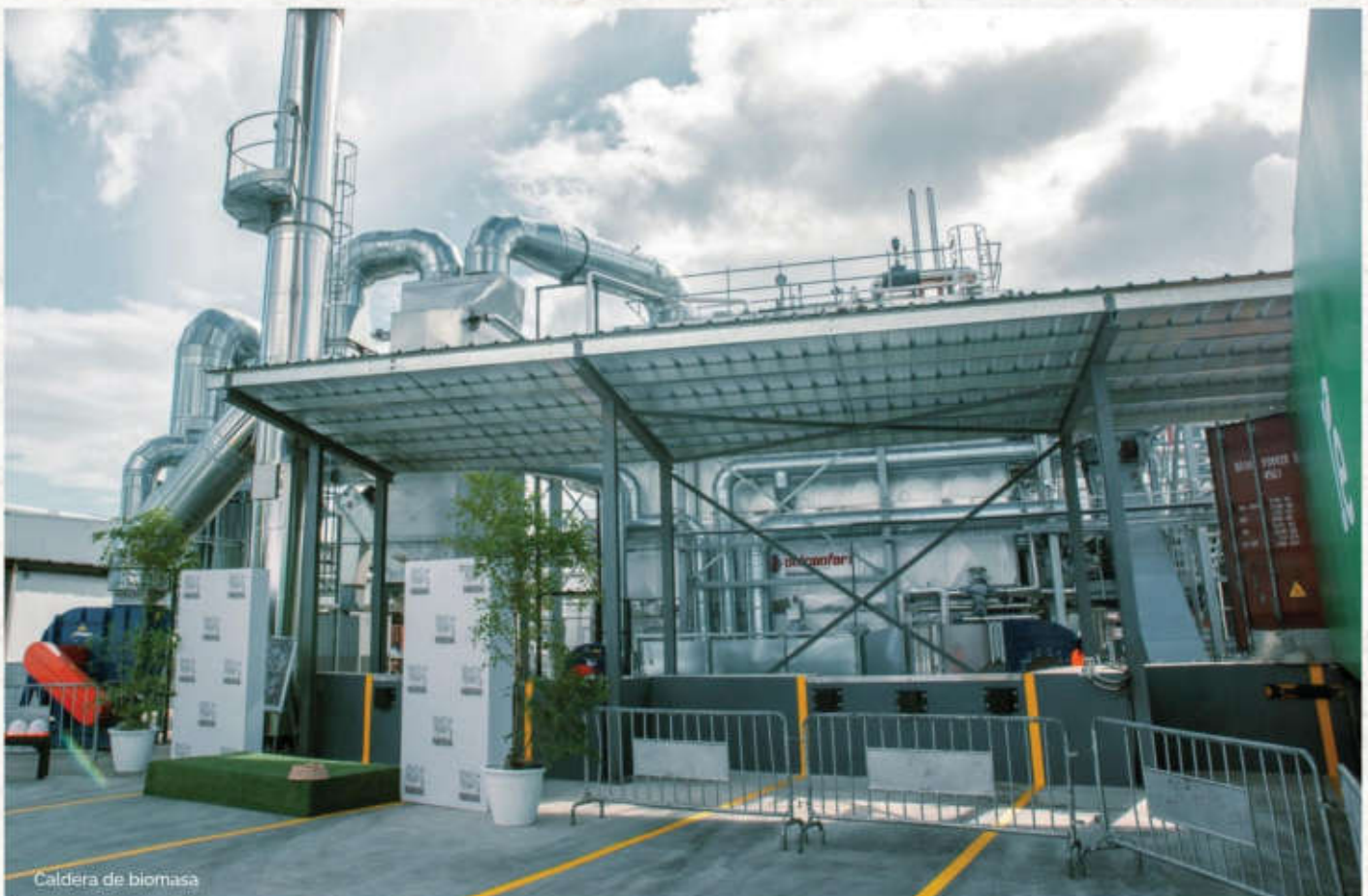
Caldera de biomasa

Sin embargo, tenemos la ambición de un futuro más sostenible, la determinación para llevarlo a cabo y la disposición de trabajar en conjunto.", expresa Wiechers.