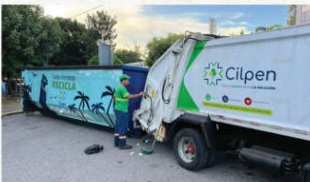
Cilpen Global recolecta más de 10 mil kilos de residuos durante conciertos de Bad bunny