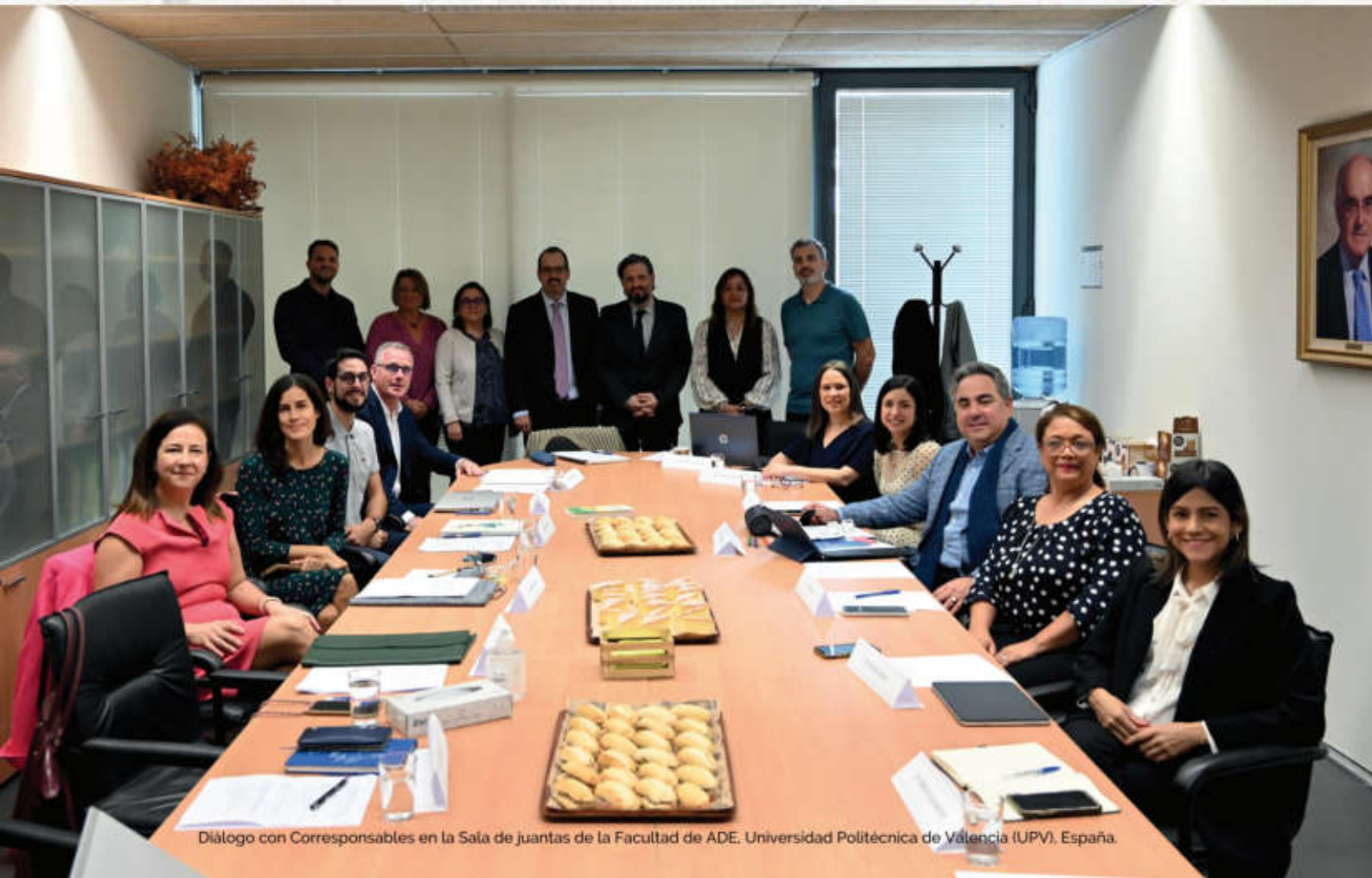
Diálogo con Corresponsables en la Sala de juntas de la Facultad de ADE, Universidad Politécnica de Valencia (UPV), España.

Ejemplo de ello es el acuerdo al que ha llegado Consum con una empresa energética para que el 100% de energía de la cadena sea renovable para los próximos 10 años.