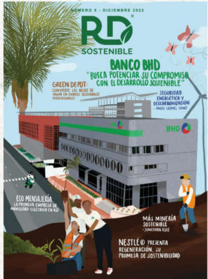
ILUSTRACIÓN DE PORTADA POR ANNETTE GONZÁLEZ ESPAÑOL

RD SOSTENIBLE ES UNA PUBLICACIÓN SEMESTRAL DE DISRUPCIÓN SOSTENIBLE, E.I.R.L., DEDICADA A PROMOVER NOTICIAS, TENDENCIAS Y BUENAS PRÁCTICAS DE RESPONSABILIDAD SOCIAL EMPRESARIAL Y SOSTENIBILIDAD EN LA REPÚBLICA DOMINICANA.