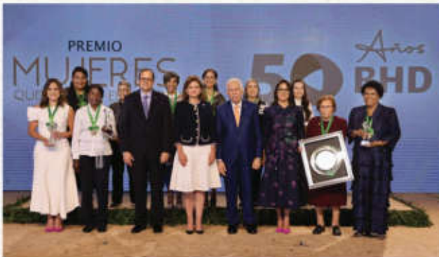
Banco BHD entrega el premio Mujeres que Cambian el Mundo