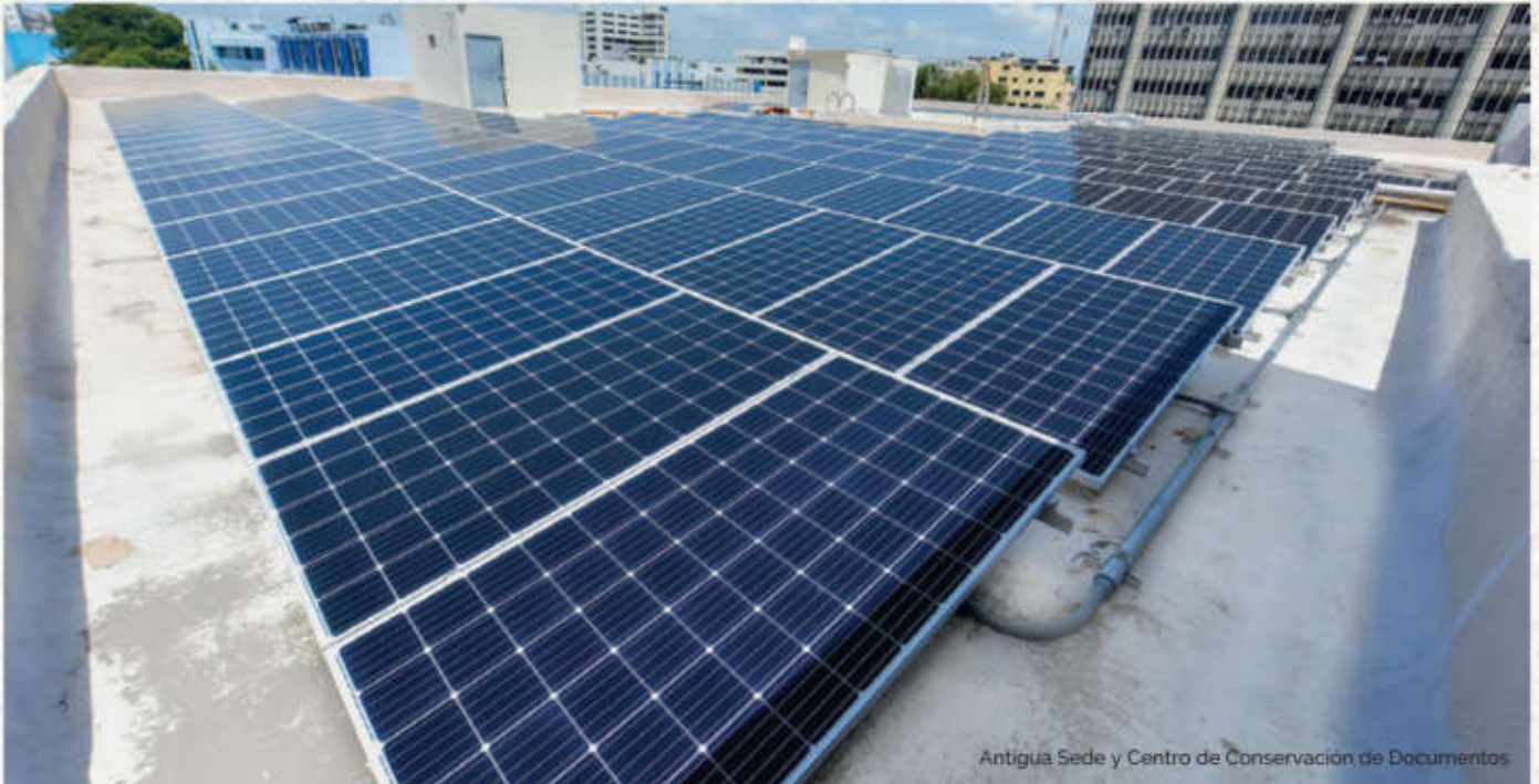
Antigua Sede y Centro de Conservación de Documentos

E l Banco Central de la República Dominicana (BCRD) ha tomado la iniciativa de adscribirse a las acciones que contribuyan a preservar la naturaleza y a su vez, cooperar a que los daños causados por el cambio climático impacten lo menos posible en el medioambiente. En este contexto, se han adoptado medidas como la generación de energía mediante procedimientos que aprovechen los recursos naturales.