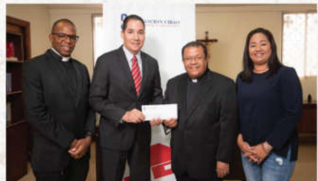
Asociación Cibao contribuye con la restauración de 107 hogares afectados por huracán Fiona