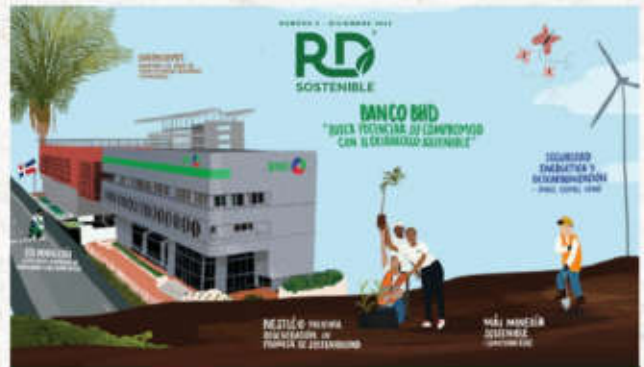
Revista RD Sostenible presenta su 5to número