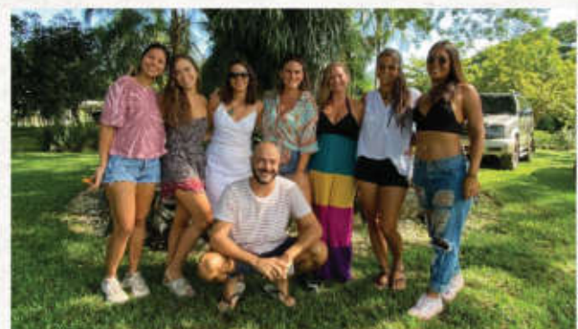
Celebran Ecofest RD un evento que conecta sostenibilidad, educación y diversión