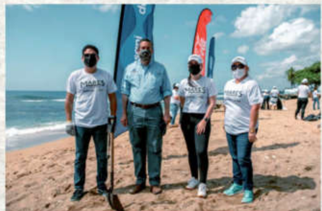
Conmemoran Día Internacional de Limpieza de Costas.