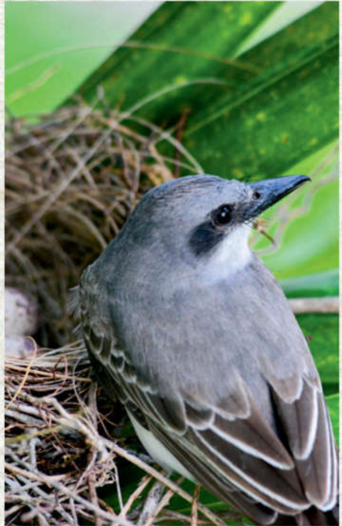
Petigre, Fuente externa

Reducir las emisiones de carbono también está en la lista de Cap Cana. Para ello, utilizan un sistema de riego de aguas tratadas y una generación eléctrica con impacto mínimo de CO 2 . Además de un parque de paneles solares con capacidad de 200 kw, para un total de 1.140 paneles.