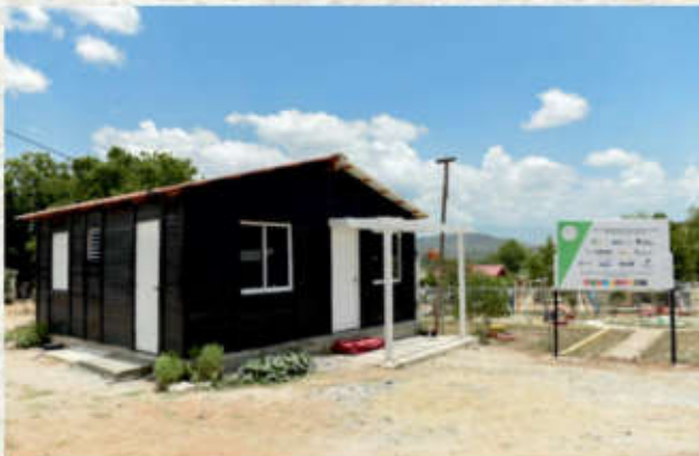
Inauguran primera comunidad autosostenible en Azua.