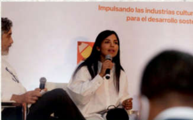
Las industrias culturales y creativas abren puerta para atraer inversiones extranjeras al país.