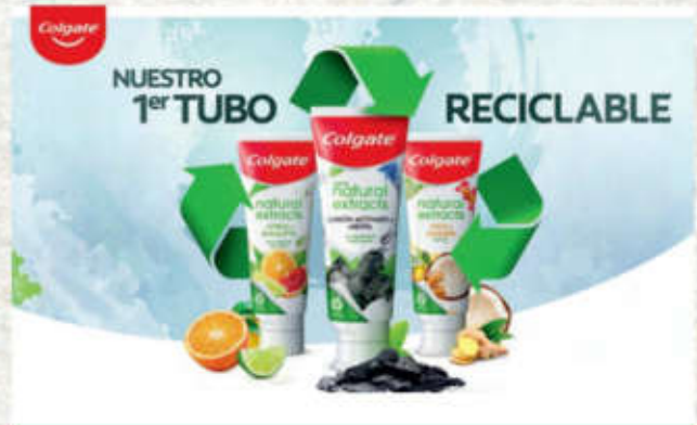
Colgate coloca en el mercado la primera crema dental con tubo 100% reciclable.