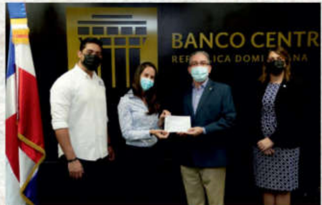
Voluntariado Bancentraliano dona fondos a cuatro fundaciones en el Primer Maratón de la Esperanza.