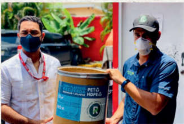
El Nuevo Diario se convierte en el primer medio en reciclar lo que consume.