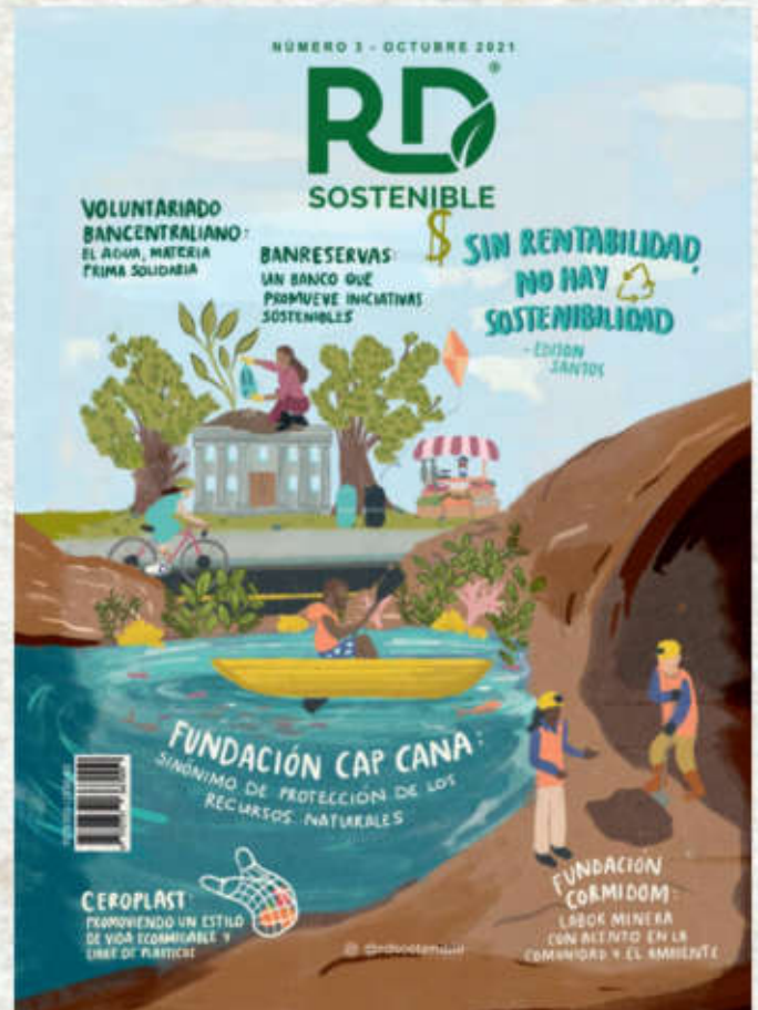
ILUSTRACIÓN DE PORTADA POR ANNETTE GONZÁLEZ ESPAÑOL IMÁGENES: RICKY TAPIA .

RD SOSTENIBLE ES UNA PUBLICACIÓN SEMESTRAL DE DISRUPCIÓN SOSTENIBLE, E.I.R.L. DEDICADA A PROMOVER NOTICIAS, TENDENCIAS Y BUENAS PRÁCTICAS DE RESPONSABILIDAD SOCIAL EMPRESARIAL Y SOSTENIBILIDAD EN LA REPÚBLICA DOMINICANA.