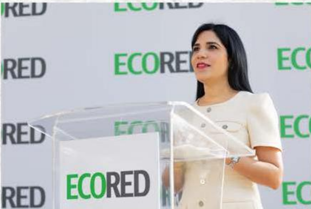
ECORED elige nueva directiva y reafirma su compromiso con la sostenibilidad