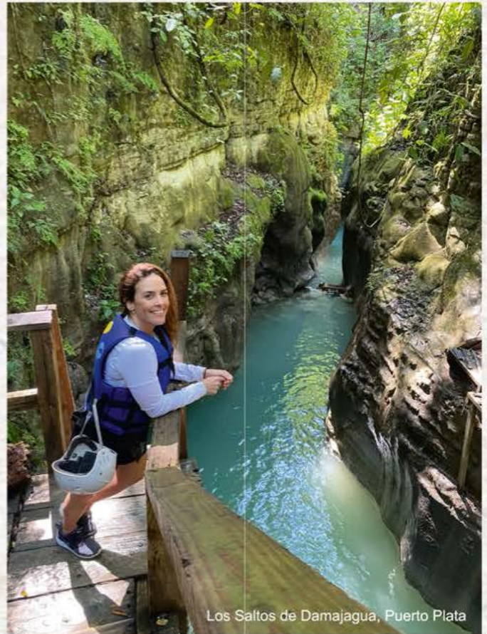
Los Saltos de Damajagua, Puerto Plata

- Llevar siempre un botiquín de primeros auxilios y medicamentos.