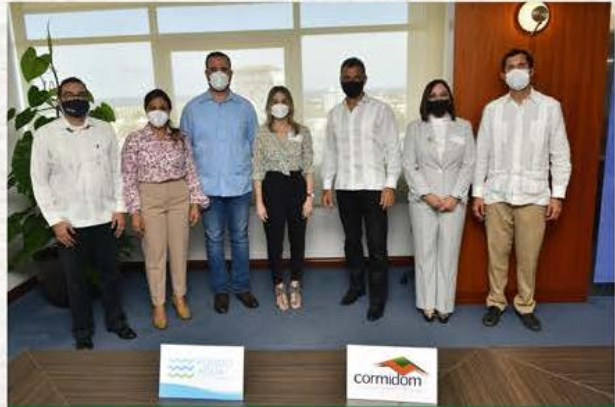
CORMIDOM y el Fondo Agua de Santo Domingo suscriben acuerdo para enfrentar desafíos del Cambio Climático