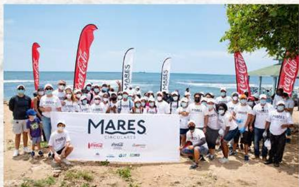
Mares Circulares y Bepensa Dominicana realizan limpieza de costas