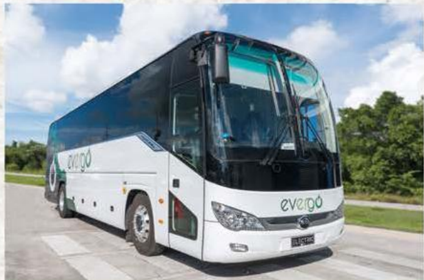
Evergo presenta el primer autobús eléctrico de la República Dominicana