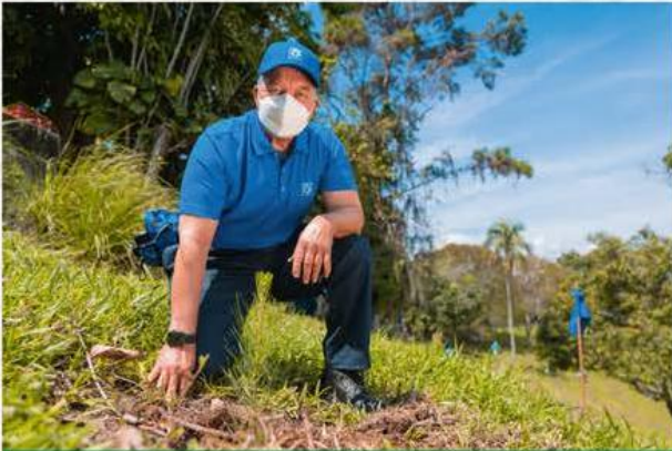
Grupo Popular siembra 1,500 árboles en el Plan Sierra