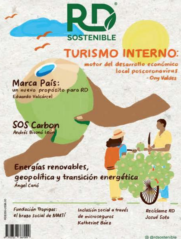
ILUSTRACIÓN DE PORTADA POR AIMÉE MAZARA .

COLABORADORES INDIRA LORENZO EDUARDO VALCÁRCEL ÁNGEL S. CANÓ KATHERINE BÁEZ JOSUÉ SOTO ANDRÉS BISONO ONY VALDEZ