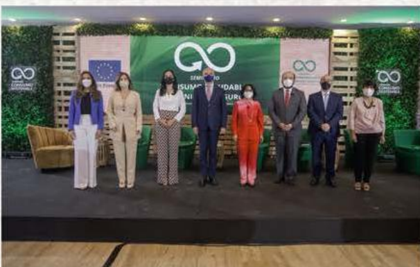
La Unión Europea, ANJE y otras instituciones promueven consumo sostenible