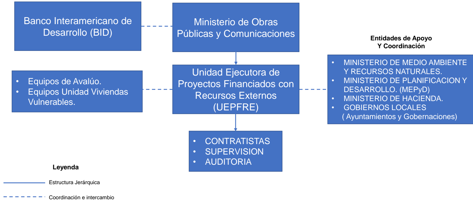
Figura 3.1.a Esquema General de Ejecución del Programa DR-L1151