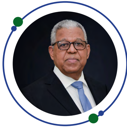
Ruben Silié Viceministro de Política Exterior Multilateral

R epública Dominicana forma parte de las naciones del mundo que aúnan esfuerzos a nivel global, regional y local para la protección del medioambiente, los recursos naturales y la lucha contra los efectos del cambio climático. Con la firma del Acuerdo de París y el Protocolo de Kioto aspiramos a que con nuestras acciones eviten el incremento de la temperatura media mundial de 2°C, con reducción progresiva hacia 1.5°C.