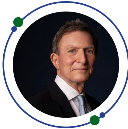
Roberto Álvarez Ministro de Relaciones Exteriores

E s un honor para el Ministerio de Relaciones Exteriores presentarles la Guía de Implementación de Embajadas Verdes, con la cual reafirmamos nuestro compromiso con la sostenibilidad y el cumplimiento de la Agenda 2030 de los Objetivos de Desarrollo Sostenible (ODS).