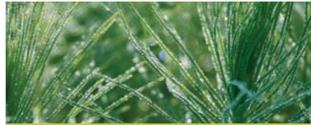
Viveros Padre Las Casas y Sabana San Juan

La Fundación Sur Futuro colabora con las actividades de reforestación que se realizan en todo el territorio nacional. Para estos fines, ha despachado 400 mil plantas, especialmente a los frentes que trabajan con el proyecto Nacional Quisqueya Verde. Las plantas de frutales se distribuyeron mayormente entre los productores del área de incidencia de la presa de Sabana Yegua.