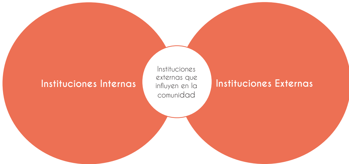
Imagen 1 - Diagrama de Venn

Para dejar registradas las instituciones identificadas, será de utilidad completar el siguiente cuadro que podrá servir de directorio para casos en que se necesite ponerse en contacto con las instituciones.